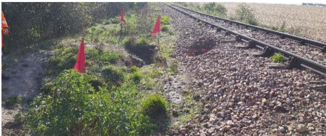
Terriers près de Pithiviers (45) ayant entraîné l'arrêt de la circulation des trains

Les dégâts sur les voies ferrées sont les mieux connus. Les terriers de blaireaux provoquent des risques d'affaissement et de déraillement. Cela peut conduire à l'arrêt des trains (12 % des cas) ou à des ralentissements de la vitesse de circulation (35 % des cas). La SNCF répertorie 173 incidents en 25 ans. Ils sont en croissance. Des travaux importants peuvent être nécessaires avec un coût compris entre 80 000 et plus de 400 000 euros pour l'injection de ciment sous pression et le renforcement des remblais.