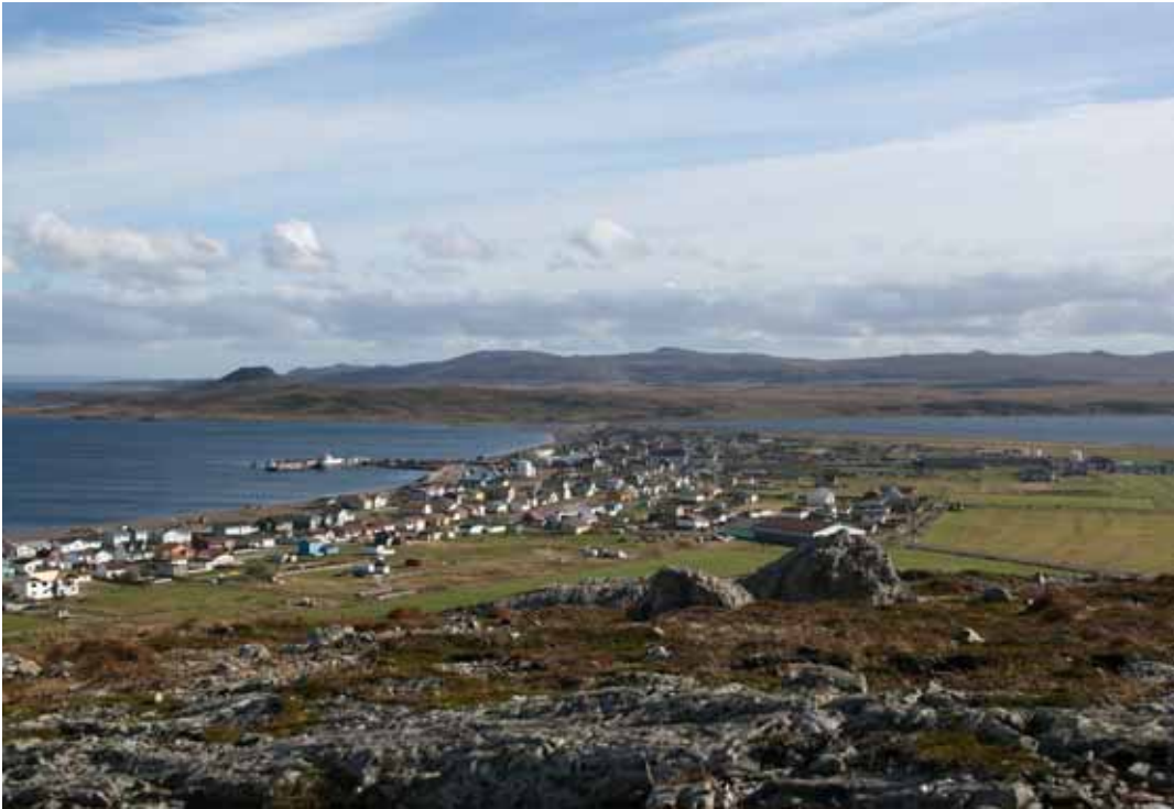
Le village de Miquelon

Saint-Pierre-et-Miquelon est desservi par une unique compagnie aérienne, Air Saint Pierre, soumise à des obligations de service public, pour les liaisons avec le continent américain (Canada), et qui dessert Montréal permettant une liaison vers la métropole via diverses compagnies transatlantiques.