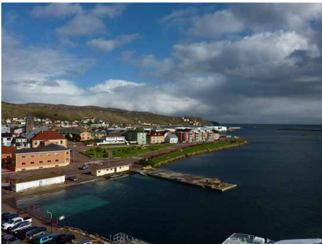
La préfecture et le port de Saint-Pierre

Plusieurs représentants syndicaux ont souligné que certains domaines d'activité économique étaient entre les mains de monopoles, qu'il s'agisse des hydrocarbures, des télécommunications ou du transport international. Relevant que la chaîne de formation des prix pouvait être faussée par l'organisation du transport de fret vers l'archipel et du commerce, ils ont expliqué qu'une partie de la population, notamment parmi les retraités, ne pouvait faire face à des prix très élevés 1 .