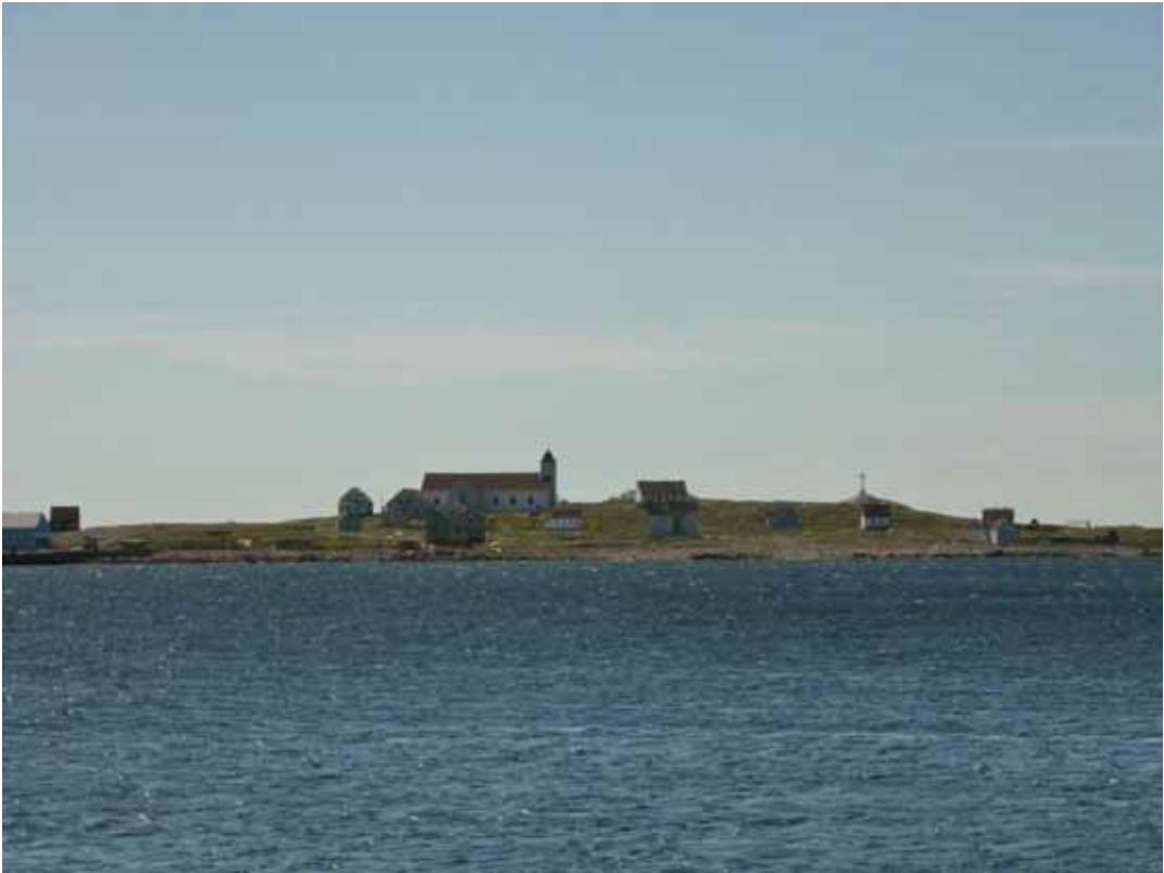
Vue de l'Île aux Marins depuis le quai en eau profonde de Saint-Pierre