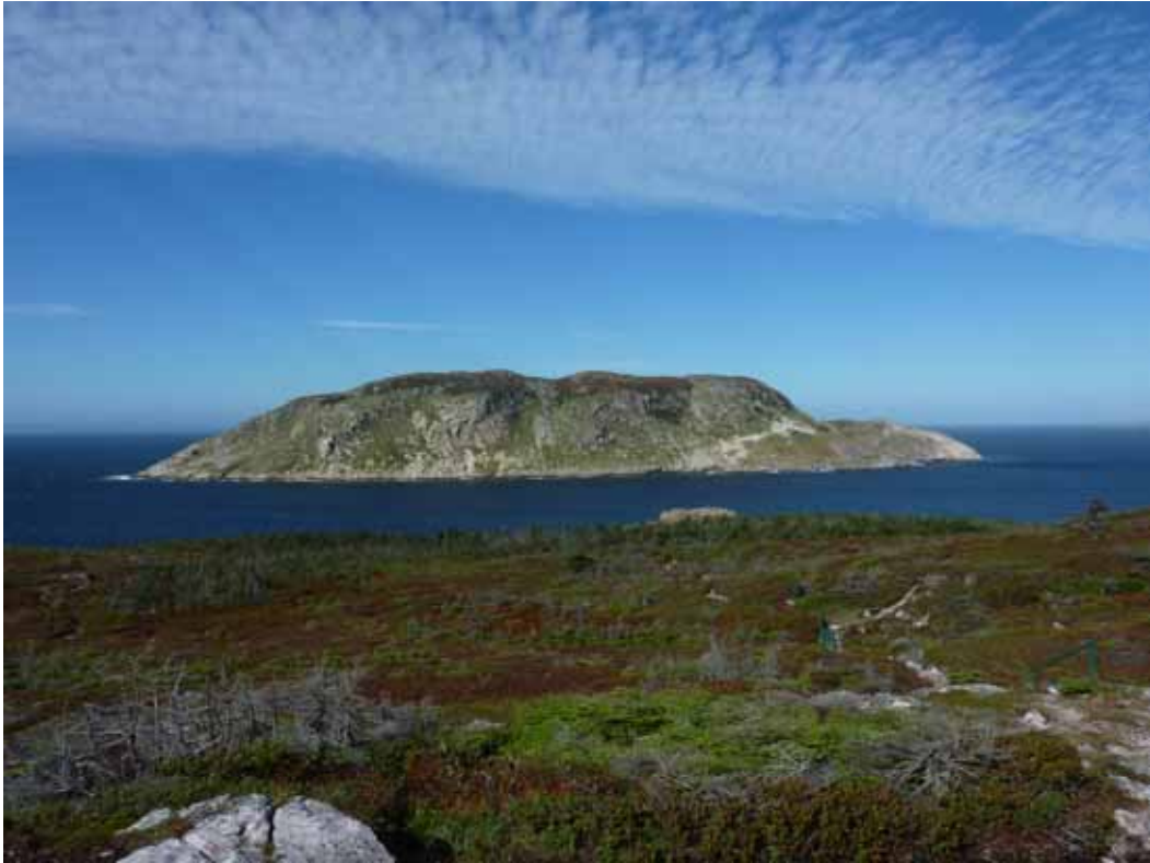
Le Grand Colombier

Le commissaire-enquêteur relève que « les lacunes et imprécisions » relevées dans le dossier soumis à l'avis du public « auraient pu être évitées si l'appui technique et méthodologique d'un DIREN 1 , tel que prévu dans le courrier du ministère de l'écologie en date du 21 mai 2008, avait été mis en place ».