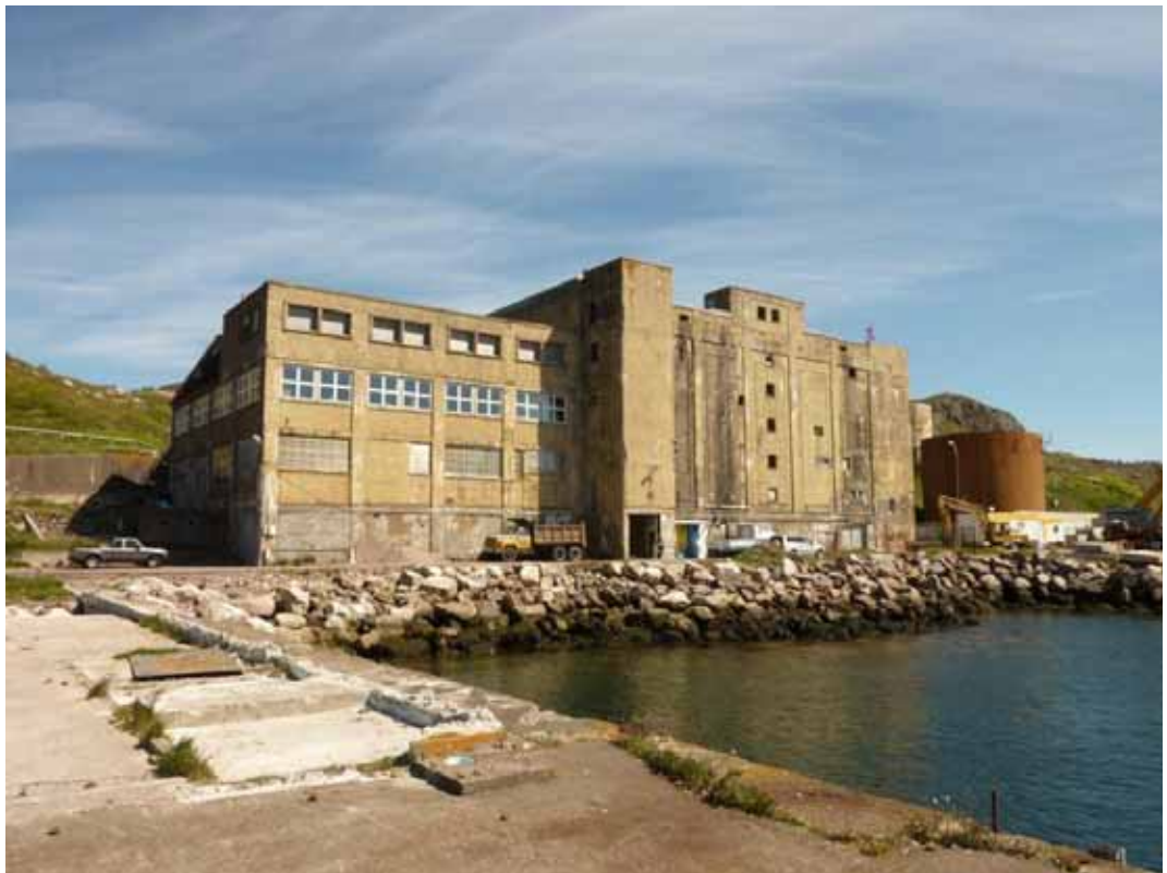
Vue de l'entrepôt frigorifique désaffecté depuis le quai en eau profonde de Saint-Pierre