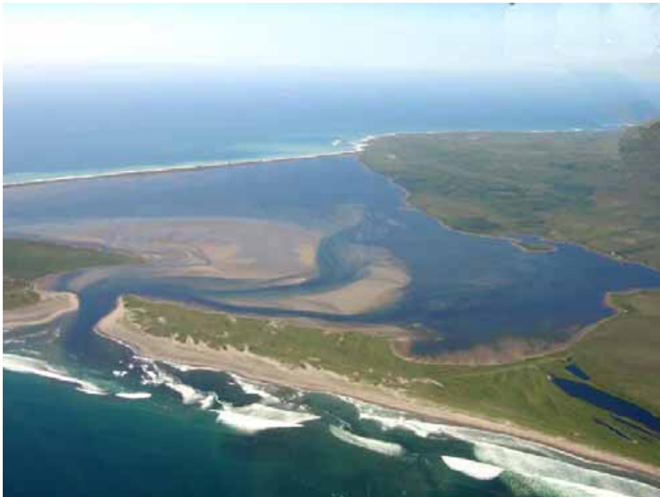
Vue aérienne du Grand Barchois et du Goulet

L'association SPM Frag'îles promeut en outre l'idée d'un observatoire marin, en raison du passage de nombreux mammifères marins, dont des baleines à bosse, et de tortues marines, près des côtes de l'archipel.