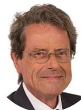
Alain Milon Sénateur (LR) de Vaucluse Rapporteur