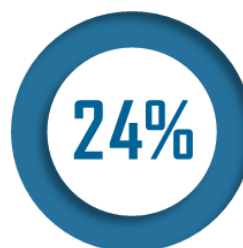
Part des centres de santé médicaux ou polyvalents gérés par des collectivités