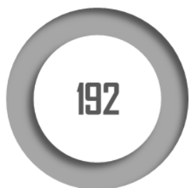
Nombre de centres de santé gérés par des collectivités territoriales

L'article 33 précise que les professionnels – administratifs ou de santé – exerçant, sous le régime du salariat, au sein des centres de santé créés et gérés par des collectivités territoriales peuvent être des agents de ces collectivités. Cette mesure présentée dans un objectif de sécurisation juridique consacre une pratique existante. Elle ne lève pas toutefois les limites des statuts existants en matière notamment de continuité de carrière des médecins de ces centres. La commission a adopté cet article sous réserve d'un amendement ajoutant la référence aux groupements également susceptibles de créer et de gérer de tels centres.