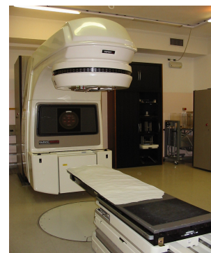
Accélérateur linéaire (RX)

Le Plan Cancer, lancé en 2003 et piloté par l'Institut National du Cancer, (INCA) a permis de rattraper à marche forcée le retard français en matière d'équipements de radiothérapie. Ainsi, les machines au cobalt ont disparu et ont été remplacées par des accélérateurs linéaires.