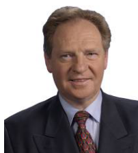
Claude BIRRAUX Député de Haute-Savoie