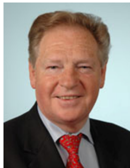
Claude BIRRAUX, Député de Haute-Savoie, Premier Vice-Président de l'OPECST