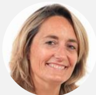
Sophie Primas Présidente Sénateur des Yvelines ( Les Républicains )