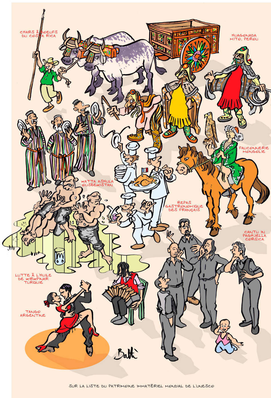
SUR LA LISTE DU PATRIMOINE IMMATÉRIEL MONDIAL DE L'UNESCO