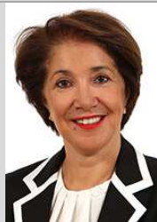
Mme Bariza KHIARI Vice-présidente du Sénat Sénatrice de Paris (SOC)