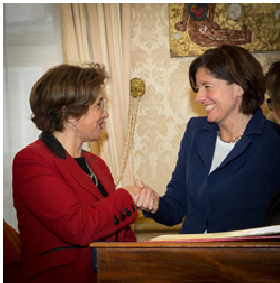
Une étroite coopération entre le Bundesrat et le Sénat

D'autre part, il pourrait être envisagé, lors des rencontres entre les groupes d'amitié France-Allemagne du Bundesrat et du Sénat, d'élaborer un rapport commun sur un sujet d'actualité intéressant à la fois l'Allemagne et la France.