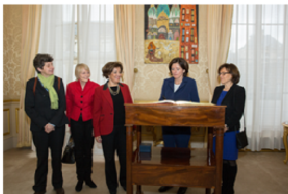
Signature du Livre d'Or de la Présidence par Mme Malu Dreyer