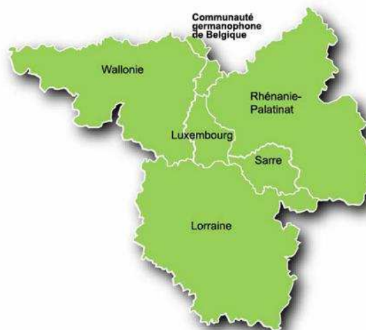
Carte de la Grande Région

En effet, en sa qualité de Ministre-Présidente du Land de Rhénanie-Palatinat, Mme Malu Dreyer est également membre du sommet des exécutifs de la « Grande Région Saar – Lor – Lux – Rhénanie-Palatinat - Wallonie – Communauté germanophone de Belgique » , située entre Rhin, Moselle, Sarre et Meuse, et qui a une superficie totale de 65 401 km 2 .