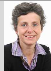
Mme Corinne BOUCHOUX Secrétaire du groupe d'amitié Sénatrice de Maine-et-Loire (ECOLO)

Membres du groupe d'amitié France-Allemagne : http://www.senat.fr/groupe-interparlementaire-amitie/ami_604.html