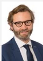
Emmanuel CAPUS Rapporteur spécial Sénateur (Groupe LI-RT) de Maine-et-Loire