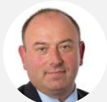
Laurent Duplomb Rapporteur Sénateur ( Les Républicains ) de Haute-Loire