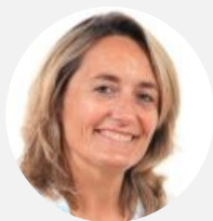
Sophie Primas Présidente de la commission Sénateur ( Les Républicains ) des Yvelines

Elle proposera deux amendements d'appel en séance publique afin de proposer un rétablissement des crédits du CASDAR à hauteur des montants n'ayant pas pu être utilisés depuis 2019 et de proposer une aide de crise ciblée sur l'amont de la chaîne agricole, très touché par la baisse de la demande due au confinement dans certaines filières.