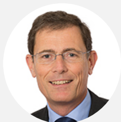
Laurent Lafon Président de la commission, Sénateur du Val-de-Marne (Union Centriste)

La commission de la culture, de l'éducation et de la communication a émis, lors de sa réunion plénière du 3 novembre 2021, un avis de sagesse sur l'adoption des crédits consacrés au sport dans le projet de loi de finances pour 2022.