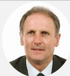
Jean-Jacques Lozach Rapporteur pour avis Sénateur de la Creuse (Socialiste, Écologiste et Républicain)

Commission de la culture, de l'éducation et de la communication