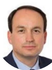
Guillaume Chevrollier Sénateur (Les Républicains) de la Mayenne Rapporteur