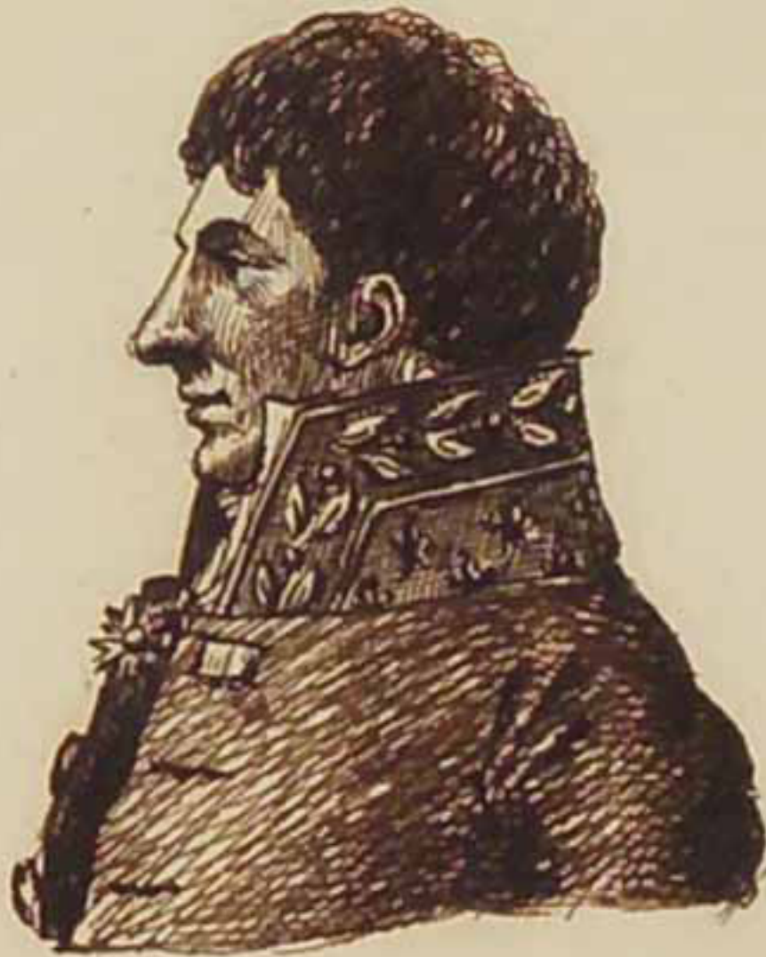
Le Comte de Brigade Aout 1815