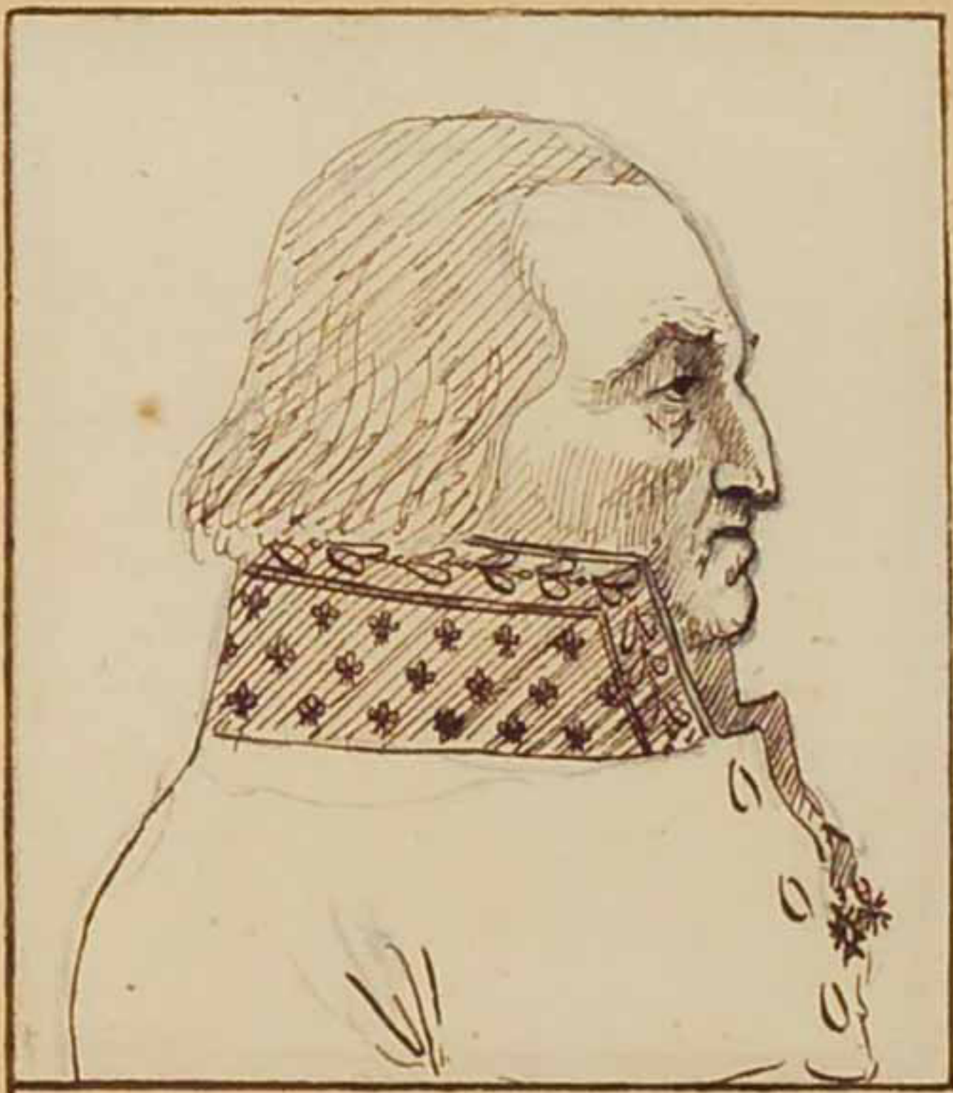
Le Maloney Duc de Conigliano. Mars 1819