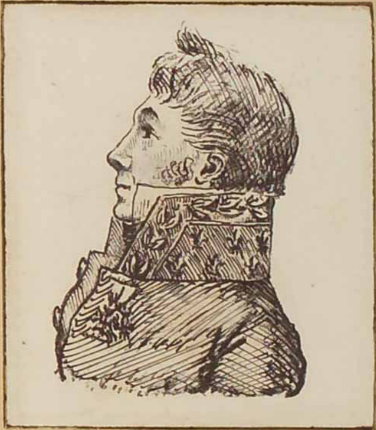
Le Marquis de Vibraye Aout 1815.