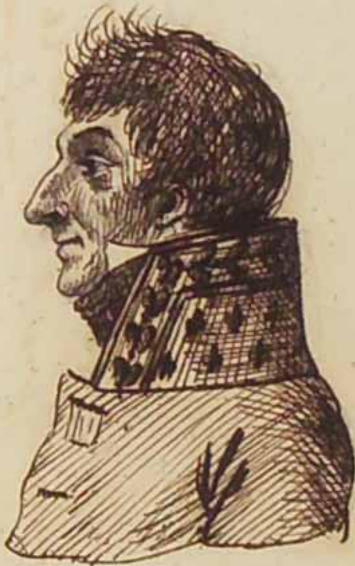
Le Comte de La Roche-Aymon Aout 1815.