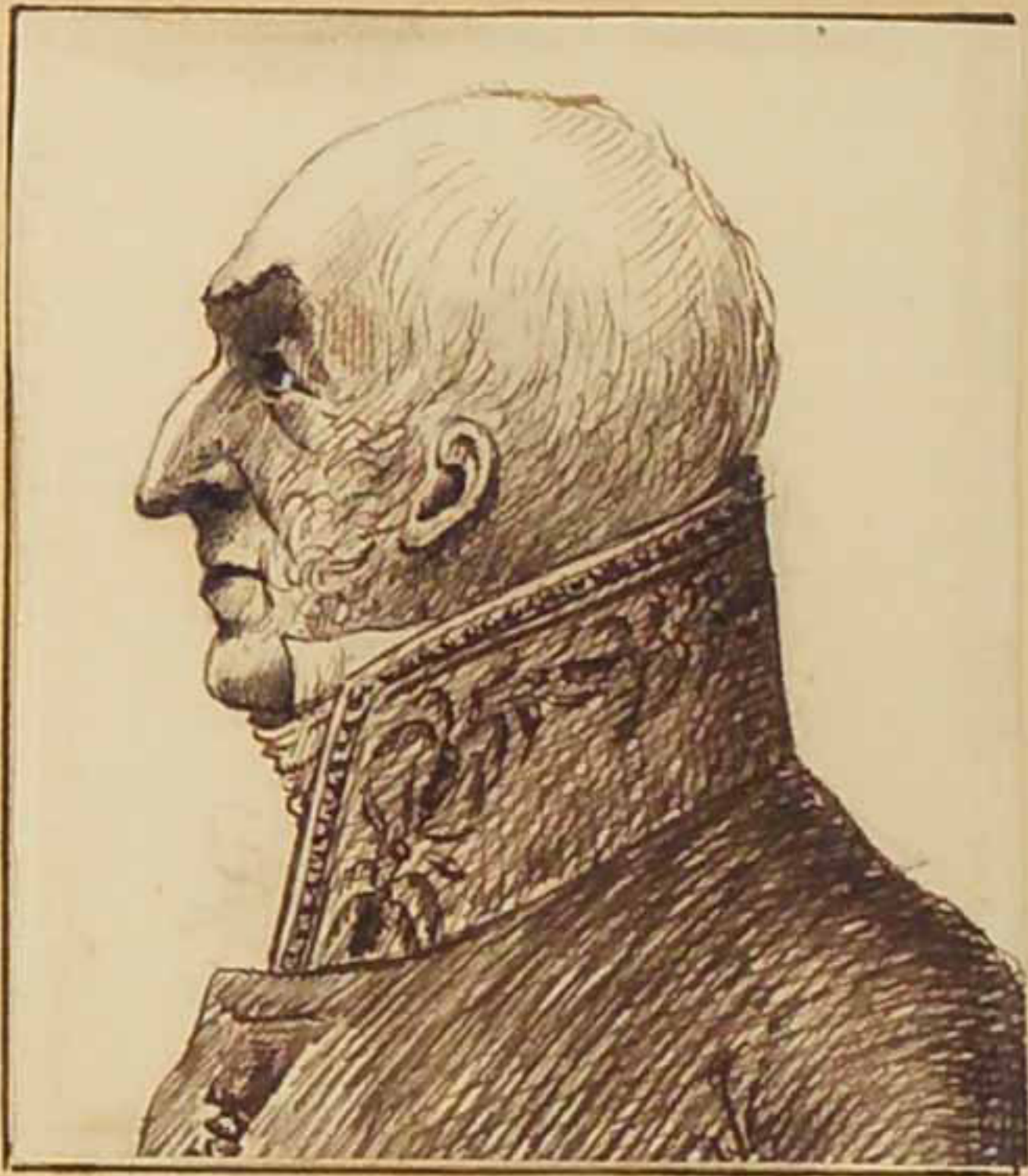
Le Comte de Montlosier