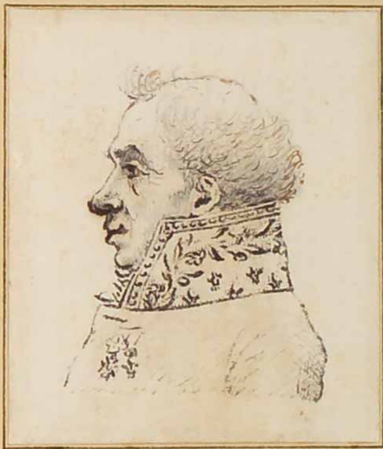
Le Marquis d'Aramon Mars 1819 D'immémoriaire