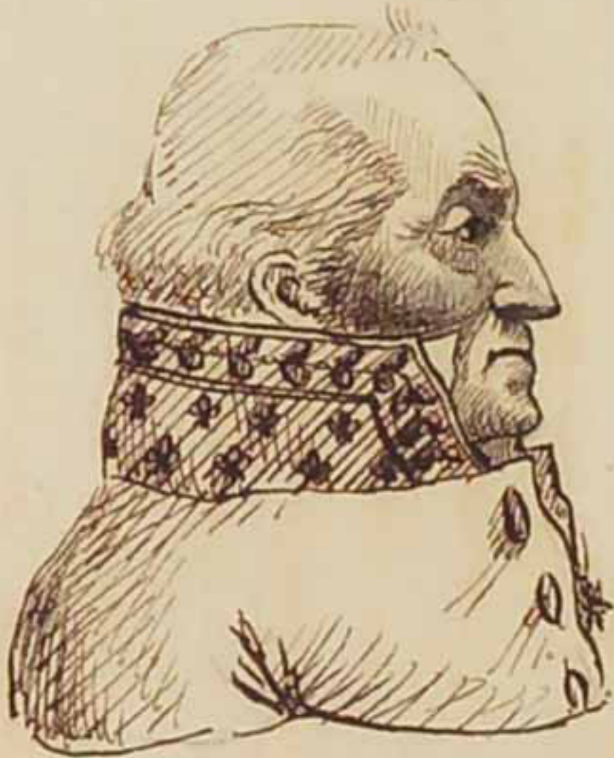
Le Duc d'Angoulême Aout 1815