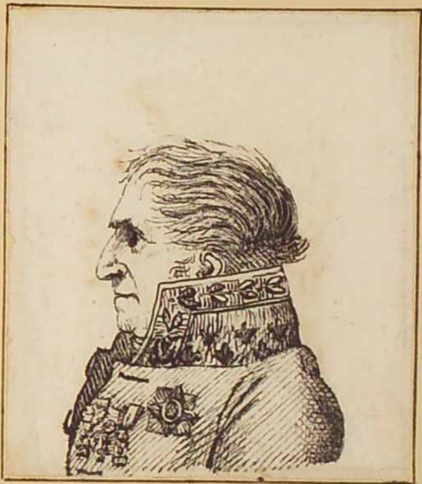
Leferente de Villenarozzy Juin 1814