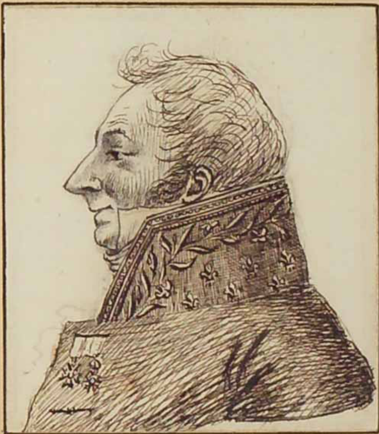
Duke of Rutland March 1819.