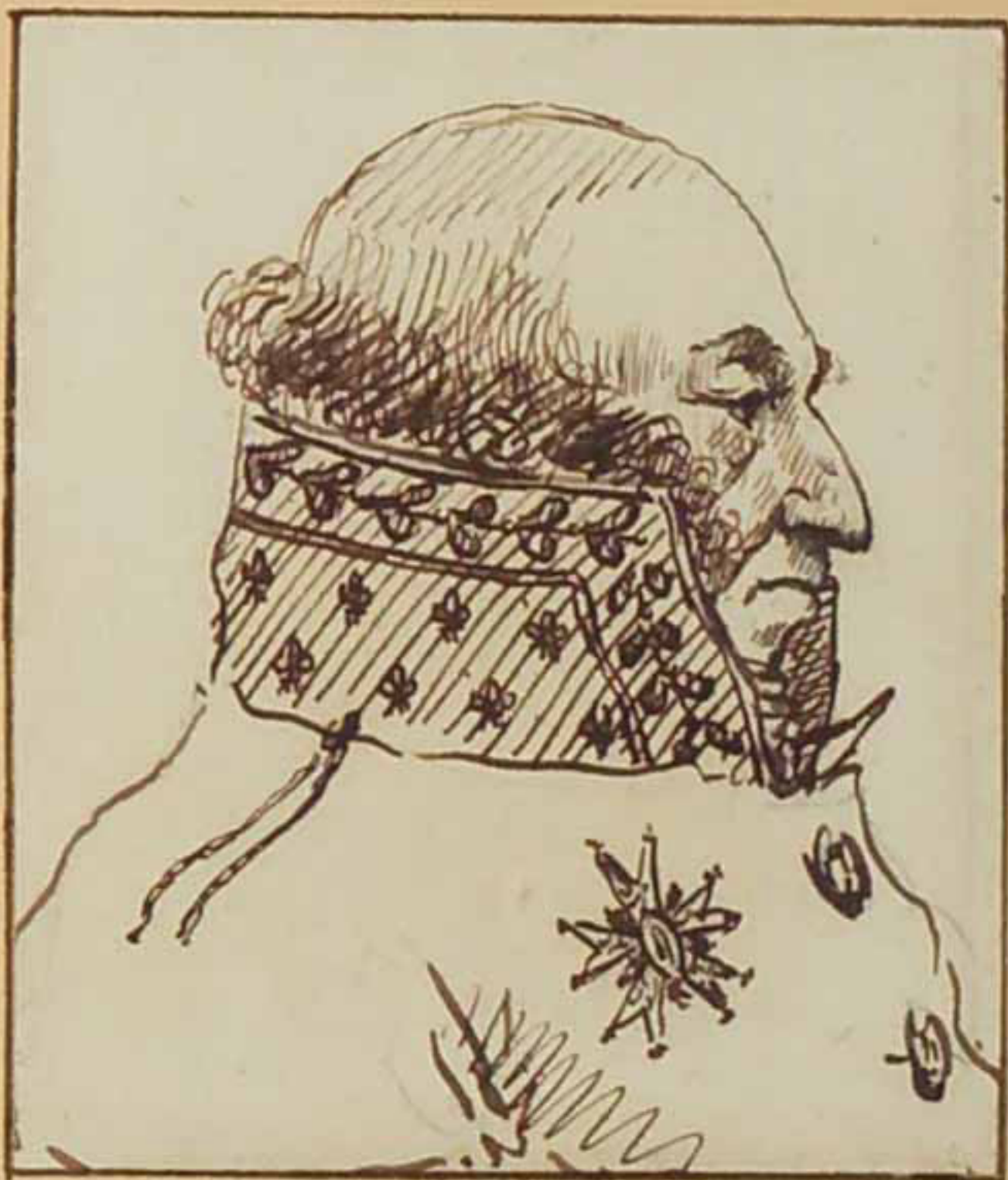
Refrante de Valence. juin 1814. Paris Étante.