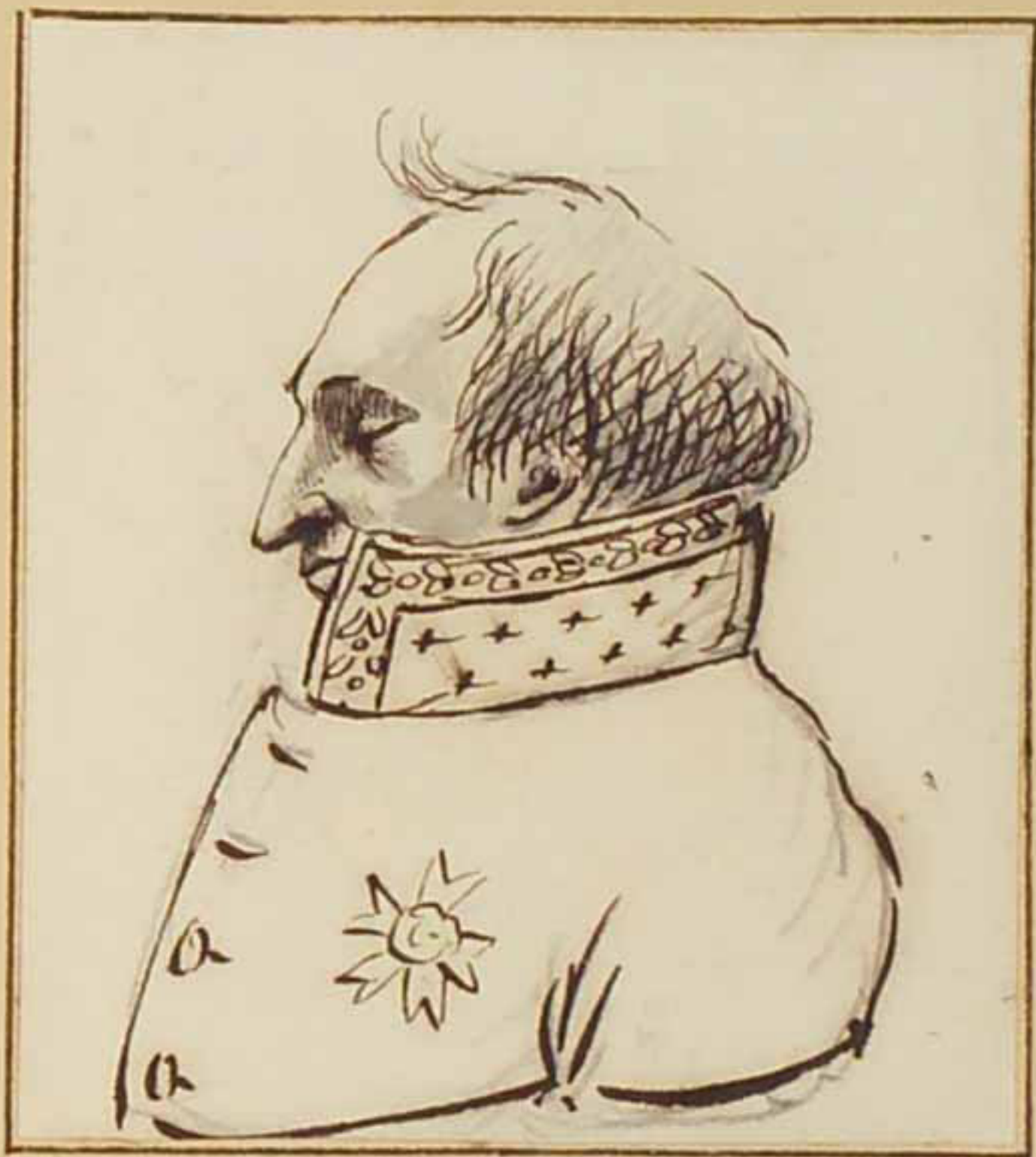
Le Marquis de Marbois juin 1814.