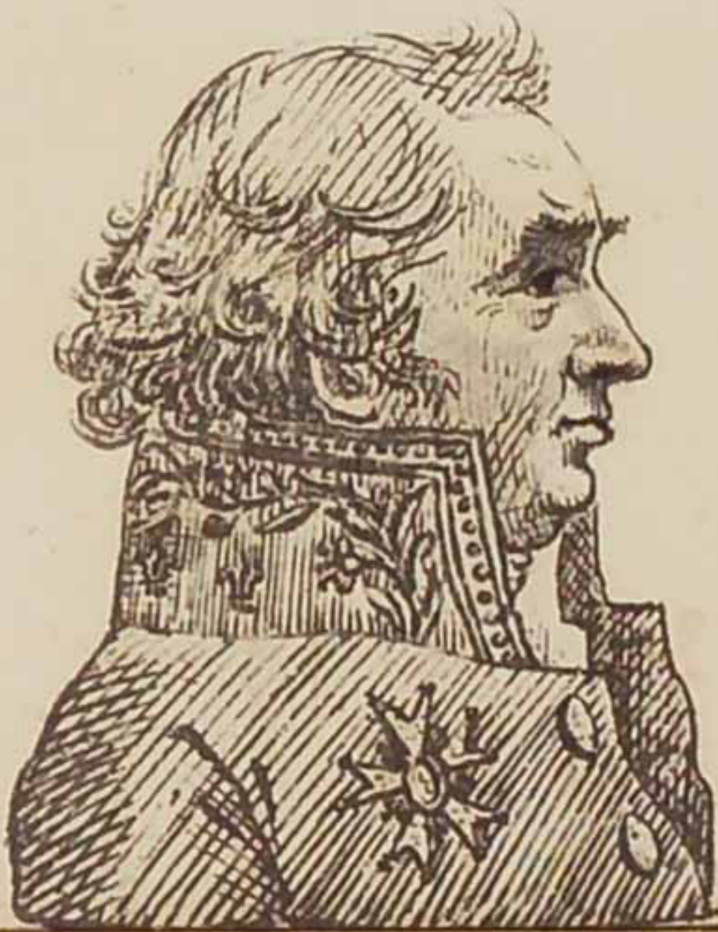
Lefevre Chaptal Mars 1819.