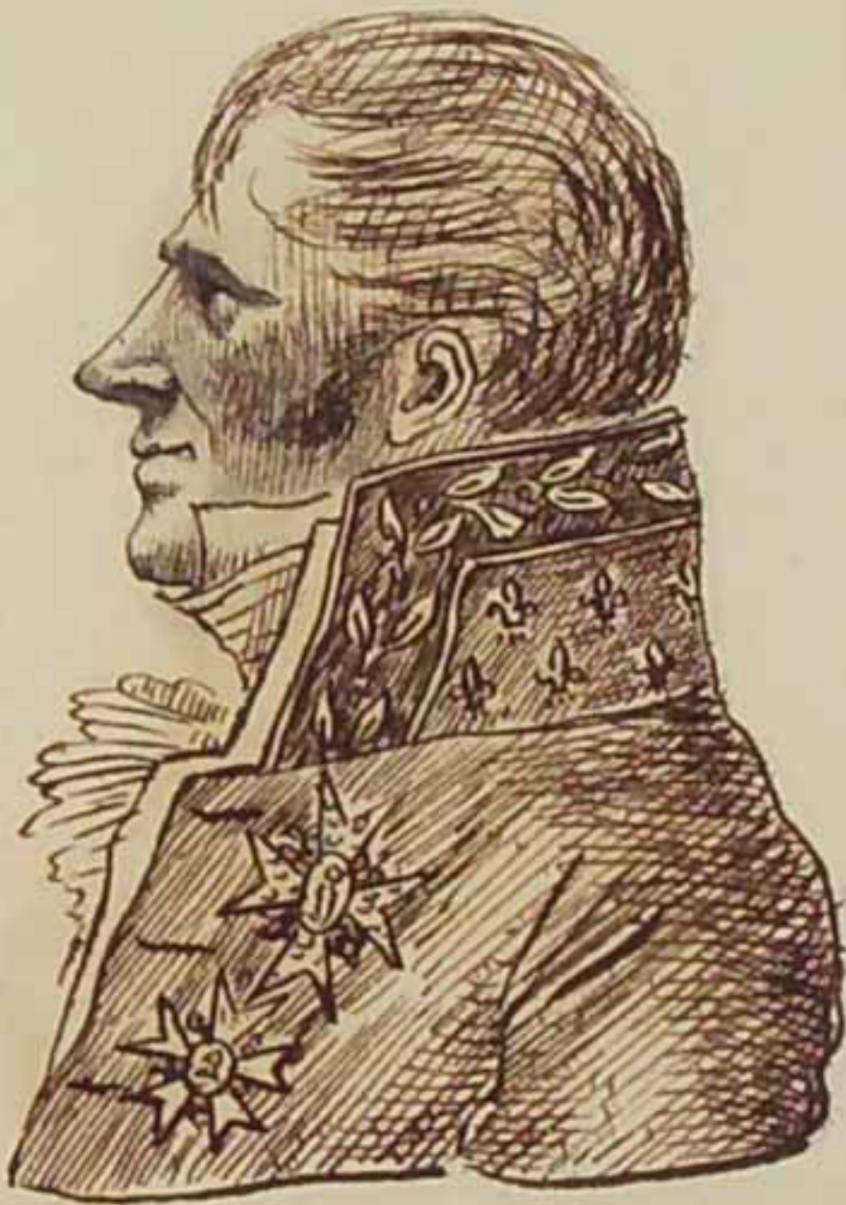
Le maréchal Jourdon S. Cyr. juin 1814