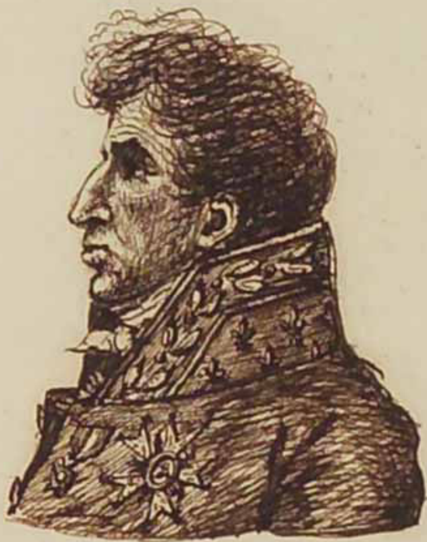
Le Maréchal Marquis de Lauriston. Aout 1815.