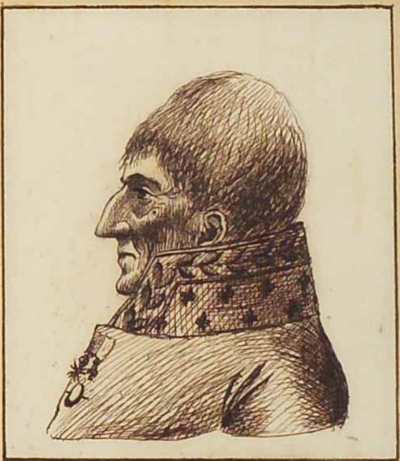
Le Comte Clermont de Ris. Nov. 1819.