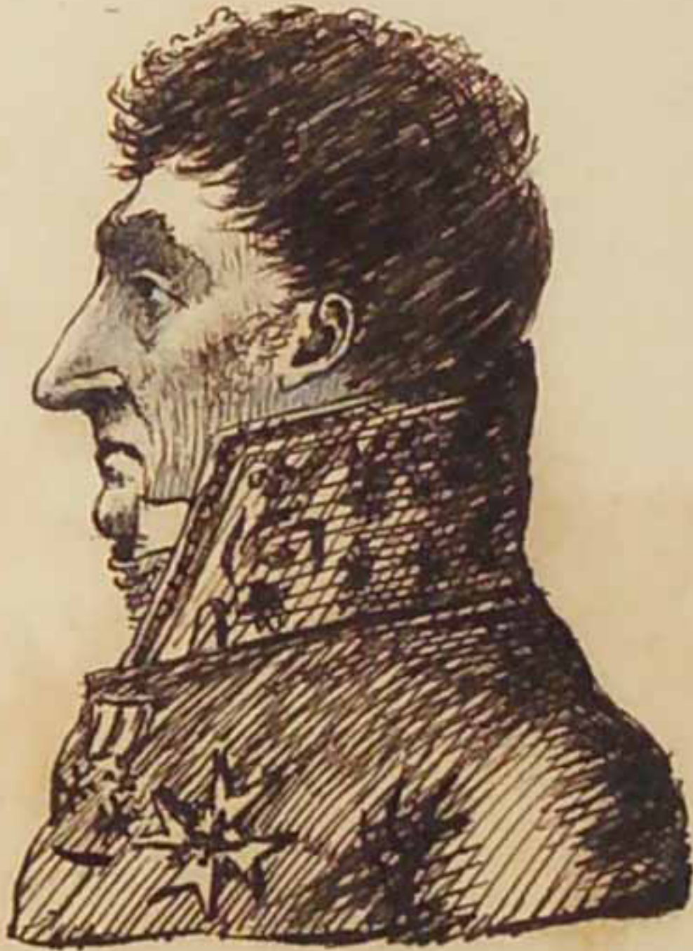
Le Duc de Blacas. Aout 1815.