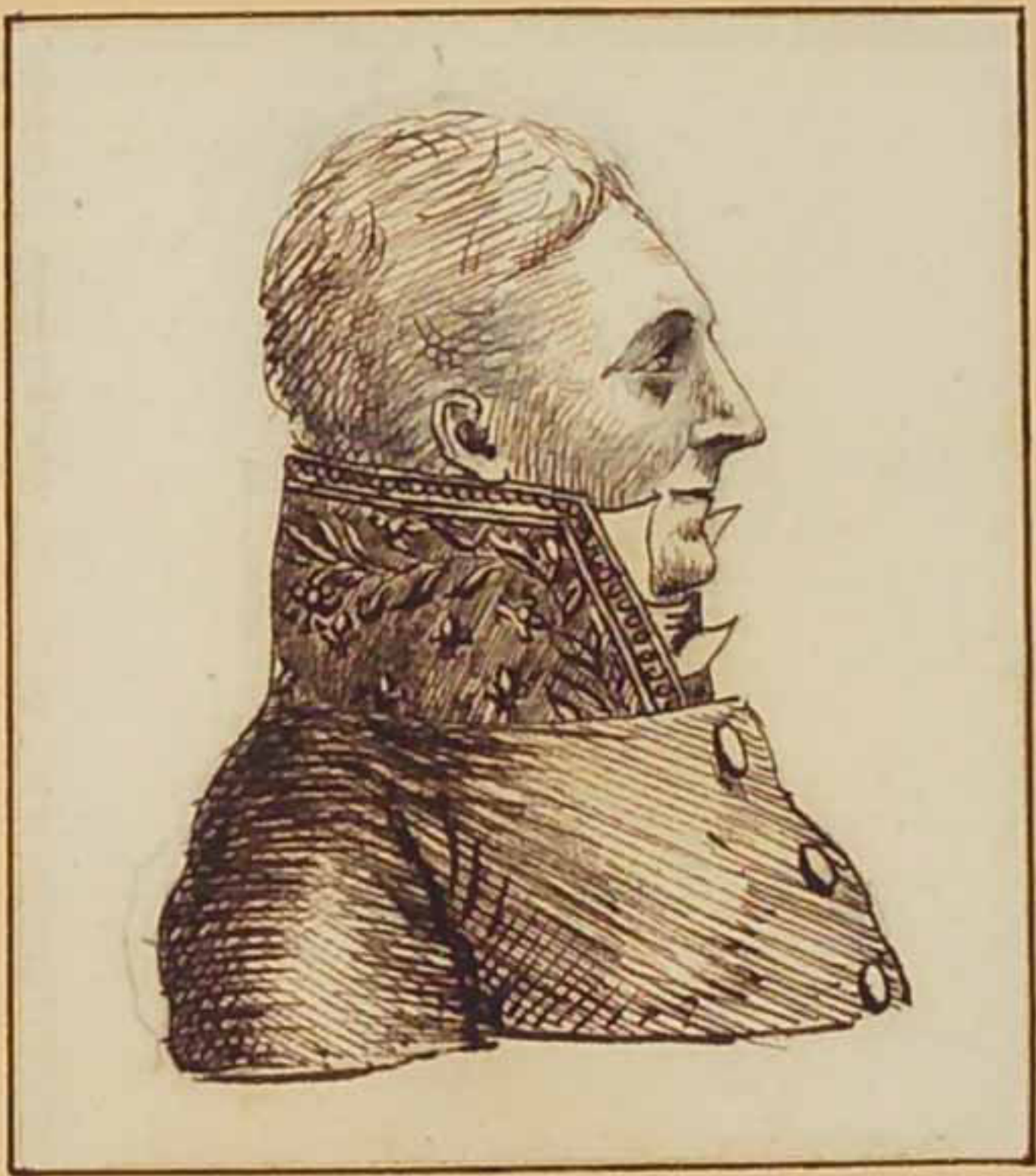
Leconte d'Arayon Mars 1819.