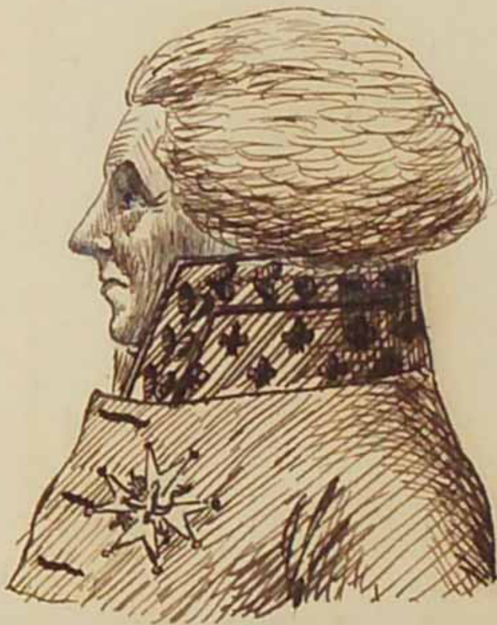
Le Marquis d'Aguéseau Aout 1815. Paris Etinte