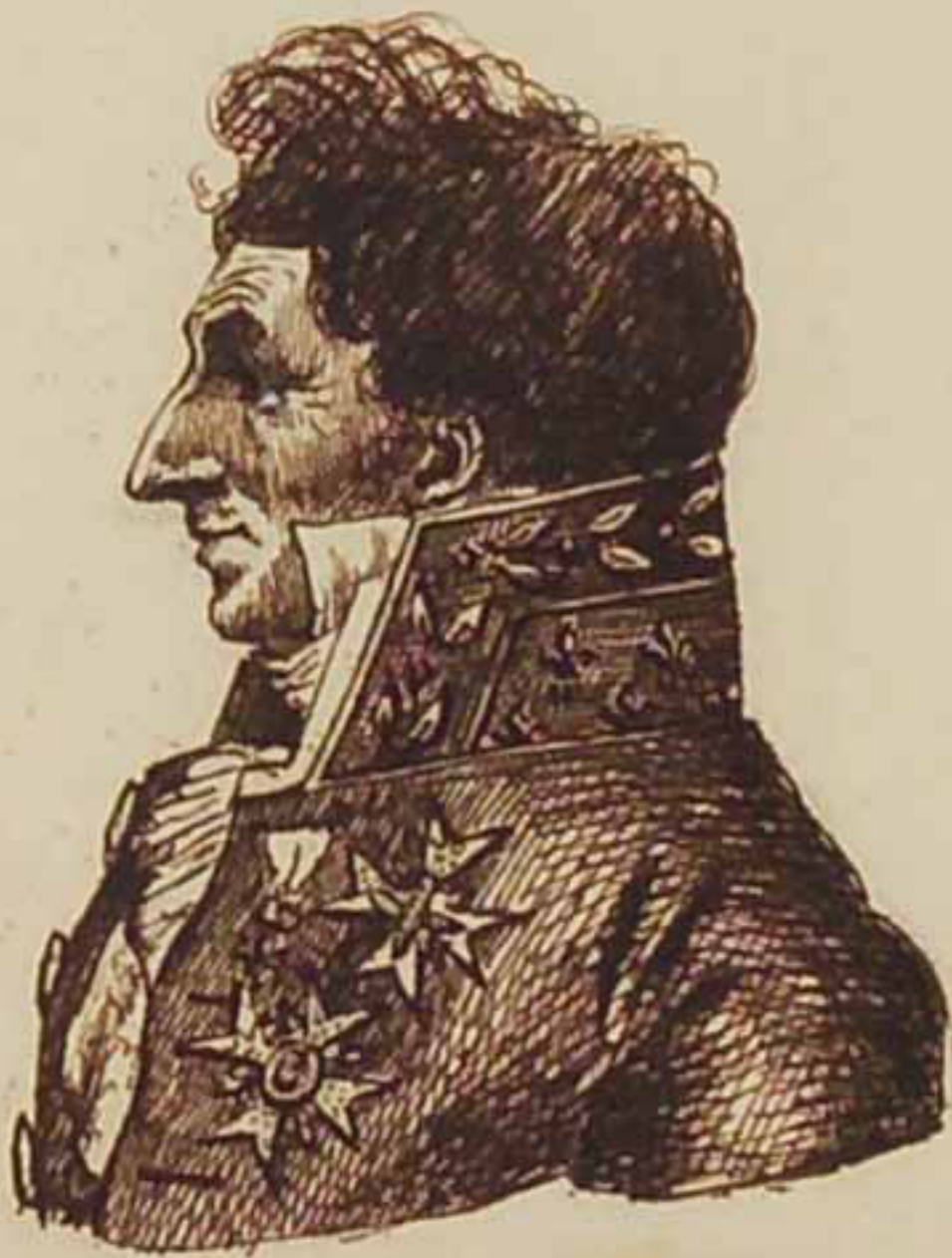
Duc de Riviere. Avant 1815.