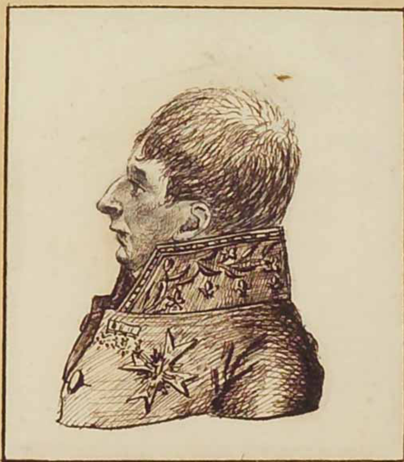
Le Duc d'Angouleme. juin 1814.