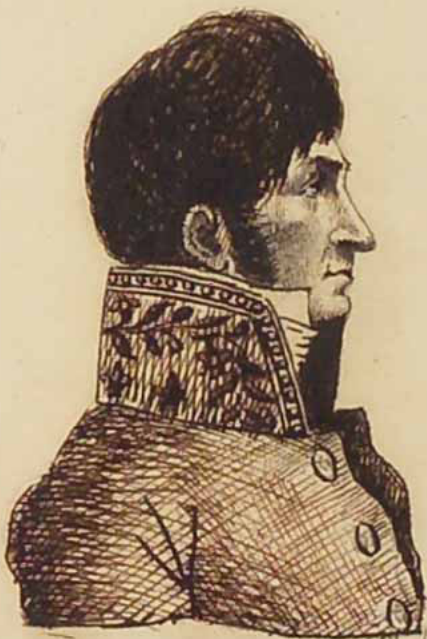
Baron Le Comte de Beuromville. Juin 1844. Avril 1821 Cessionnaire.