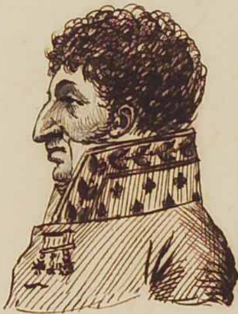
Regent Comte Ricard Aout 1815