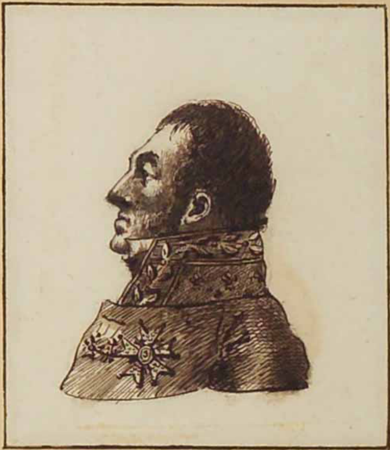
Le général comte Belliard Mars 1819.