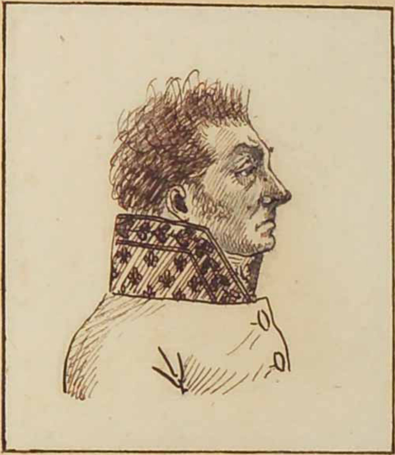
Le Marquis de Catinan Mars 1819.