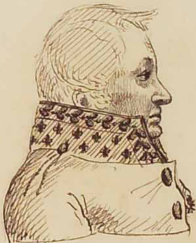
Le Duc de Cadore. Mars 1819.