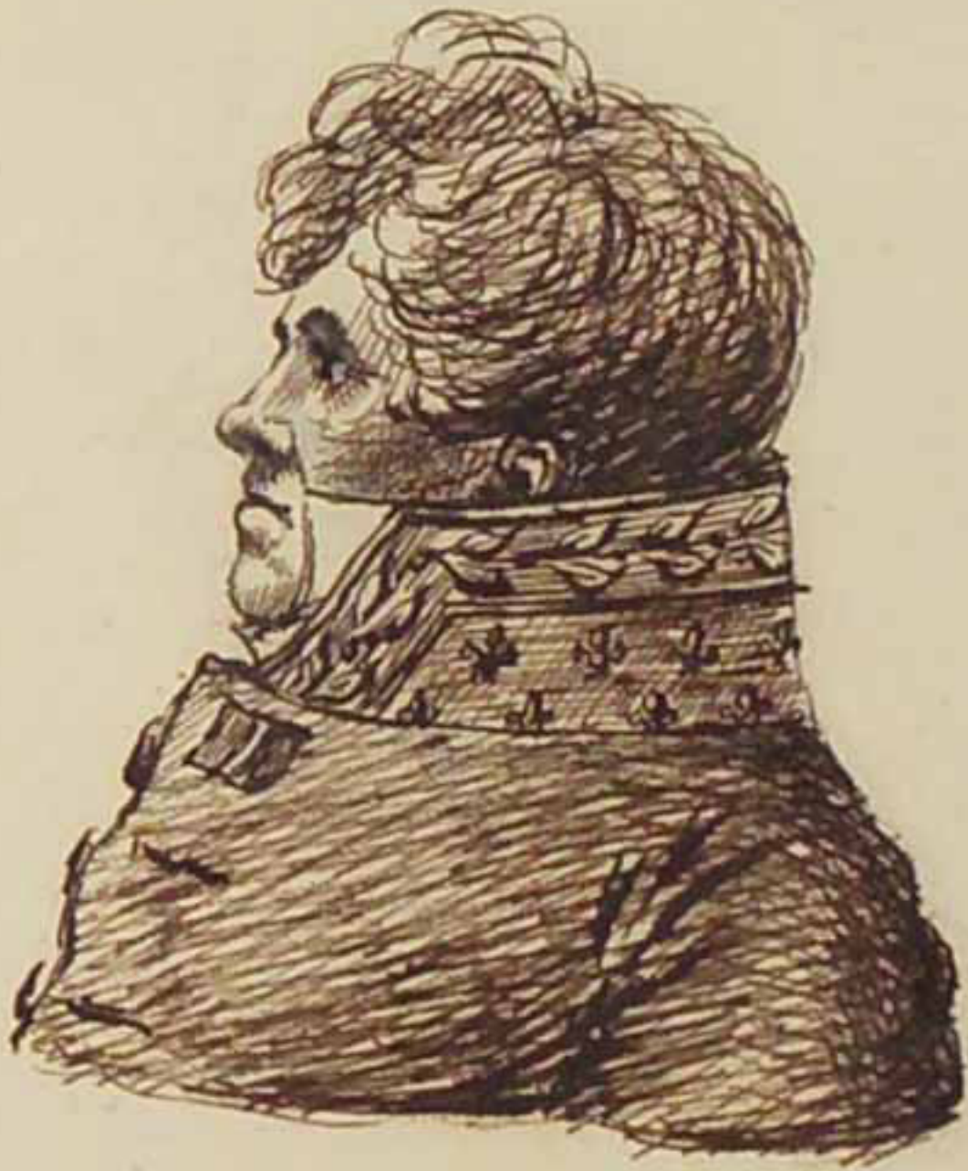
Le Marquis de M... Aout 1815.