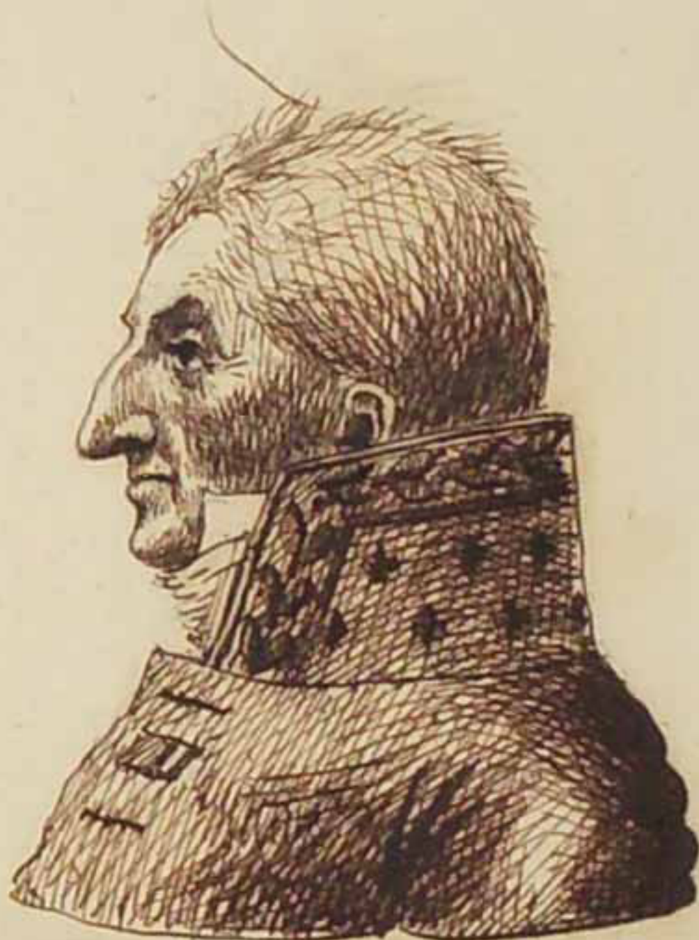
Le Comte Francois d'Escars. Aout 1815