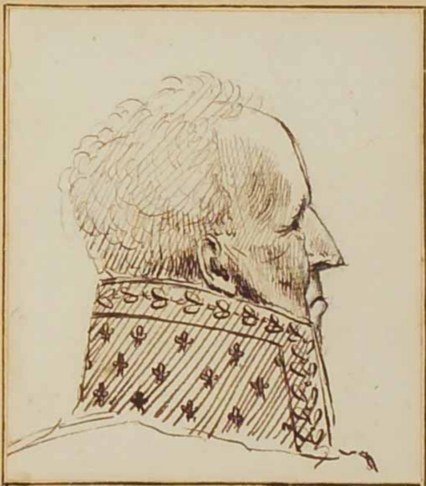
Le Duc de Plaisance. Juin 1814.