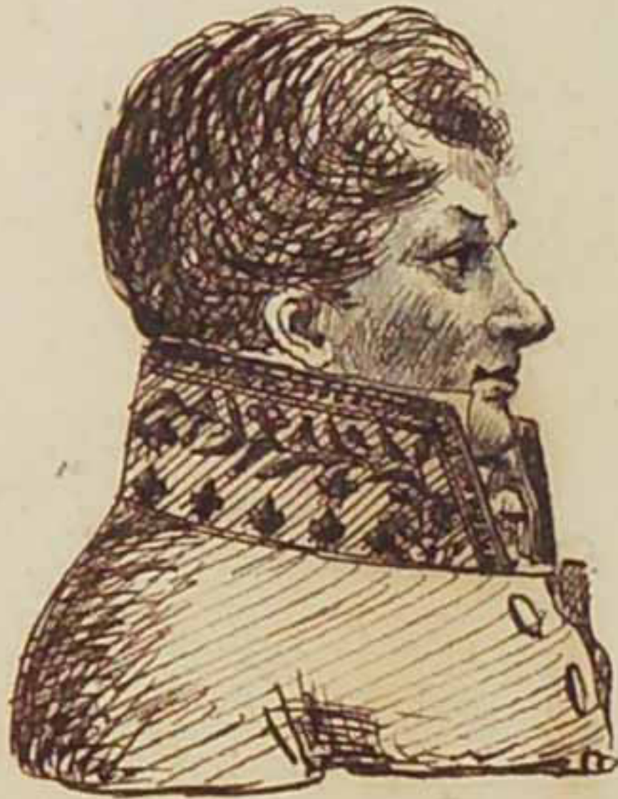
Le Comte d'Houdetot. Mars 1819.