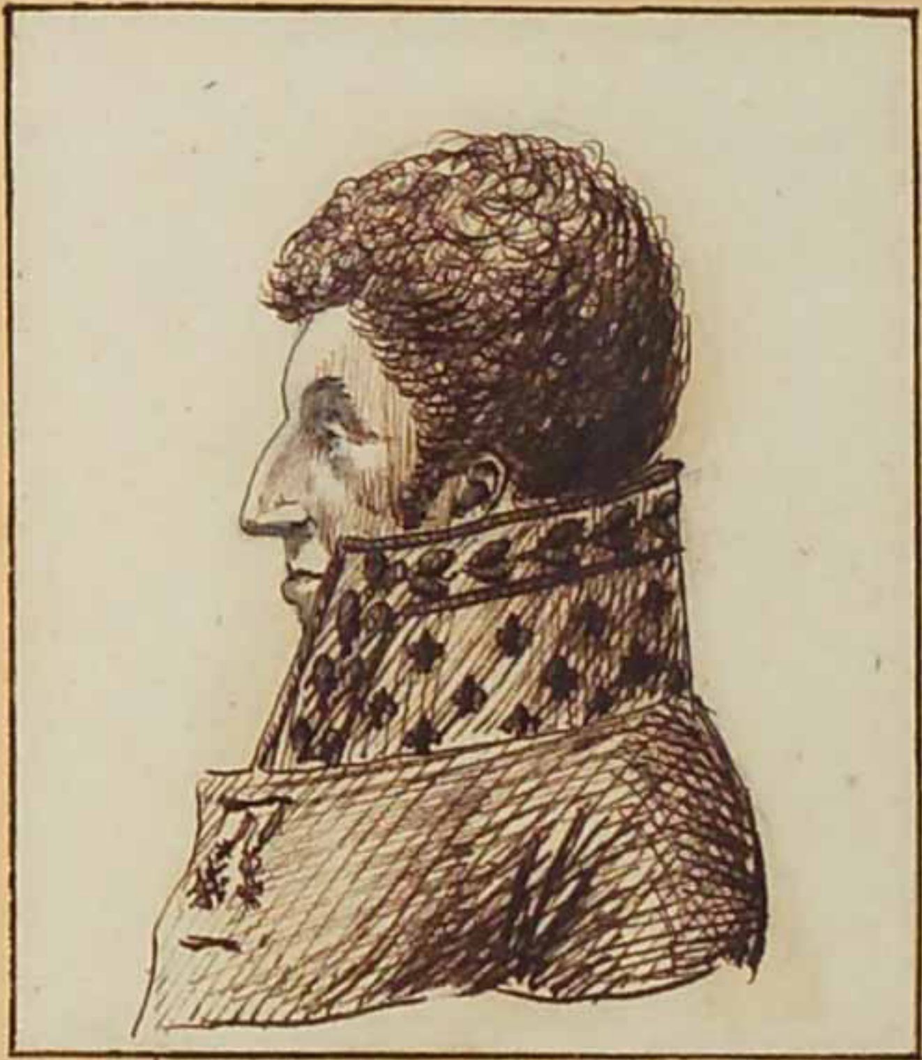
Le Duc Charles de Damas Août 1815.