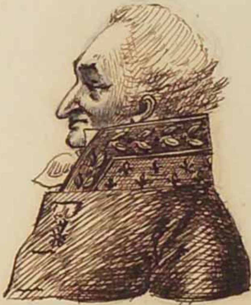
Le Comte Carnot juin 1814.