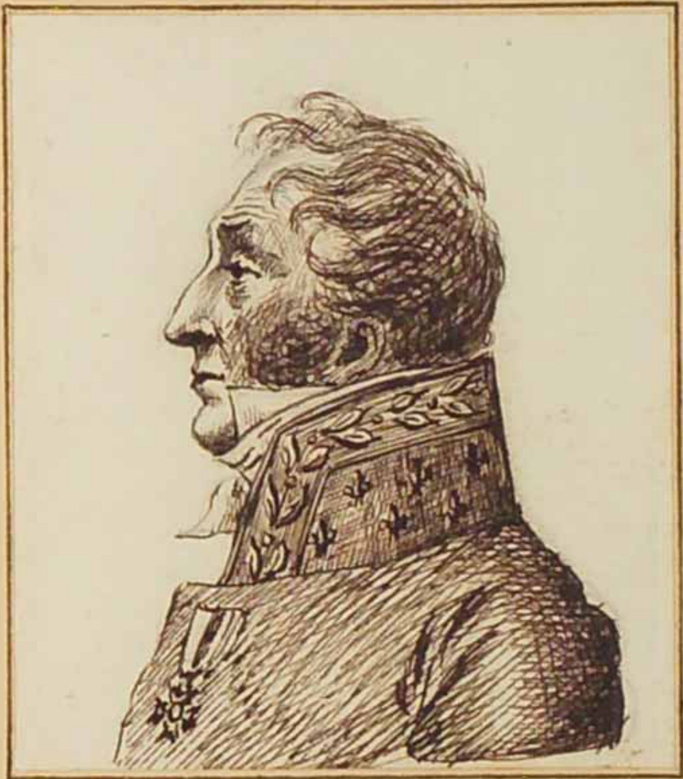
Le Duc Mathieu de Montmorency. Avril 1815.