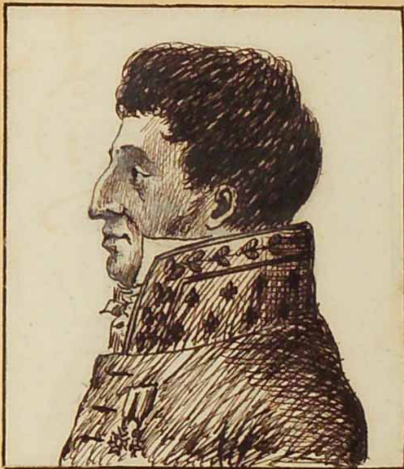
Le Marquis de Louvois Avant 1815.