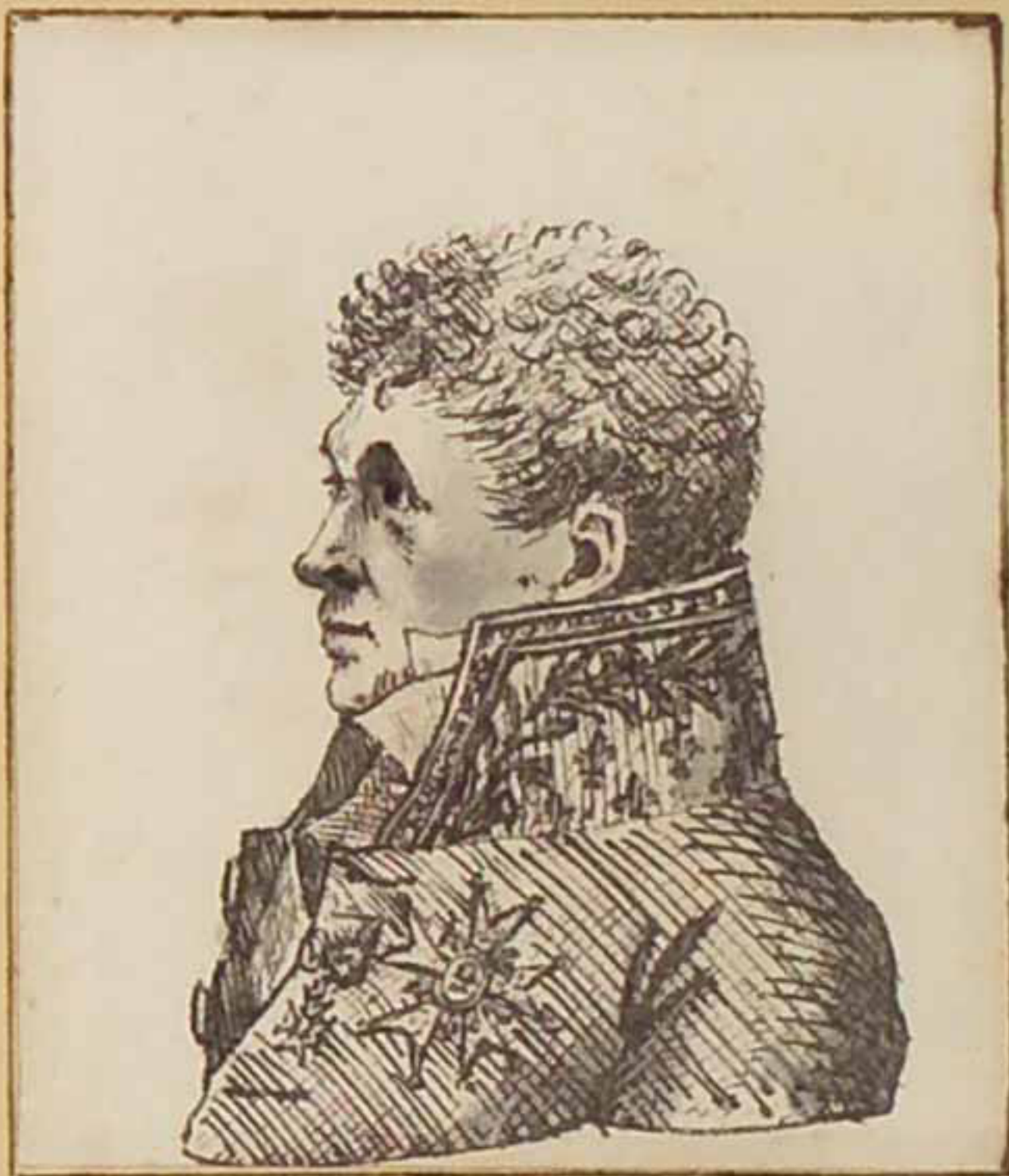
Le Maréchal Victor Amed. Bellone. Goussier 1815.