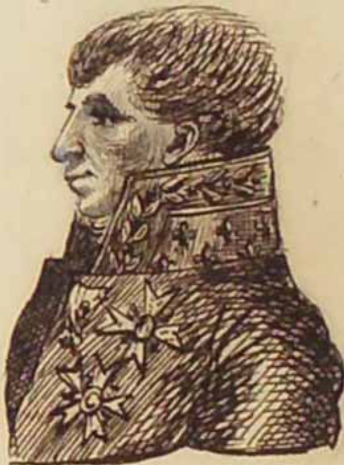
Le baron d'Albany. Aout 1815.