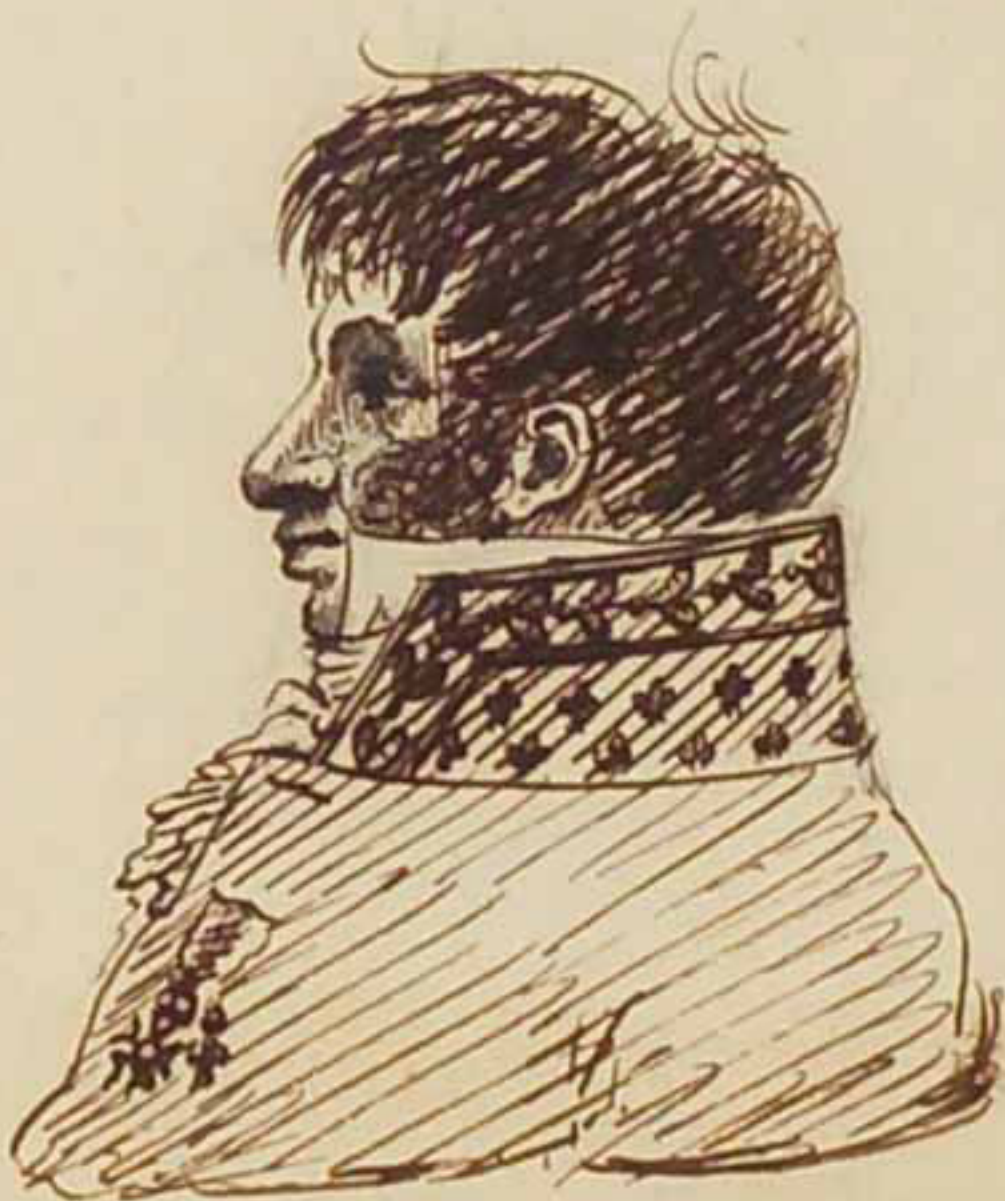
L'Empereur de Prusse. Mars 1819