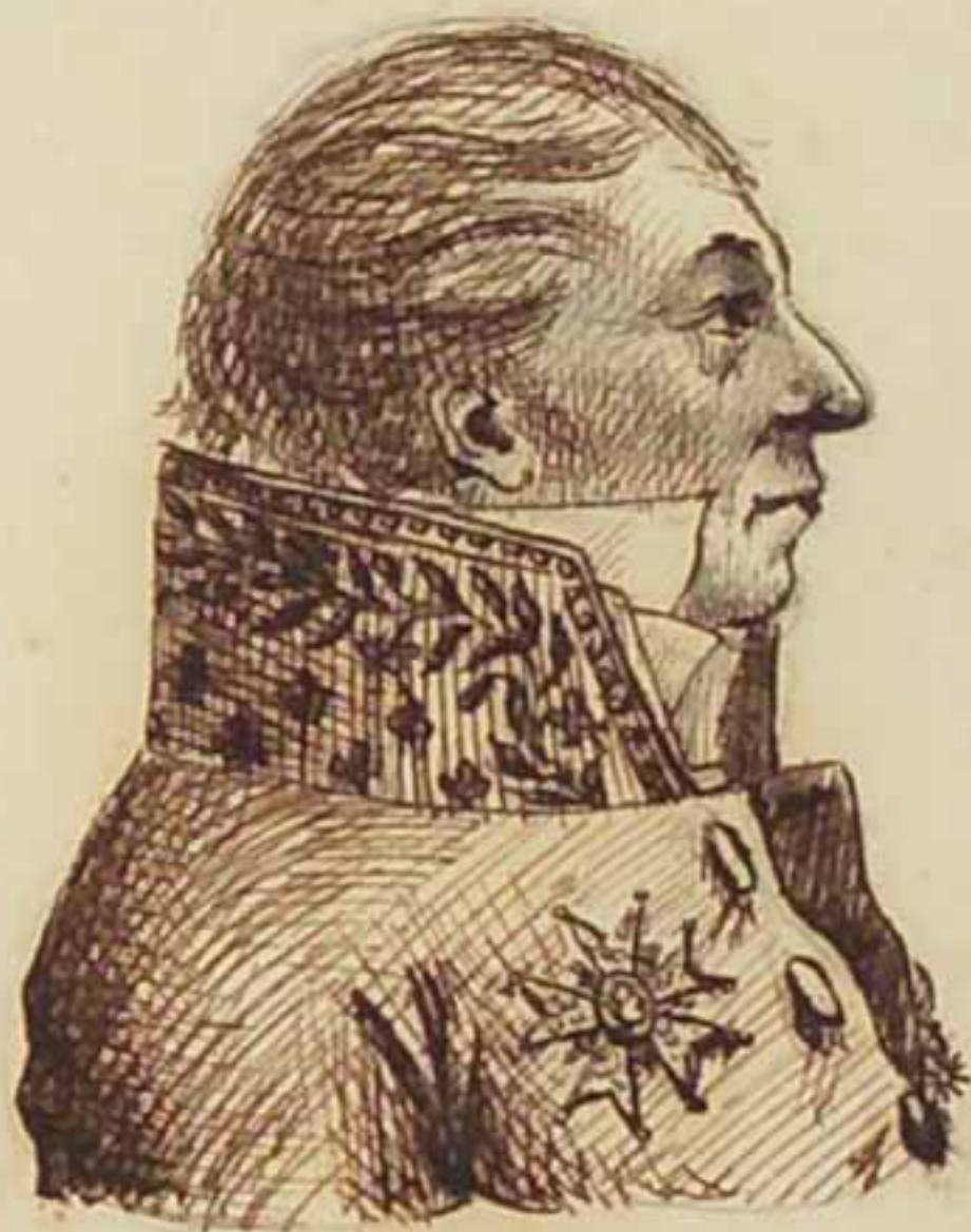
Le General Comte Bunker. Mars 1819.