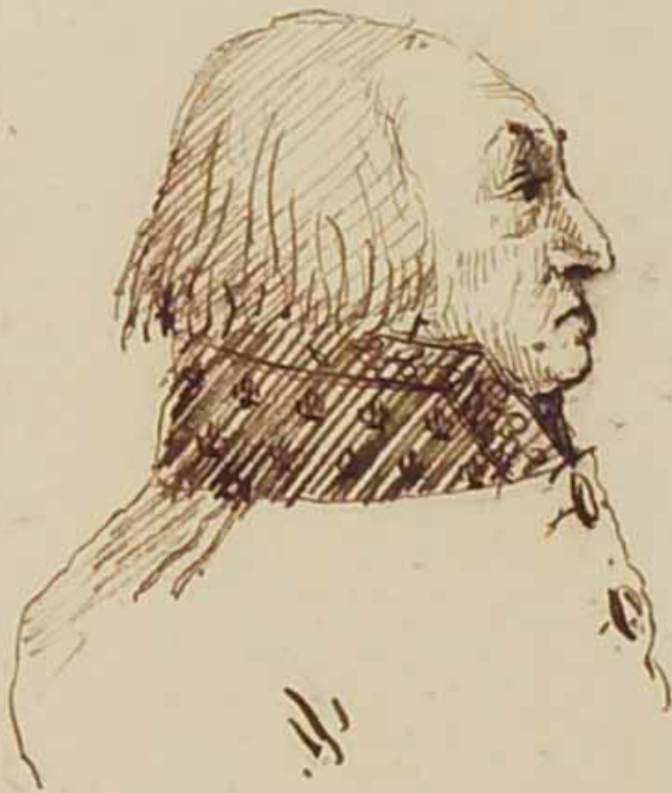
Le Marquis d'Equilly Aout 1815.