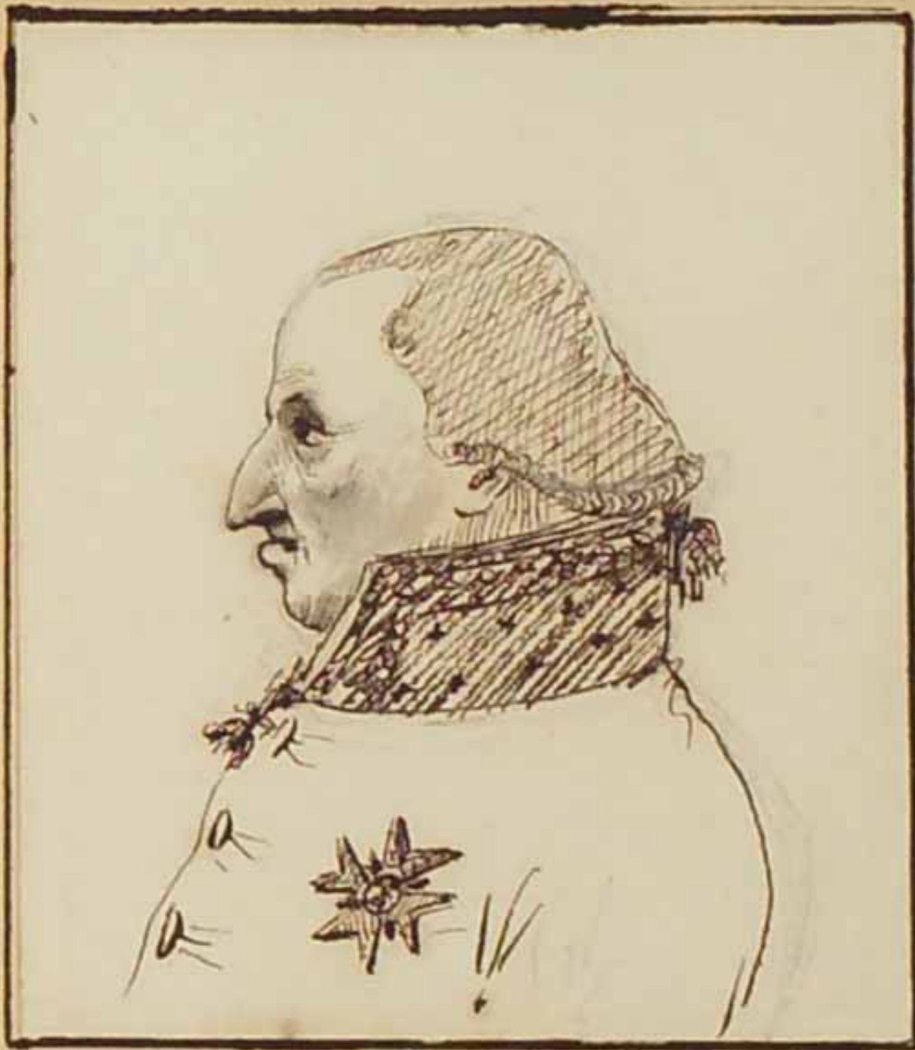
Le Duc d'Angoulême juin 1814.