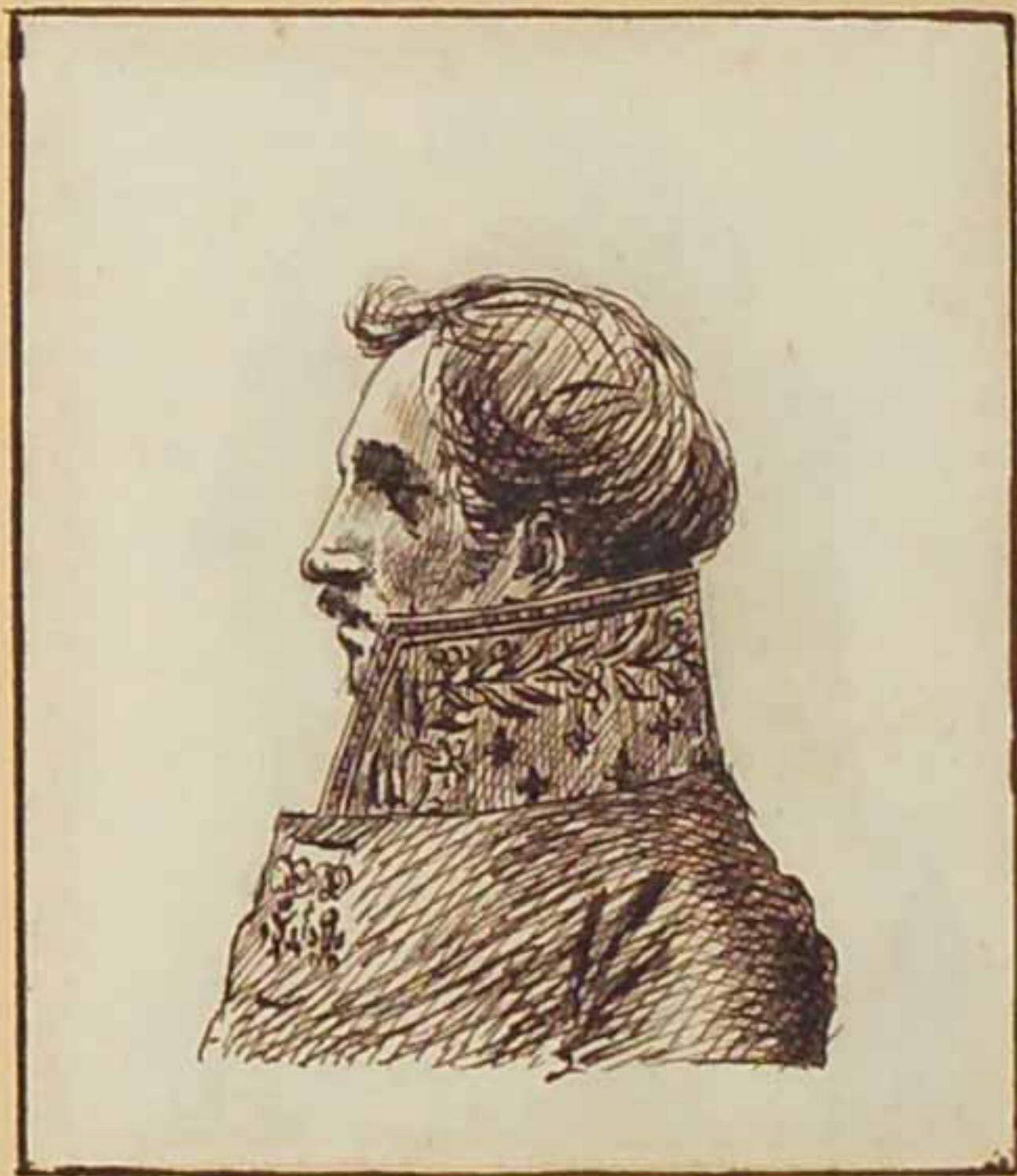
Le Marquis de Venue Aout 1815.