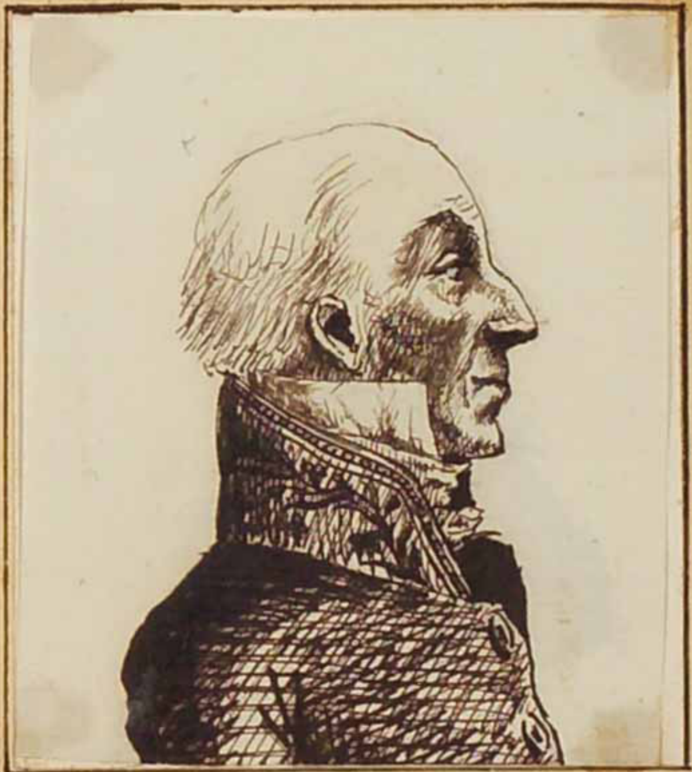
Le comte de S. Aulaire 1819