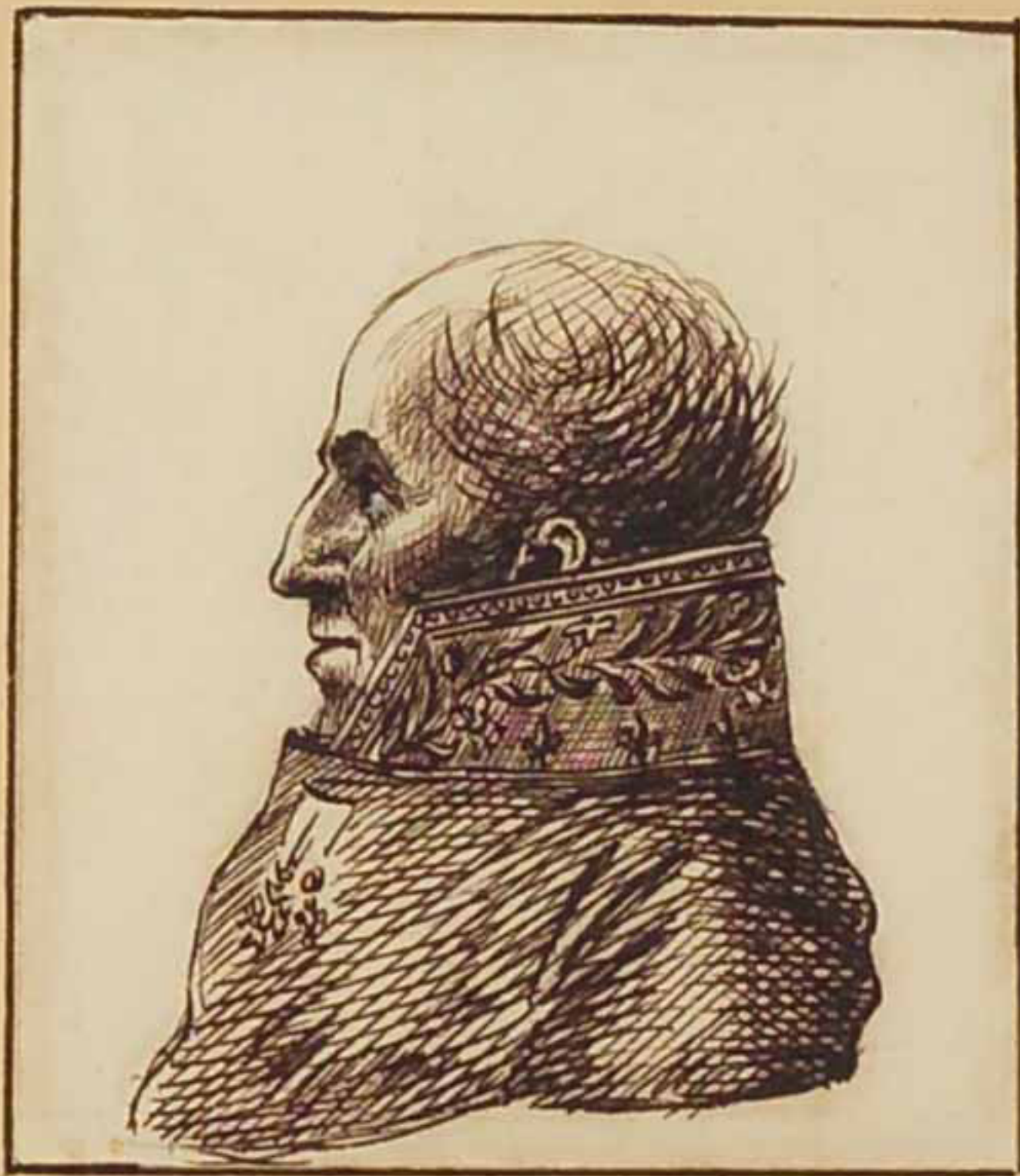
Leben de Labran. April 1815