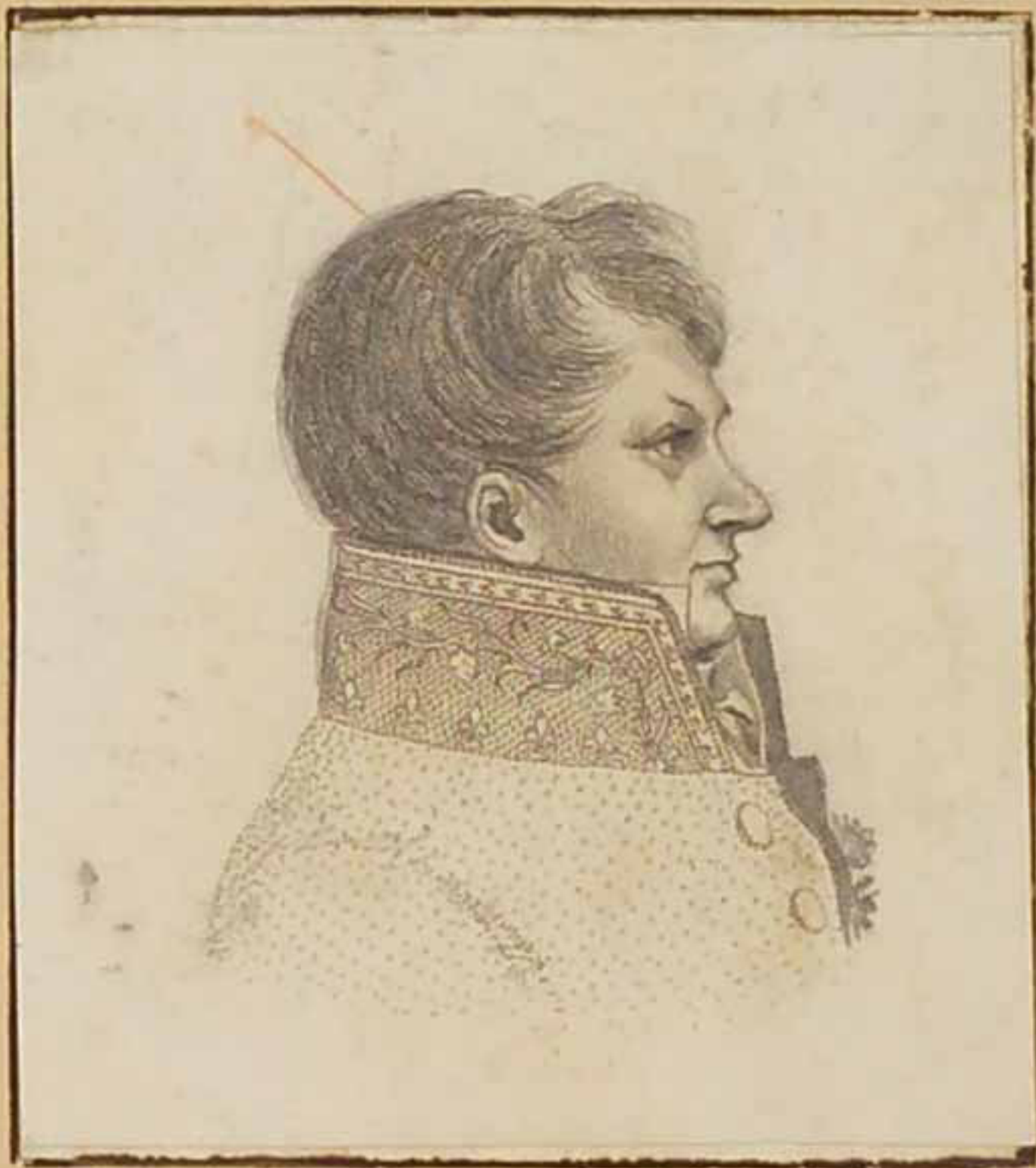
Leferente d'Armandot. Mars 1819.