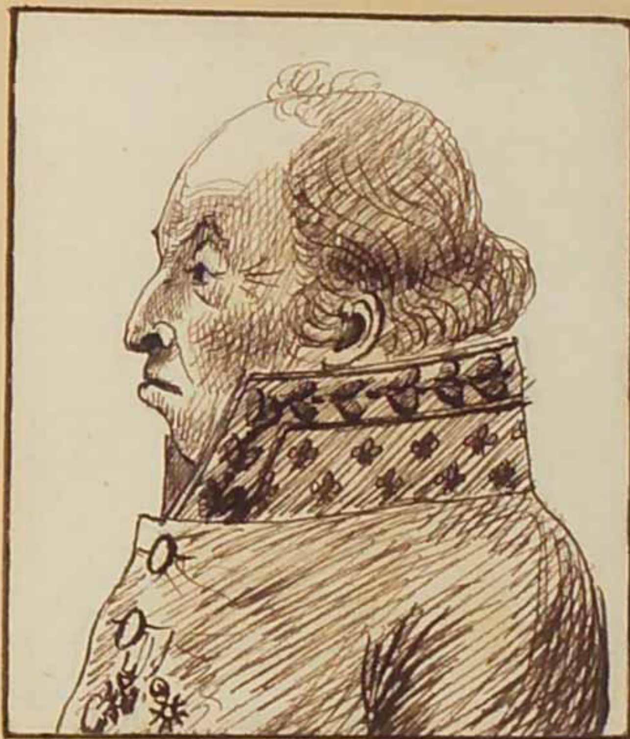
Le front de Gaspardy mars 1819.