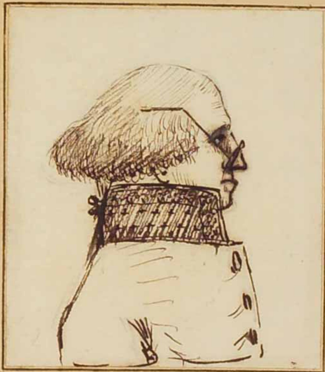
Le Secrétaire Archiviste de La Chambre des Pairs de Paris Cauchy.