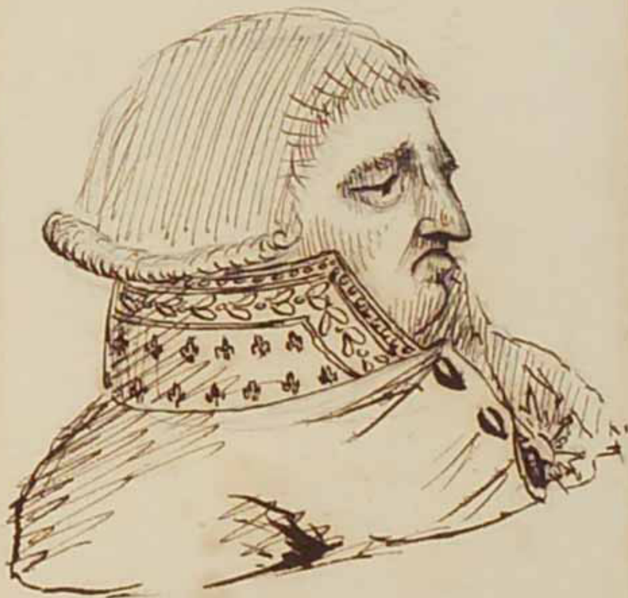
Le Maréchal J. L. Soult Juin 1814. Paris Étendue.