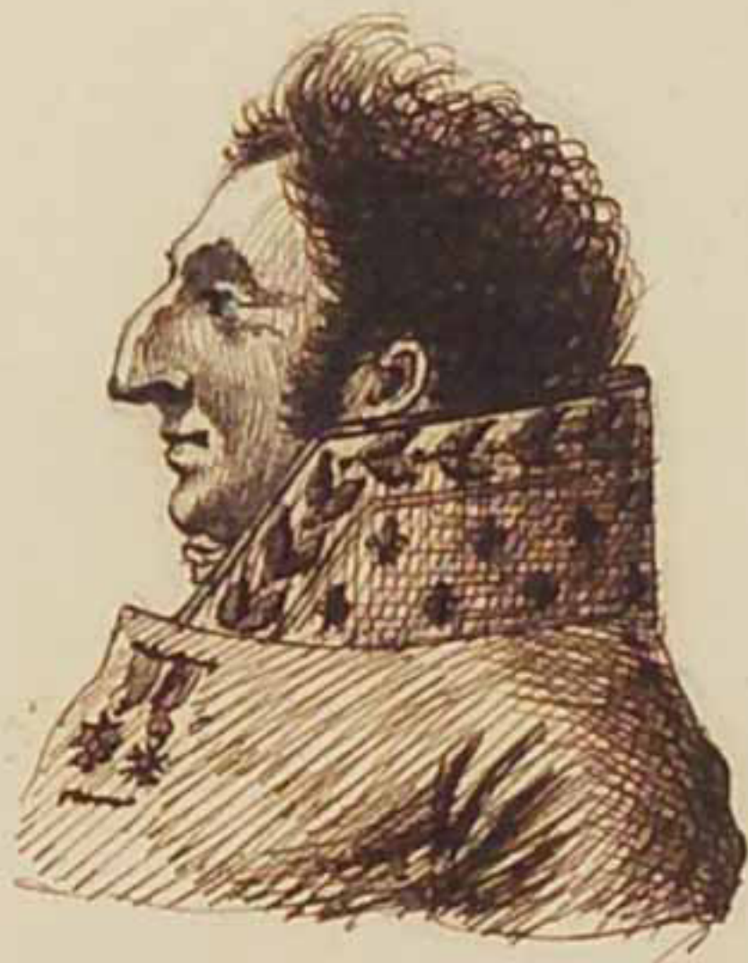
Le front de Talhoiet. Mars 1819.