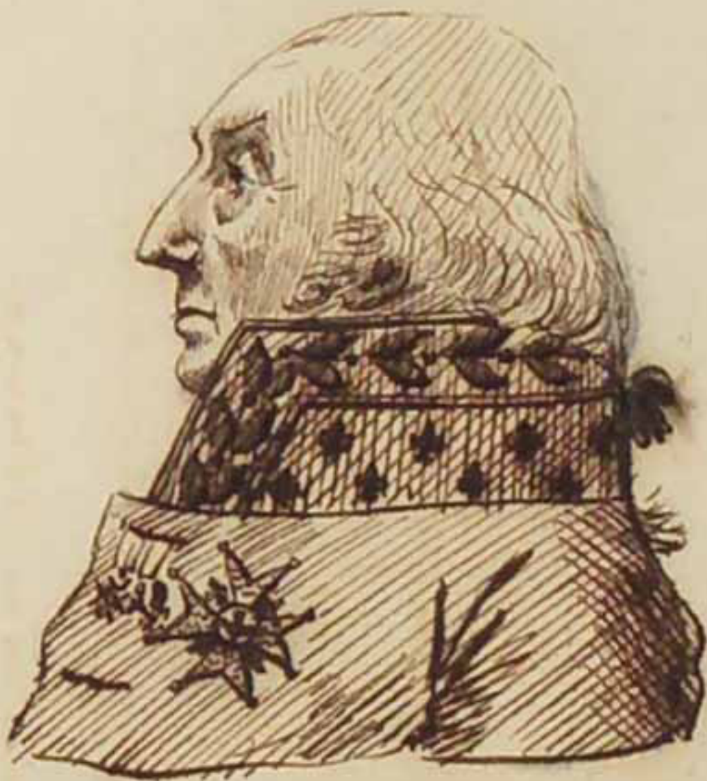
Le Duc, Maréchal de Coigny. Juin 1814.