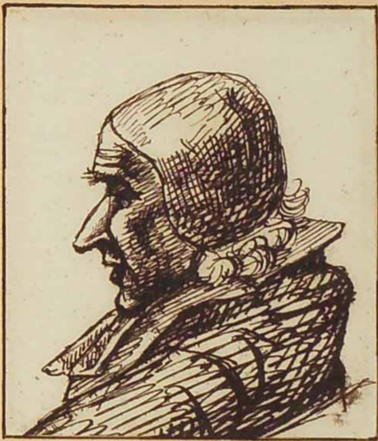
Le cardinal de La Luzerne - Aout 1815.