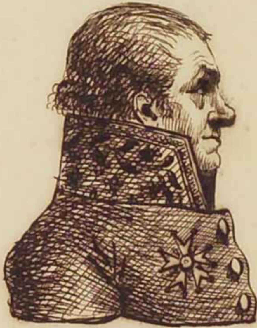
Le Baron Portal. Dec 1821.