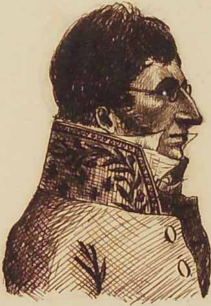
Le Duc de Massa. Juillet 1816.