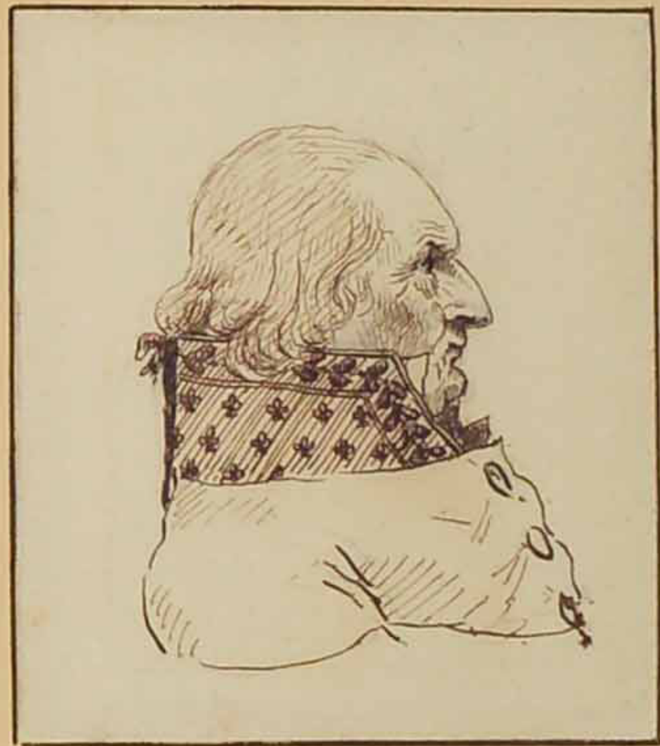
Le comte Marchant d'Armauville. Aout 1815.