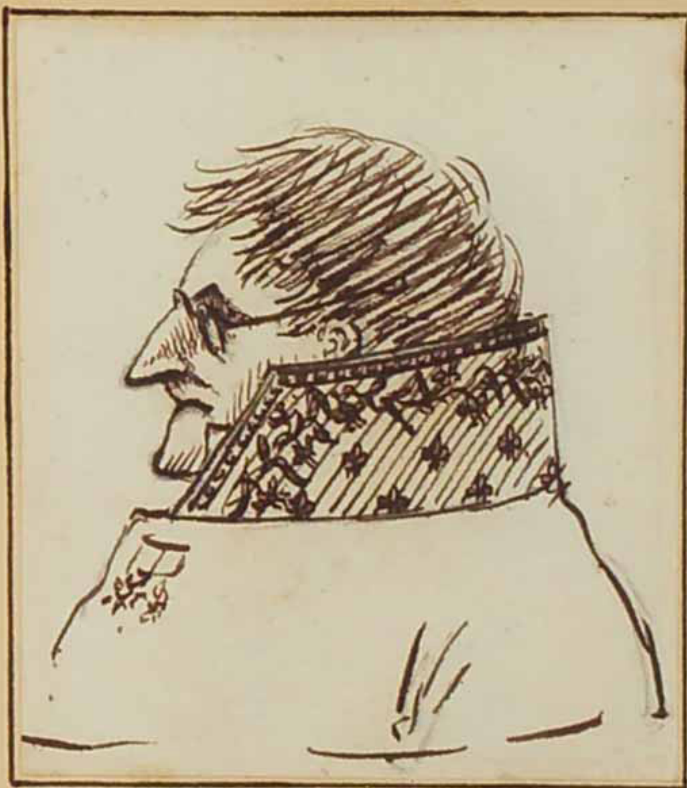
Le Duc d'Esclignac. Mars 1819.