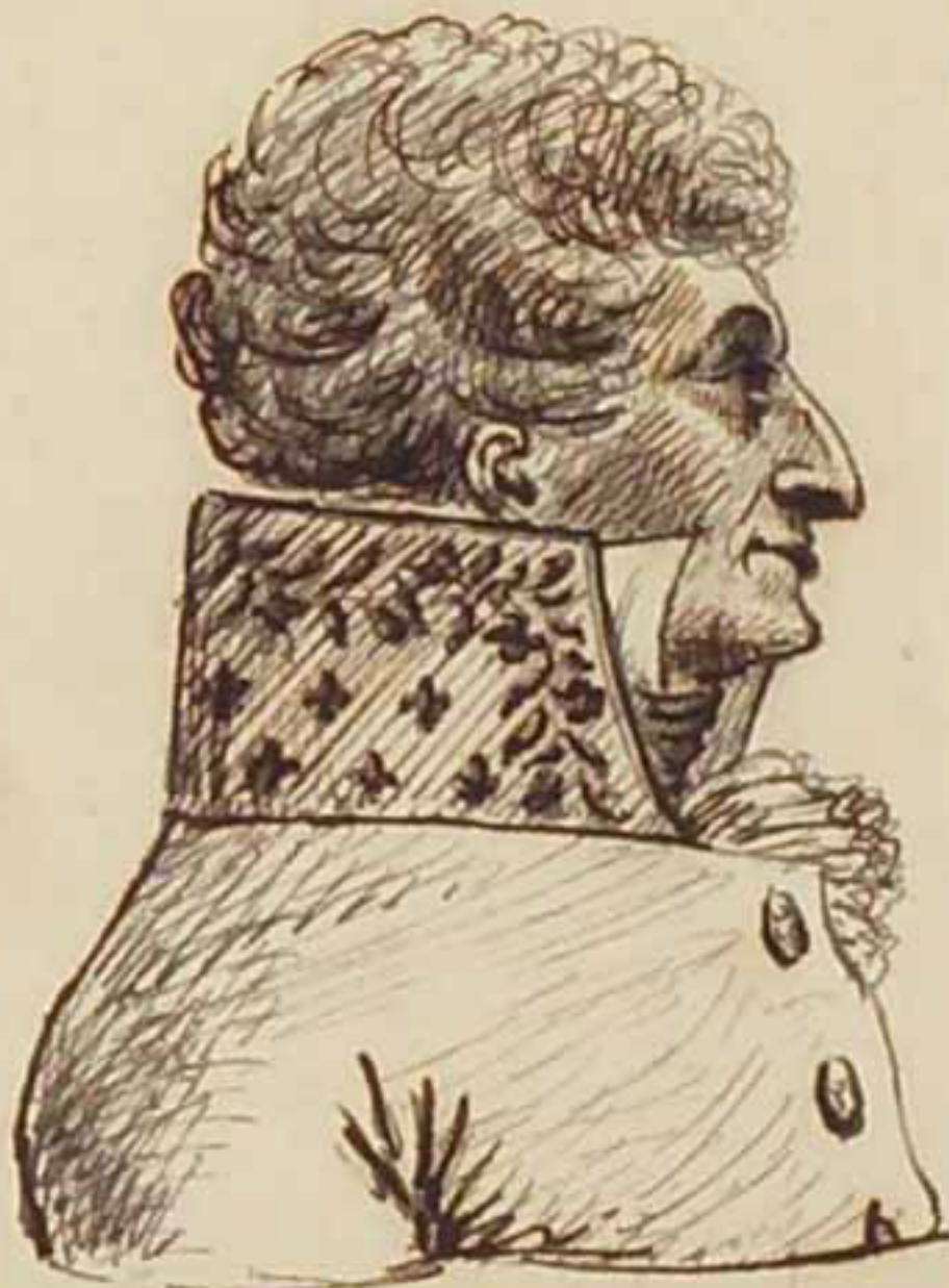
Le Duc de Richelieu Juin 1814.