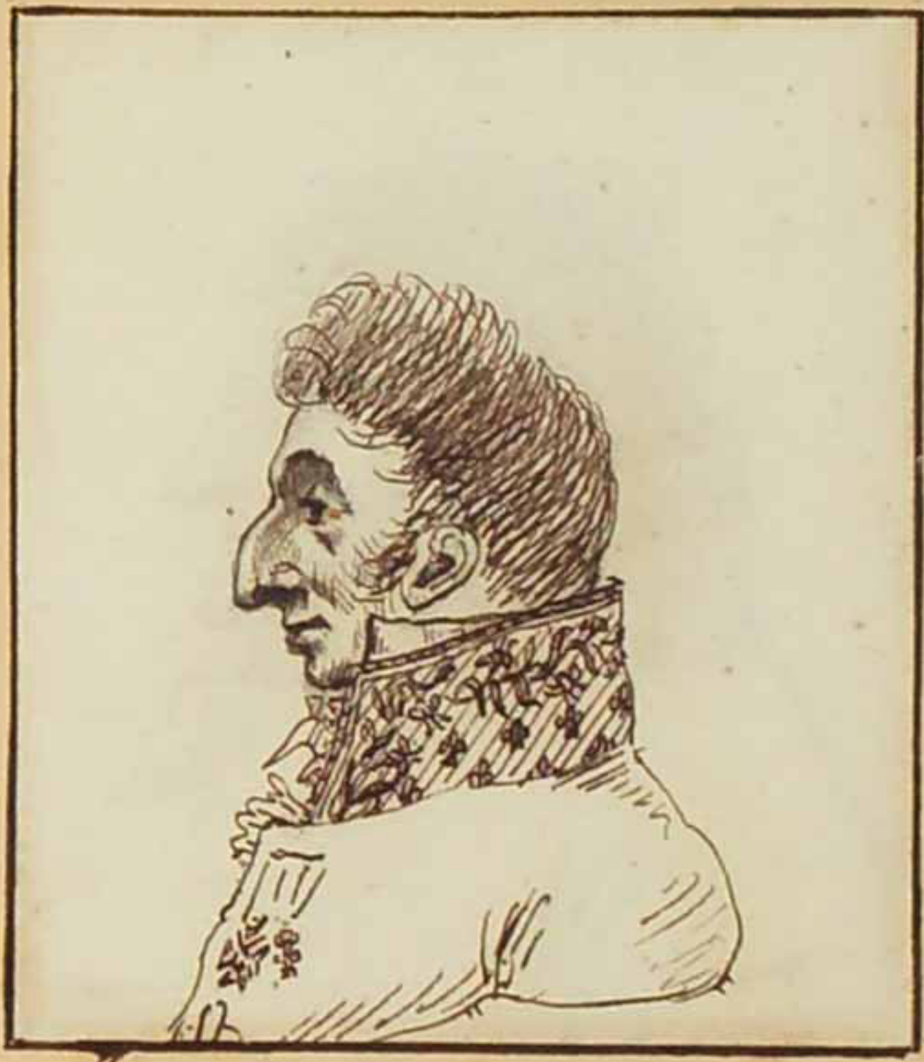
Le Duc de Luxembourg juin 1814