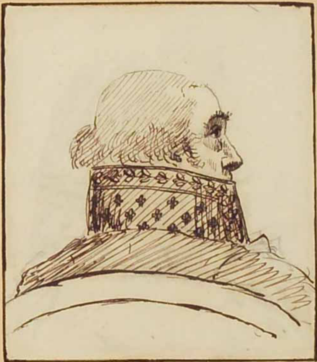
Le Marquis d'Harcourt. Avant 1815.