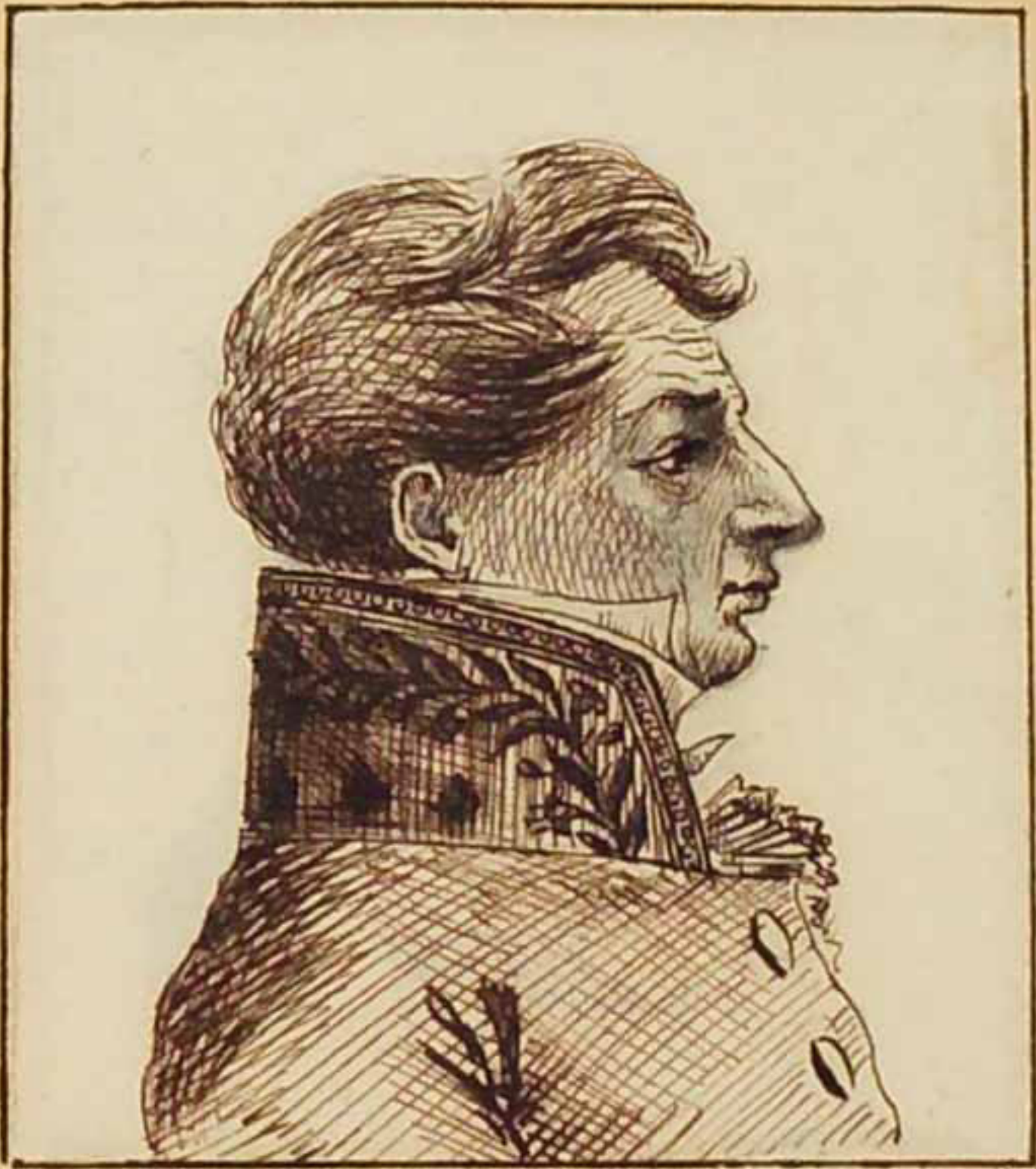
Le comte d'Hesselstein Mars 1819.