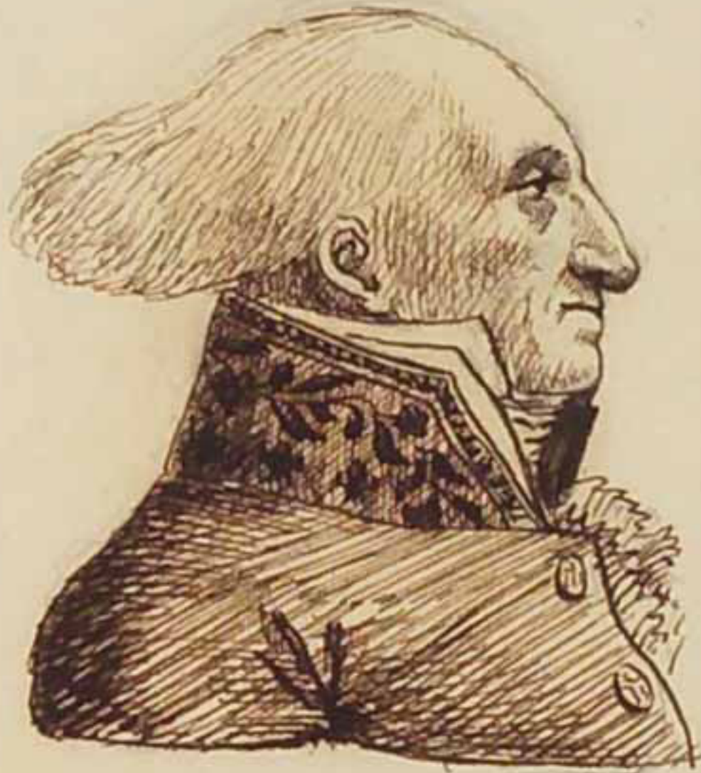
General Simon Mass 1819.