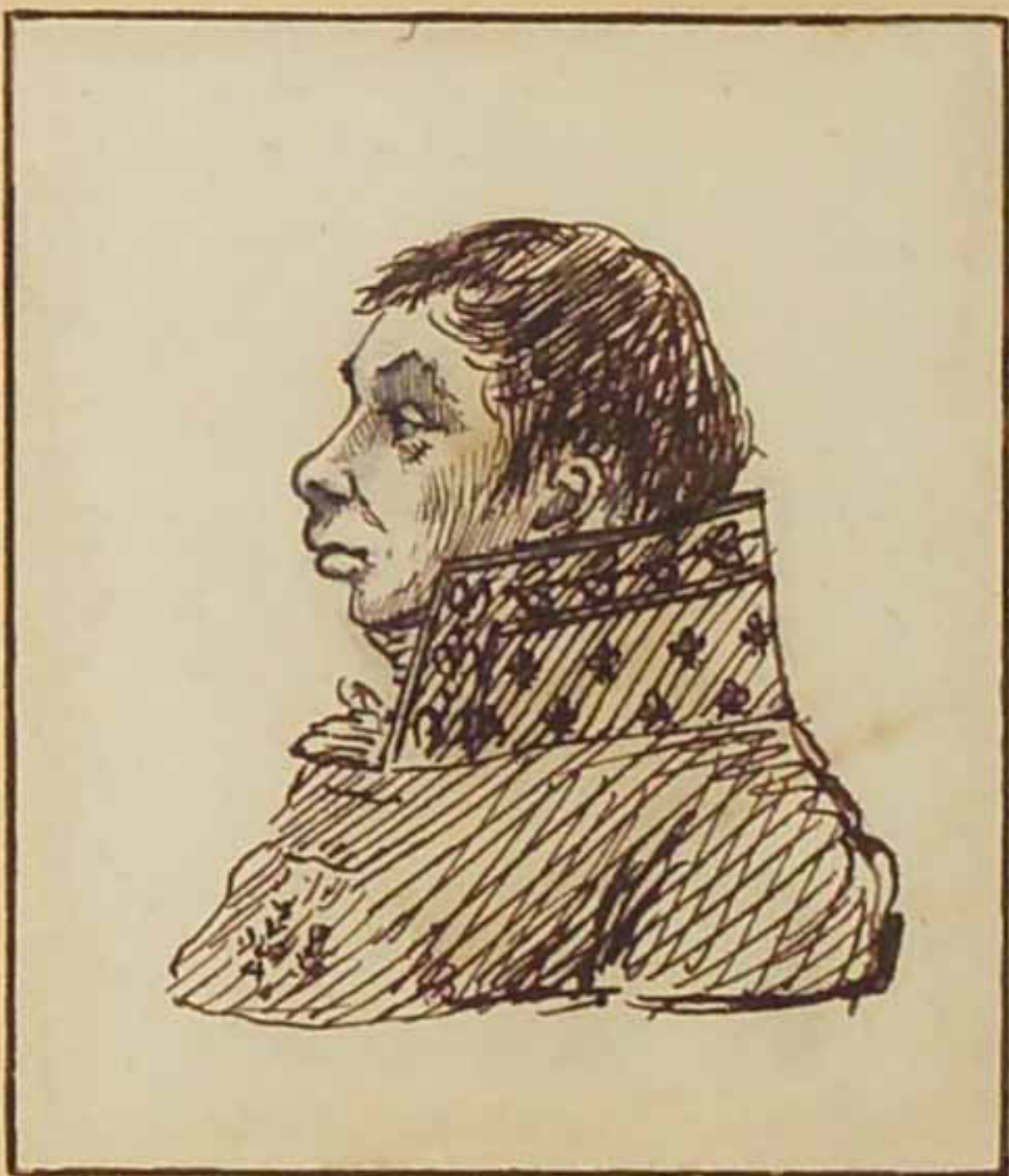
Le Marquis de Jaucourt. Juin 1814.