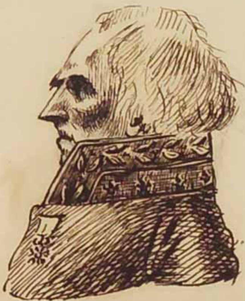
Le Marquis de la Placé. Juin 1814.