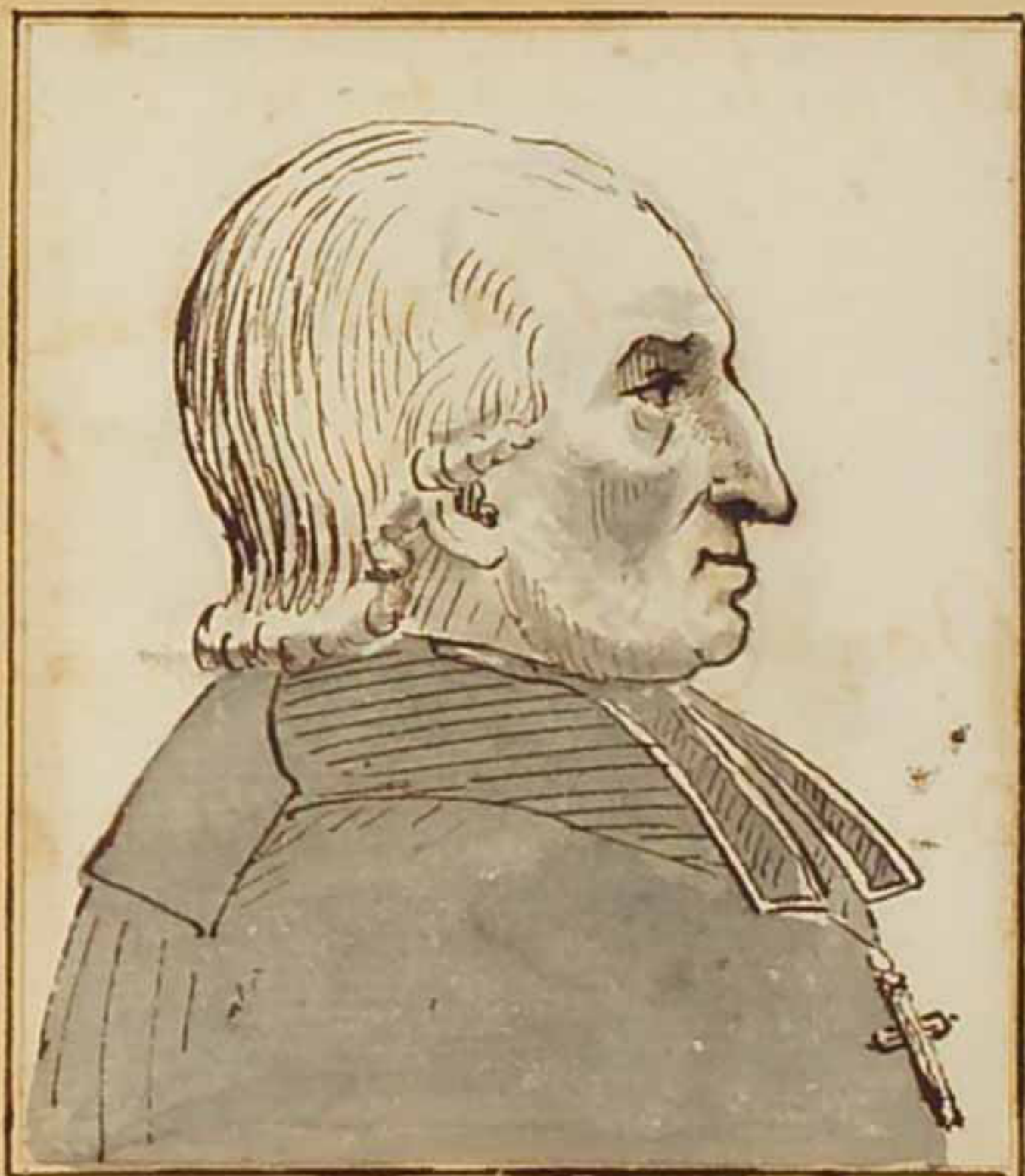
L'archevêque de Besançon (l'ancien évêque de Neuchâtel) Avril 1810.