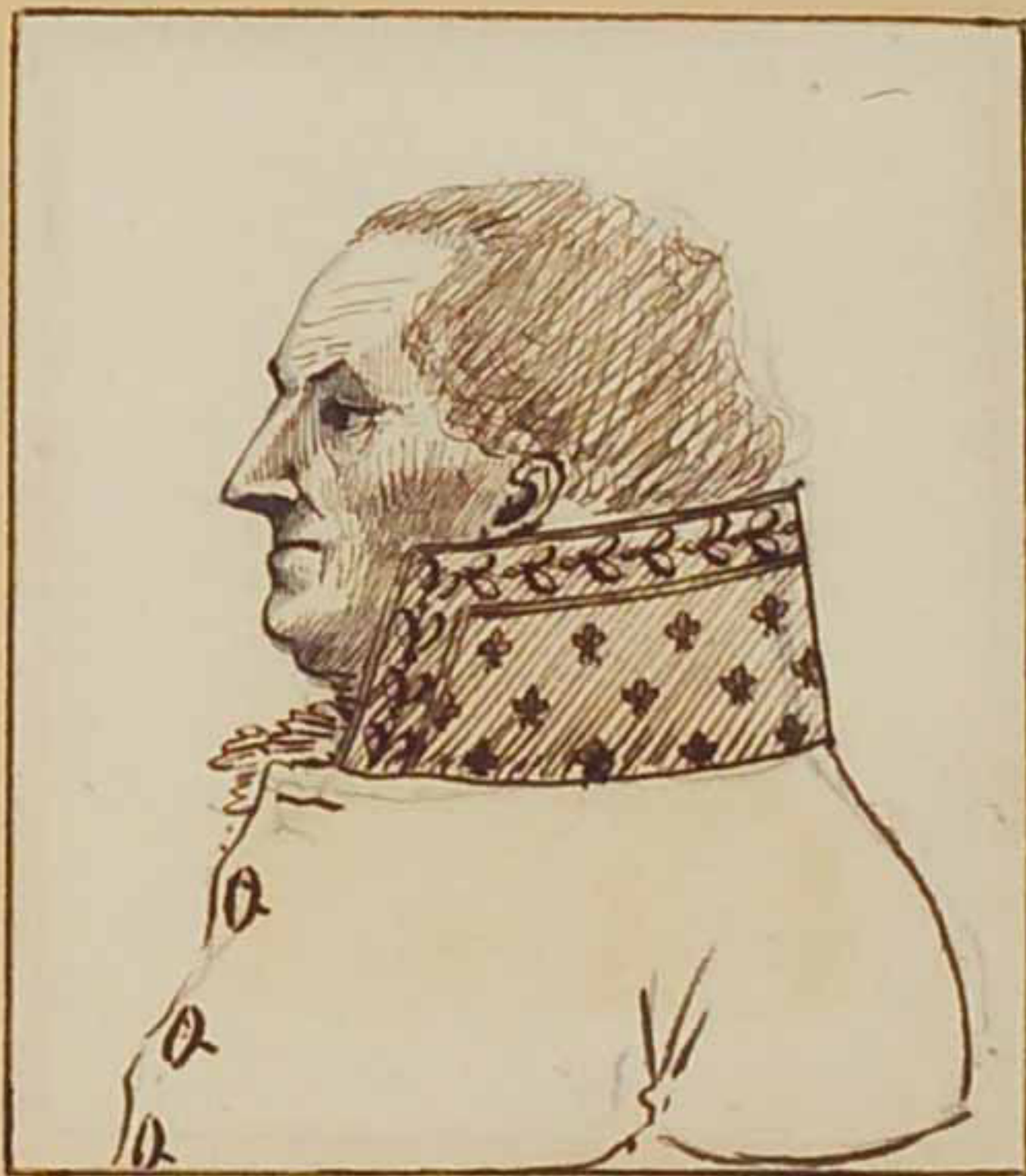
Le front de la Bonsonnaye. Aout 1815.