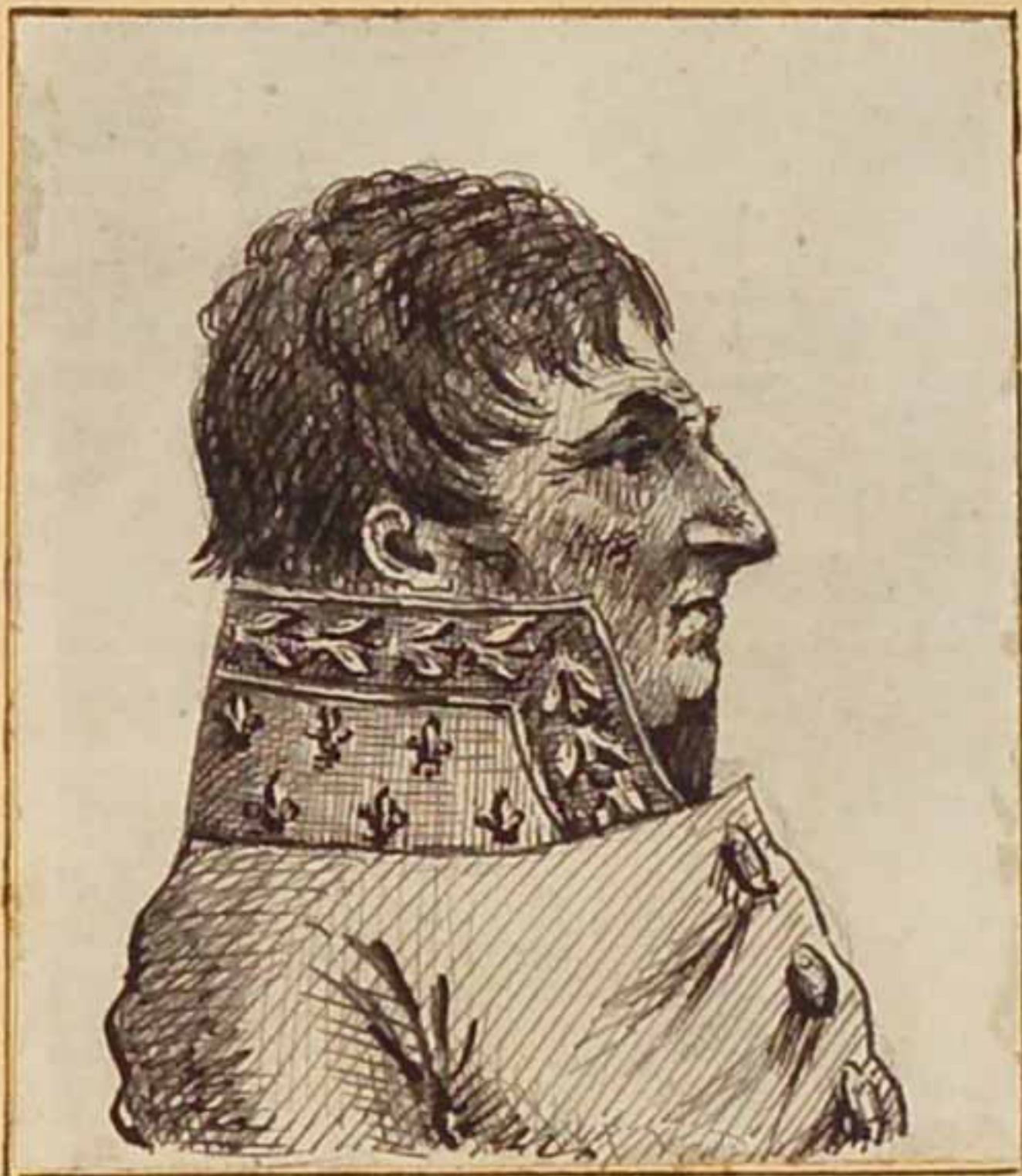
Le Marquis de Pastoret. Juin 1814.