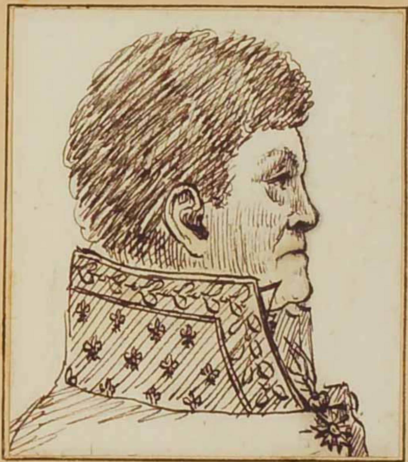
Le Comte Demont. juin 1814