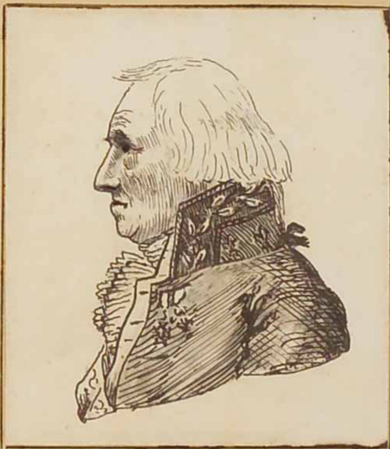
Le Duc de Serant juin 1814.