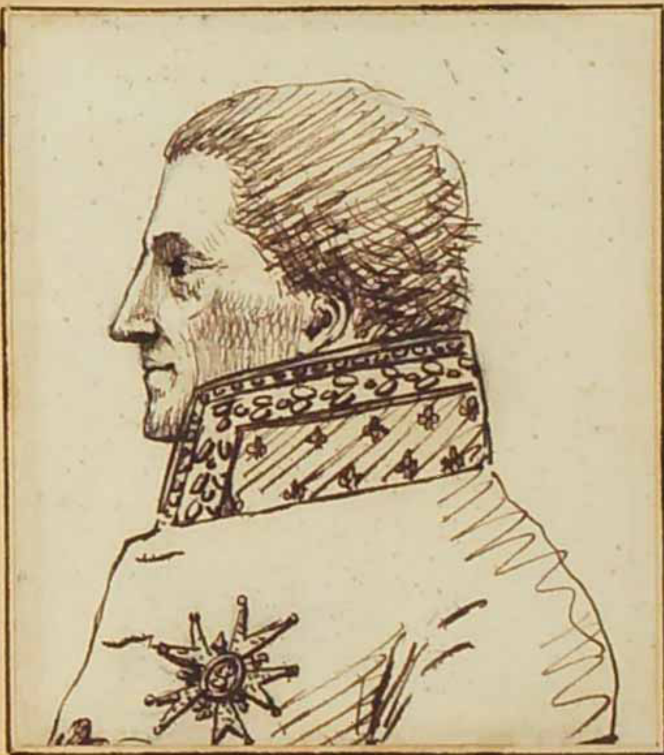
Le Marquis de Barthélemy juin 1814.