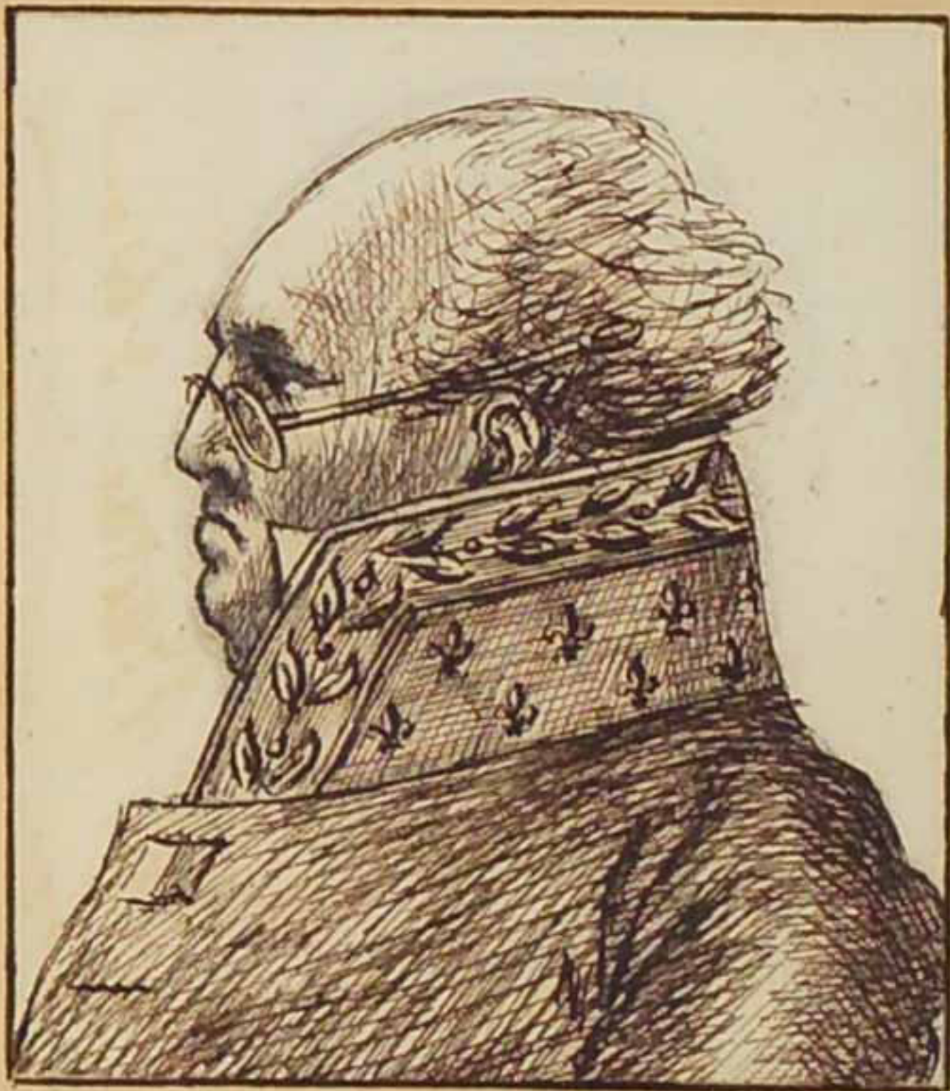
Le Marquis de Lally Tolendal Aout 1815