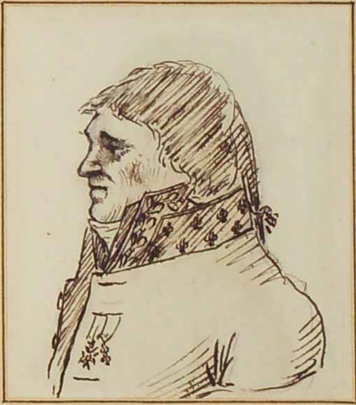
Le Marquis de Talarn Aout 1815