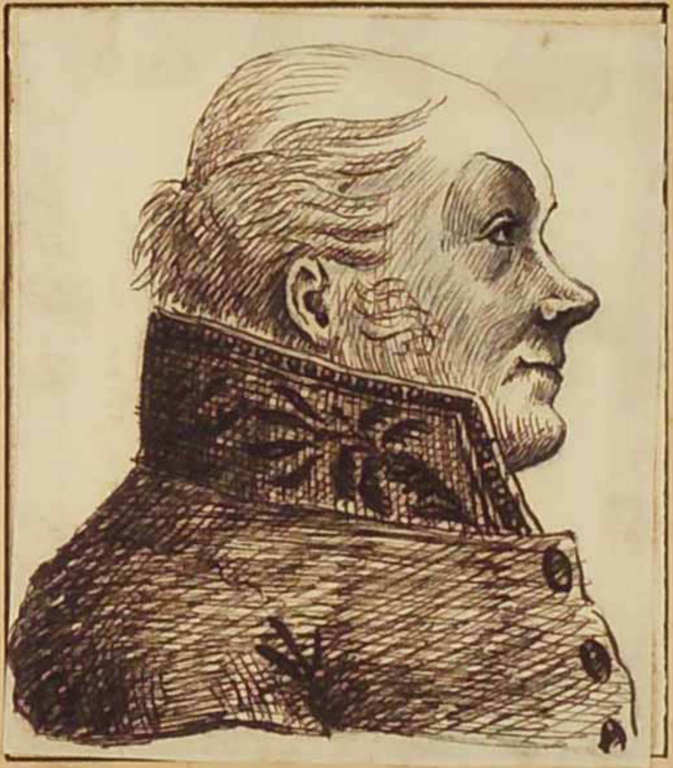
Lieutenant General Baron Haxo 1833.