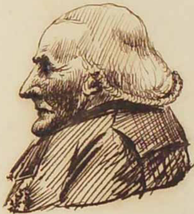
Le Comte Bombier Eugène d'Ormesson. Juin 1814.