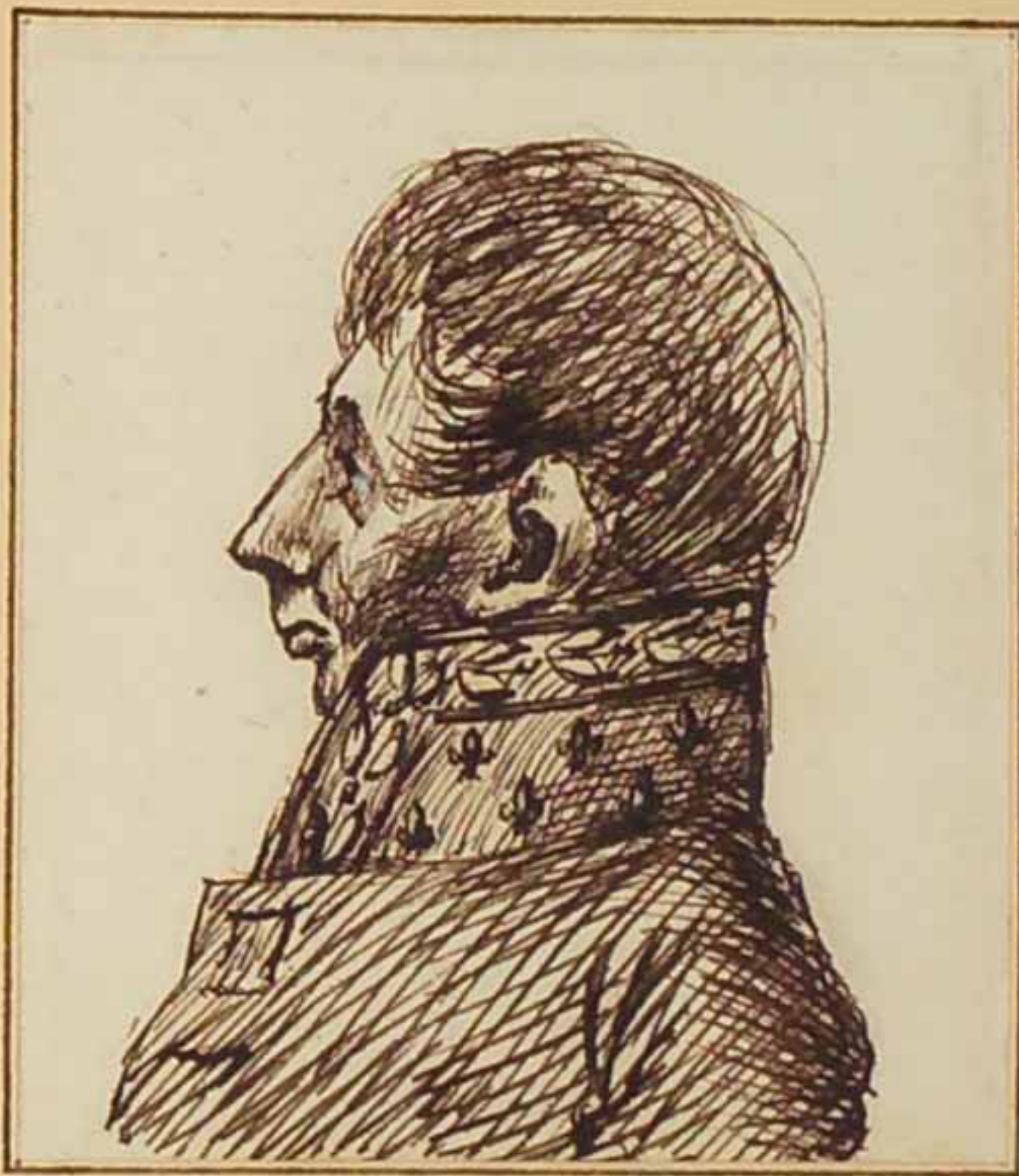
Le Comte de Fontades. Janv 1815.