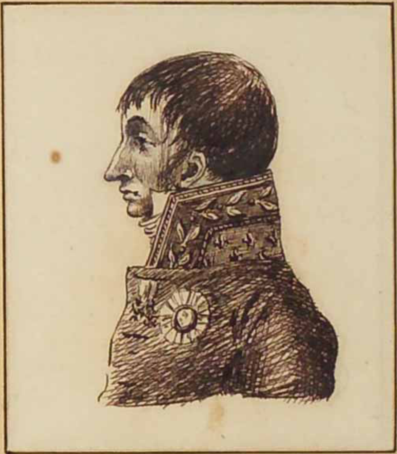
Le Duc de Narbonne Pillet. Aout 1815.