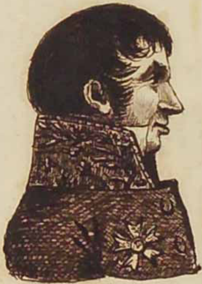
Le Comte Mounier Mars 1819