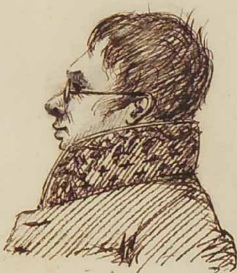
Le Comte d'Ambray Août 1815 Démissionnaire