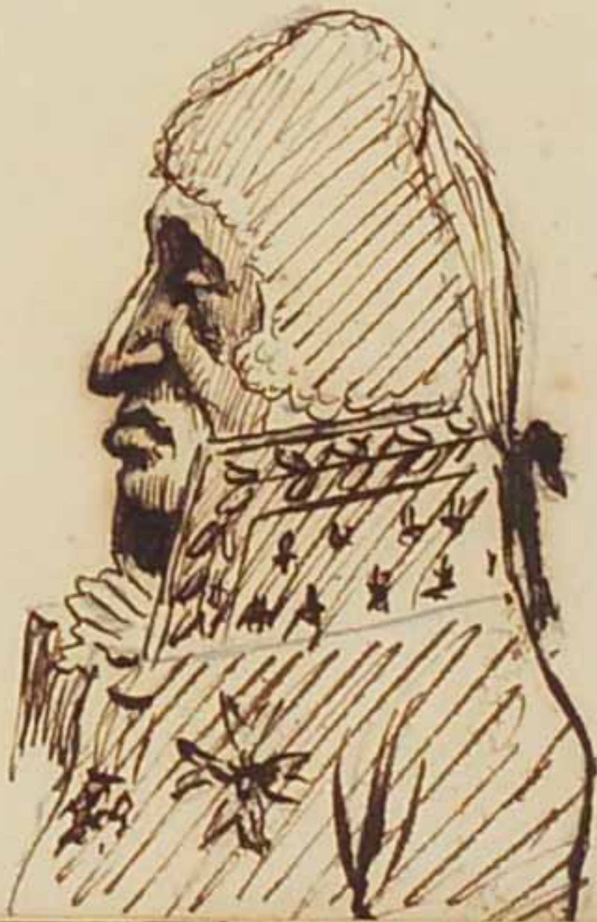
Le Duc de Lewis. juin 1814