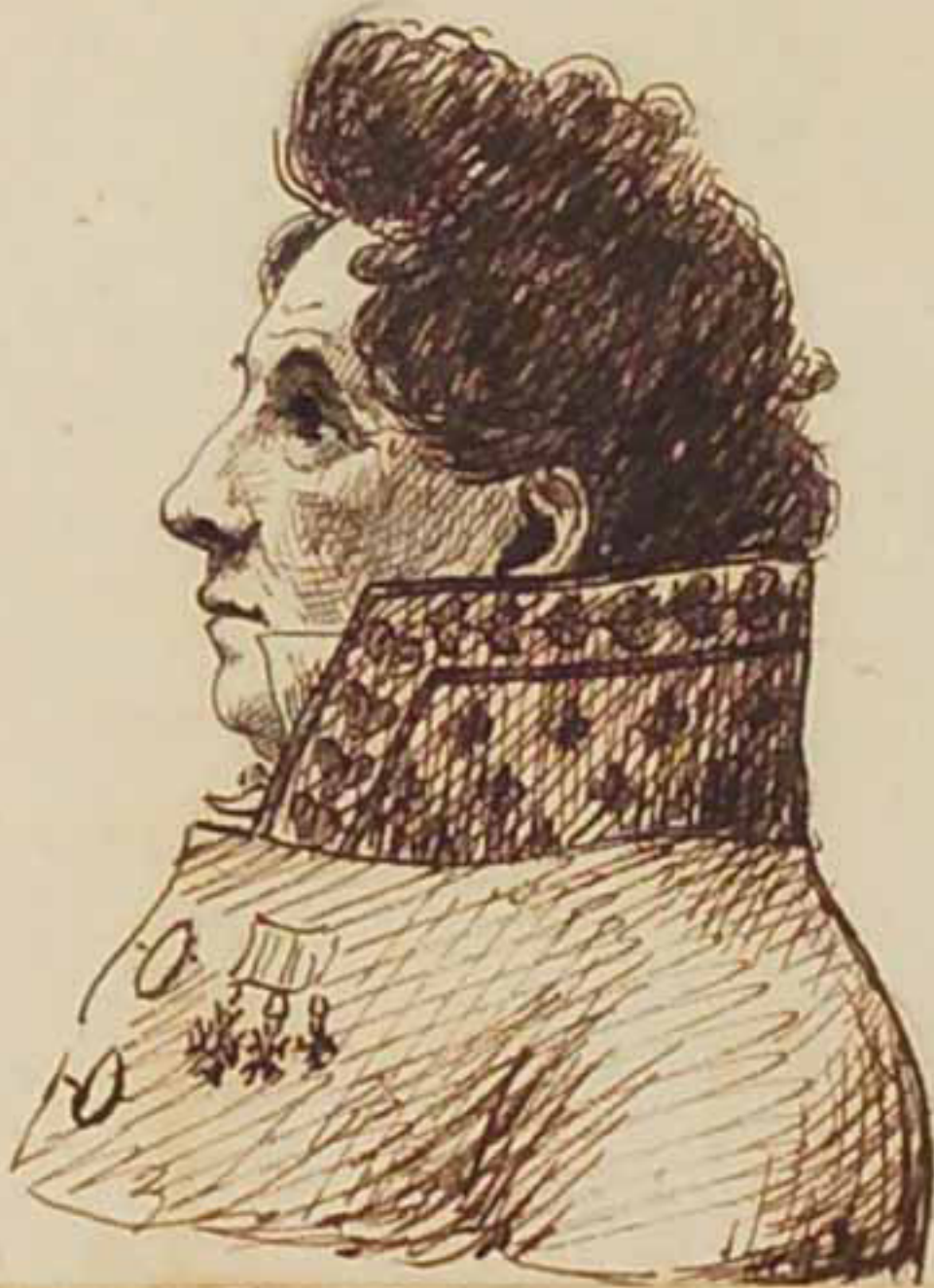
Le Duc de La Force. juin 1814.