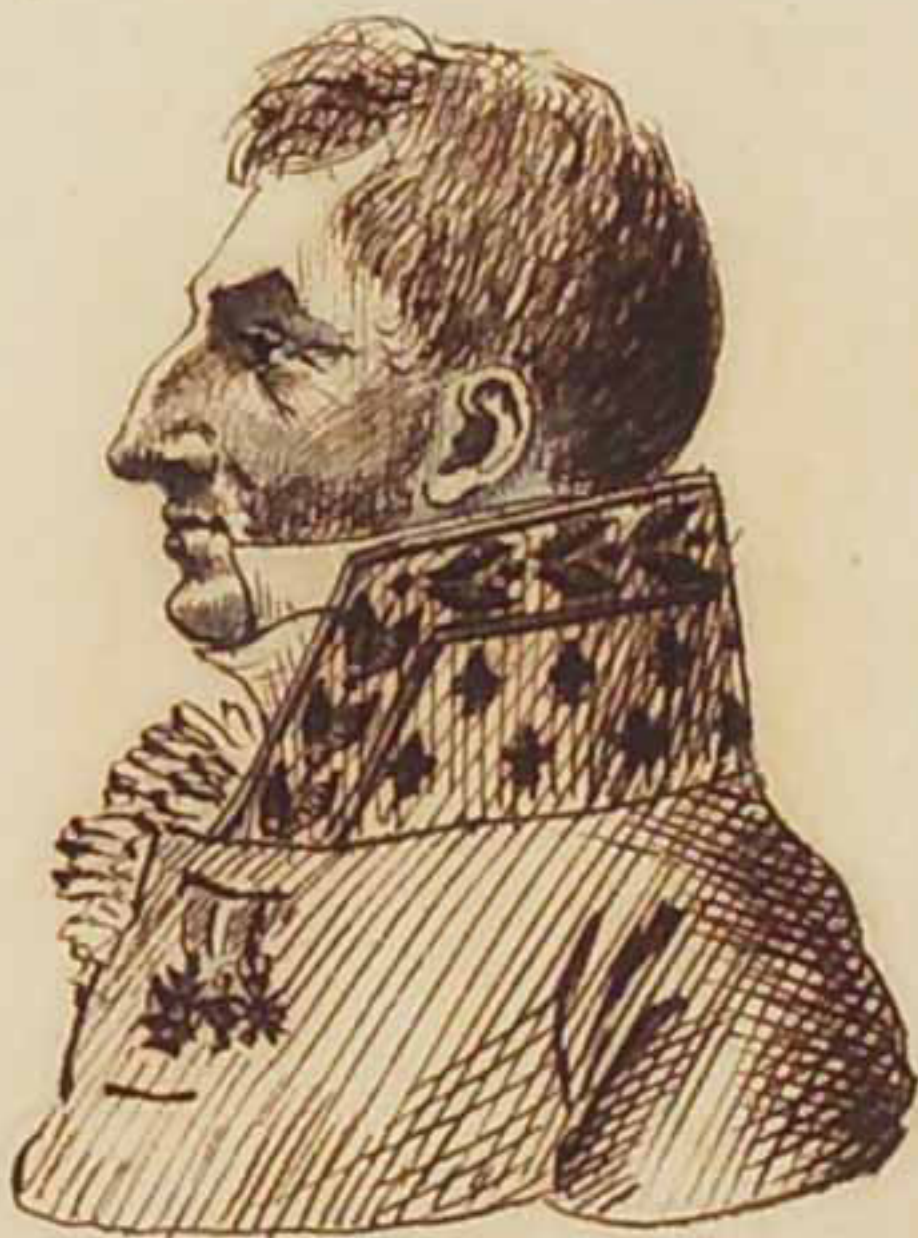
Le Prince de Polignac. Avril 1815.