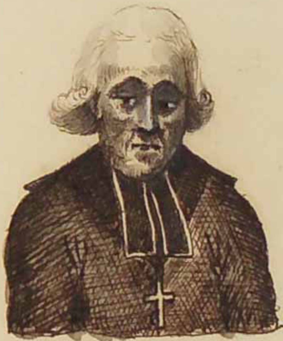
Leonetti de Brault archevêque d'Alby. 1827.