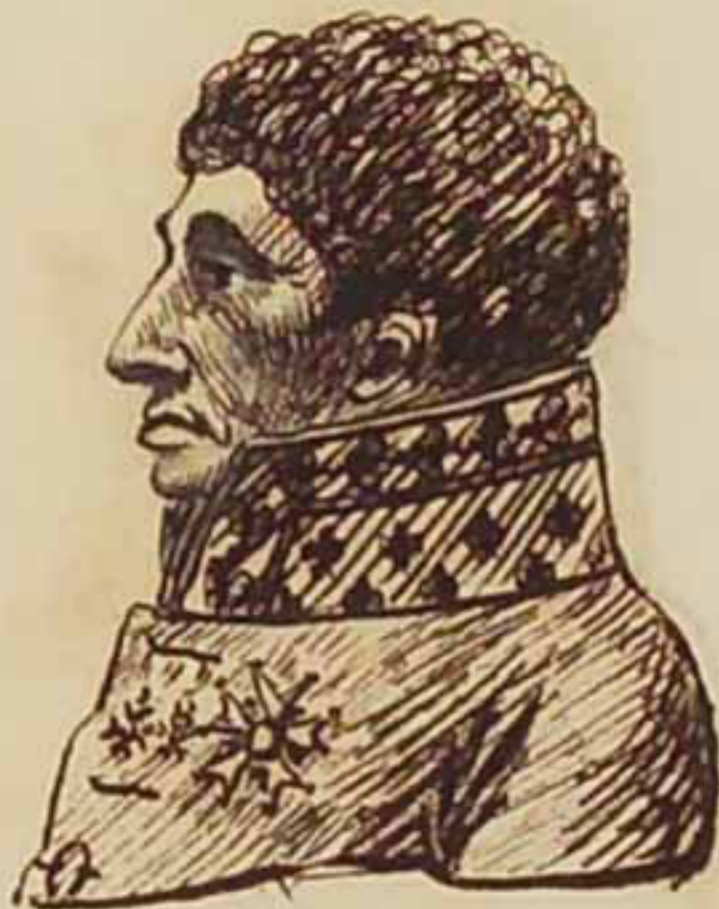
Le Maréchal Kellermann Duc de Valmy Juin 1814.