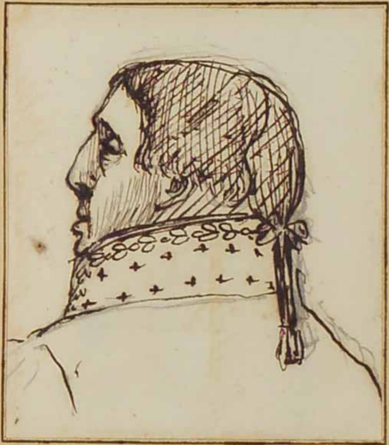
Le front de Dambarré, Juin 1814.