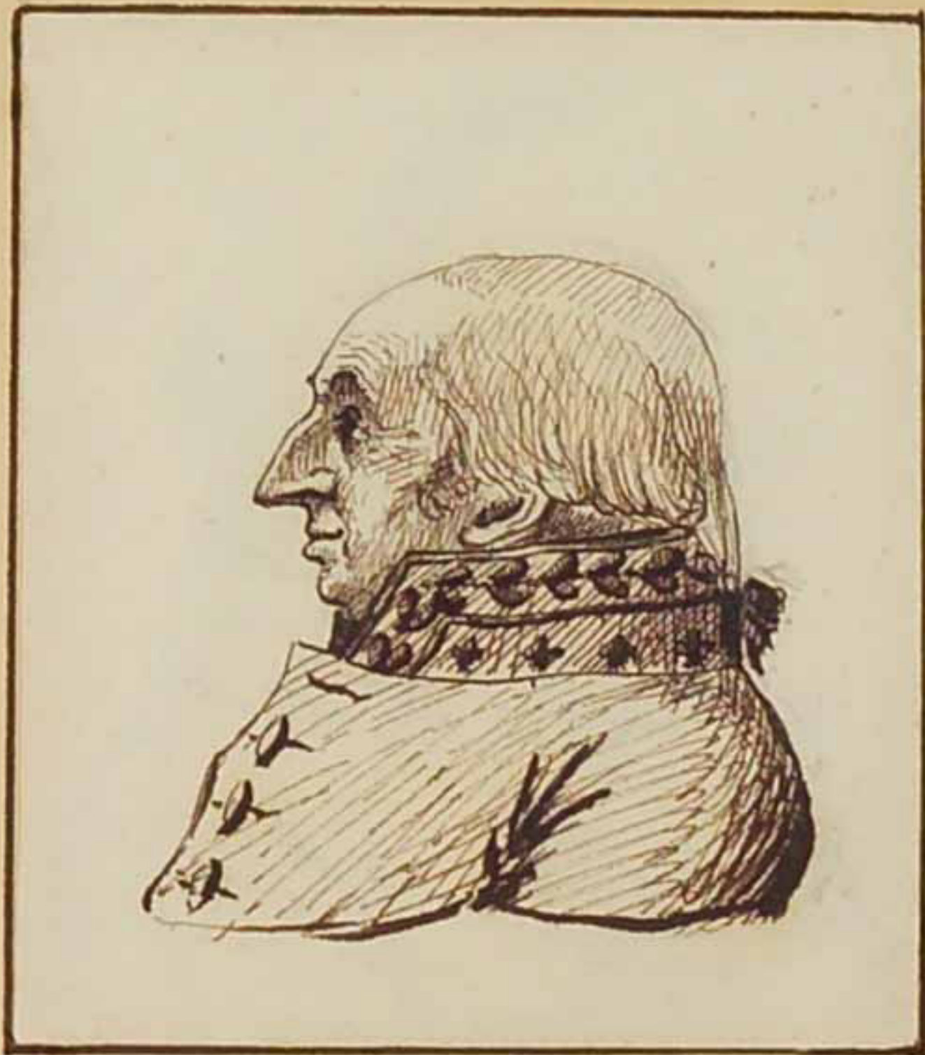
Le Marquis d'Albortas. Aout 1815.