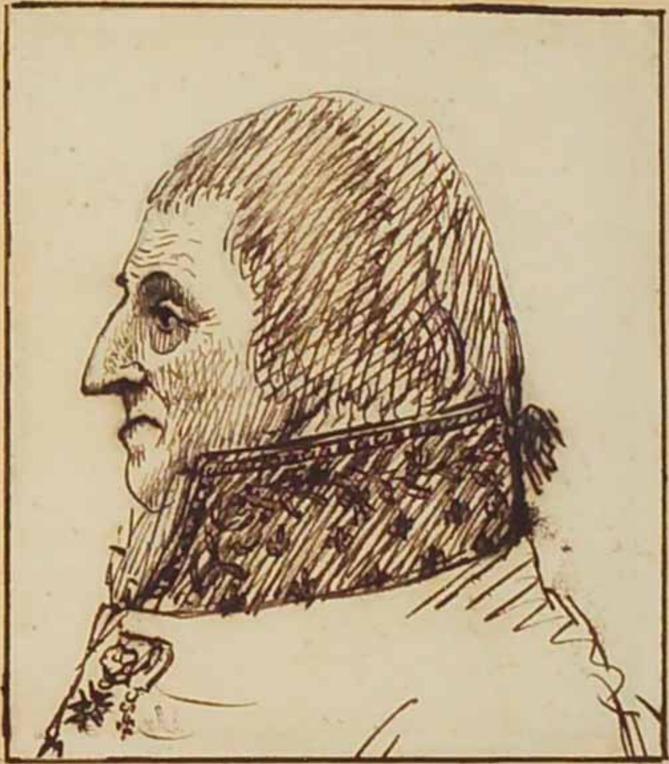
Le marquis de Lasuze. Aout 1815