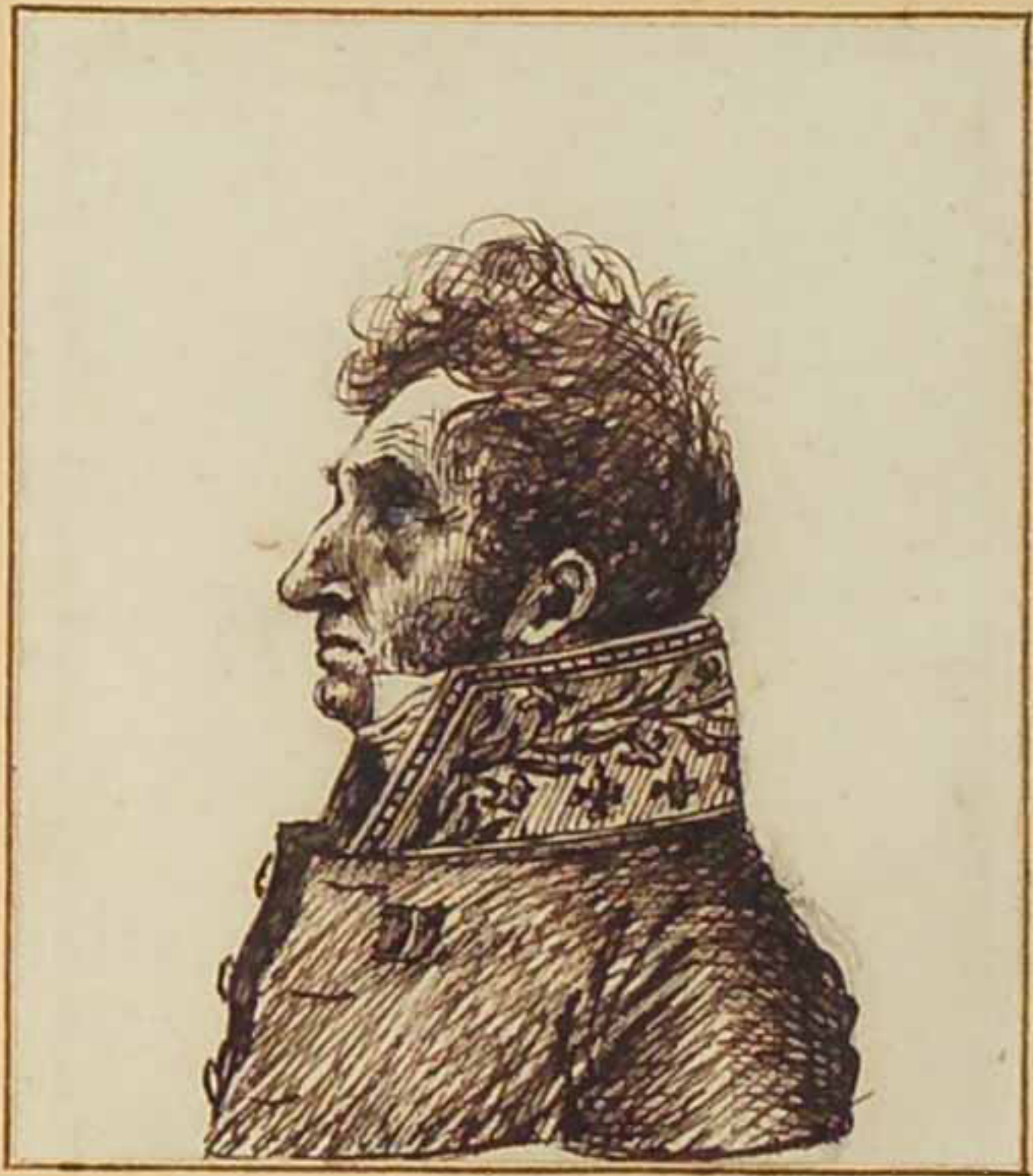
Le Marquis de Boissellon Aout 1815.