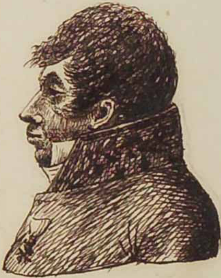
Le Comte Hoquart 1827.