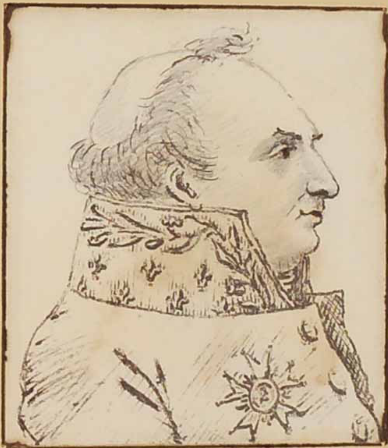
Le Comte de Montalivet Mars 1819.