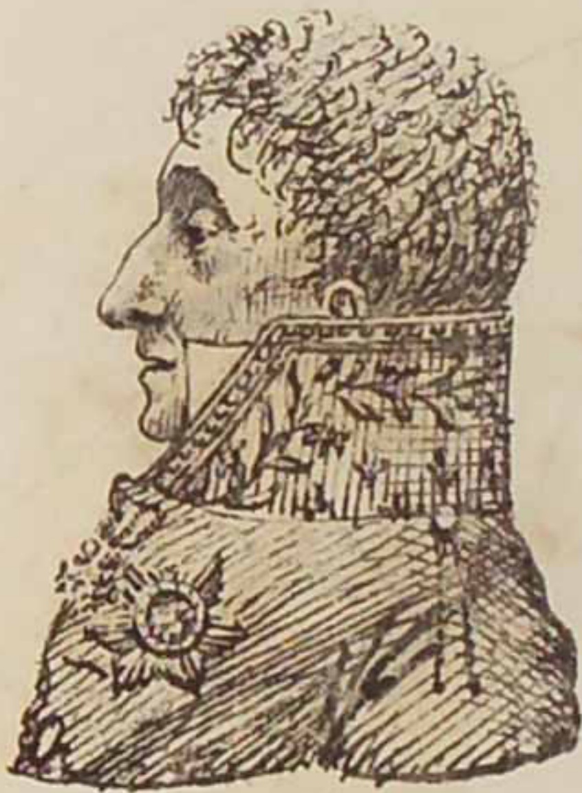
Le Marquis de Castellarne. Aout 1815.