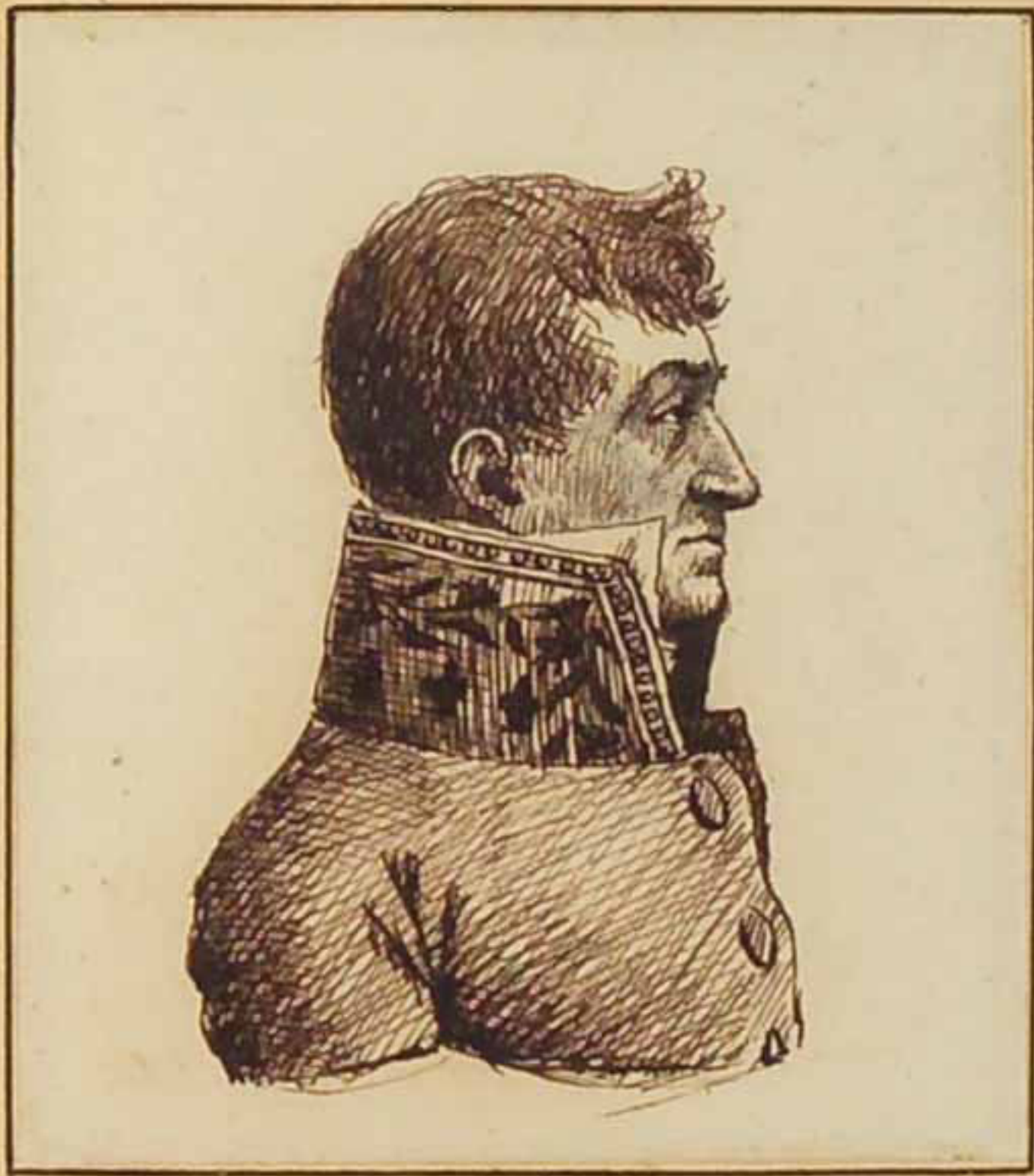
Le Baron Pasquier. Sept 1821. Chancelier de France