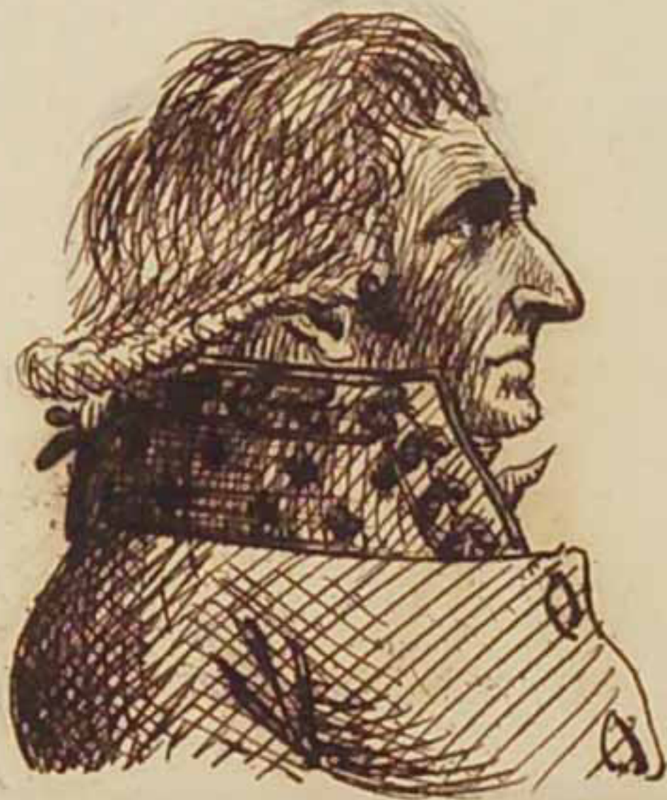
Lefont Fabre del'auca. Mars 1819.