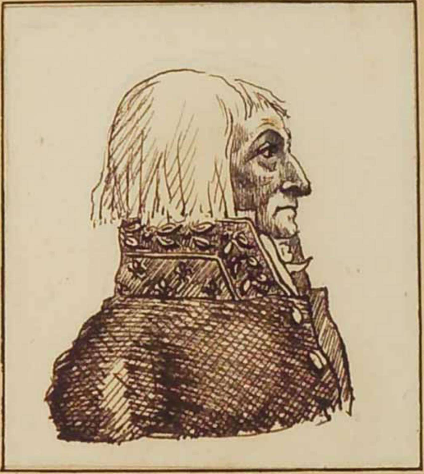
Le comte Pelet de La Lozère. Mars 1819.