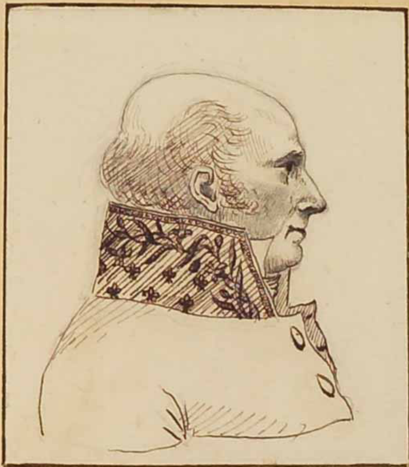
Le front de Bastard. Mars 1819