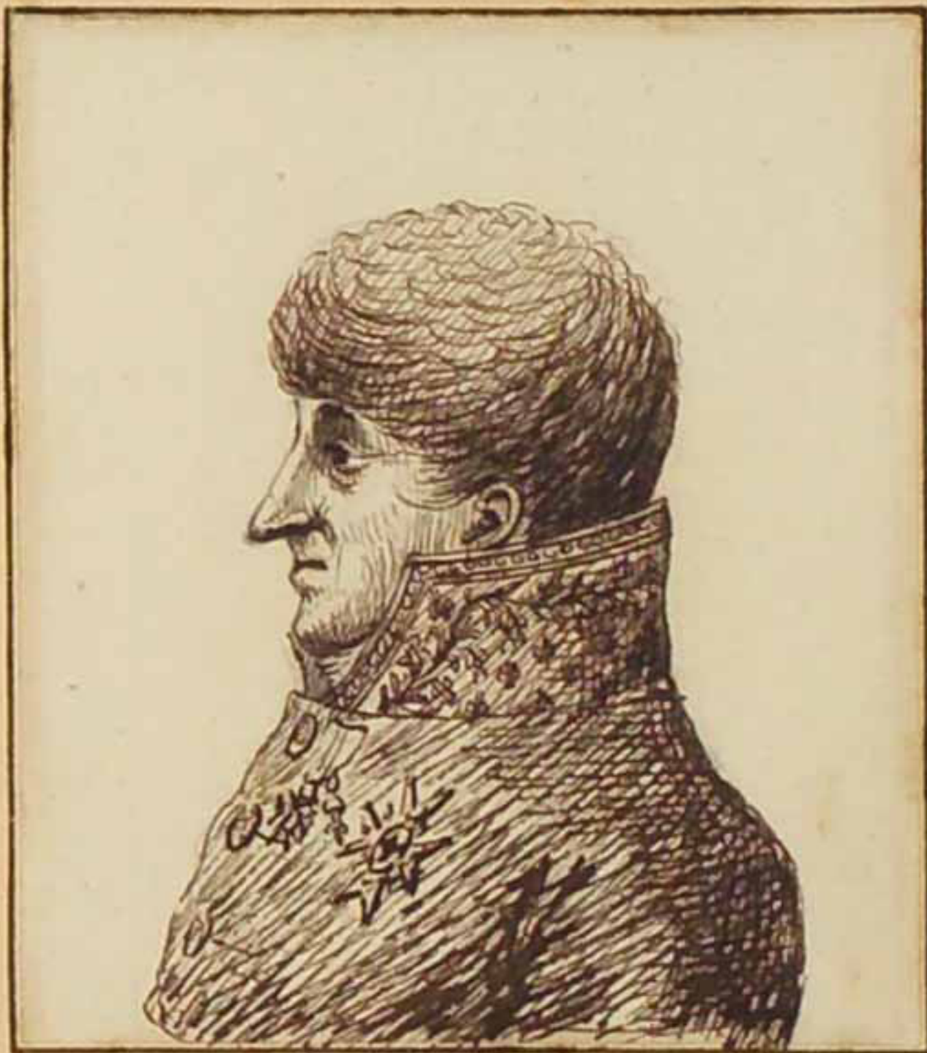
Le Duc d'Uzès. Juin 1814.