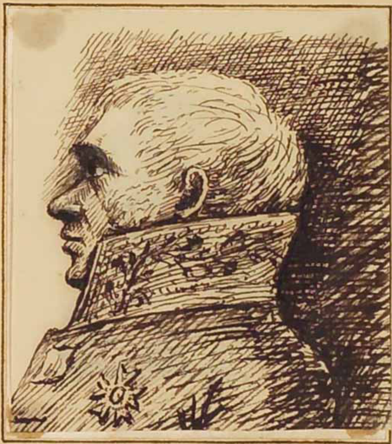
Le Marquis de Lamoignon. juin 1814