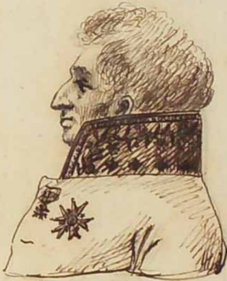
Le Comte Molliou. Mars 1819.