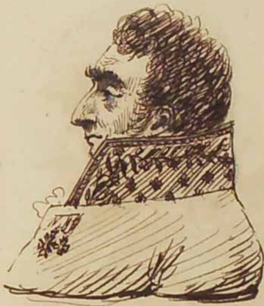
Le Marquis de Choiseuil Gouffier. Aout 1815.