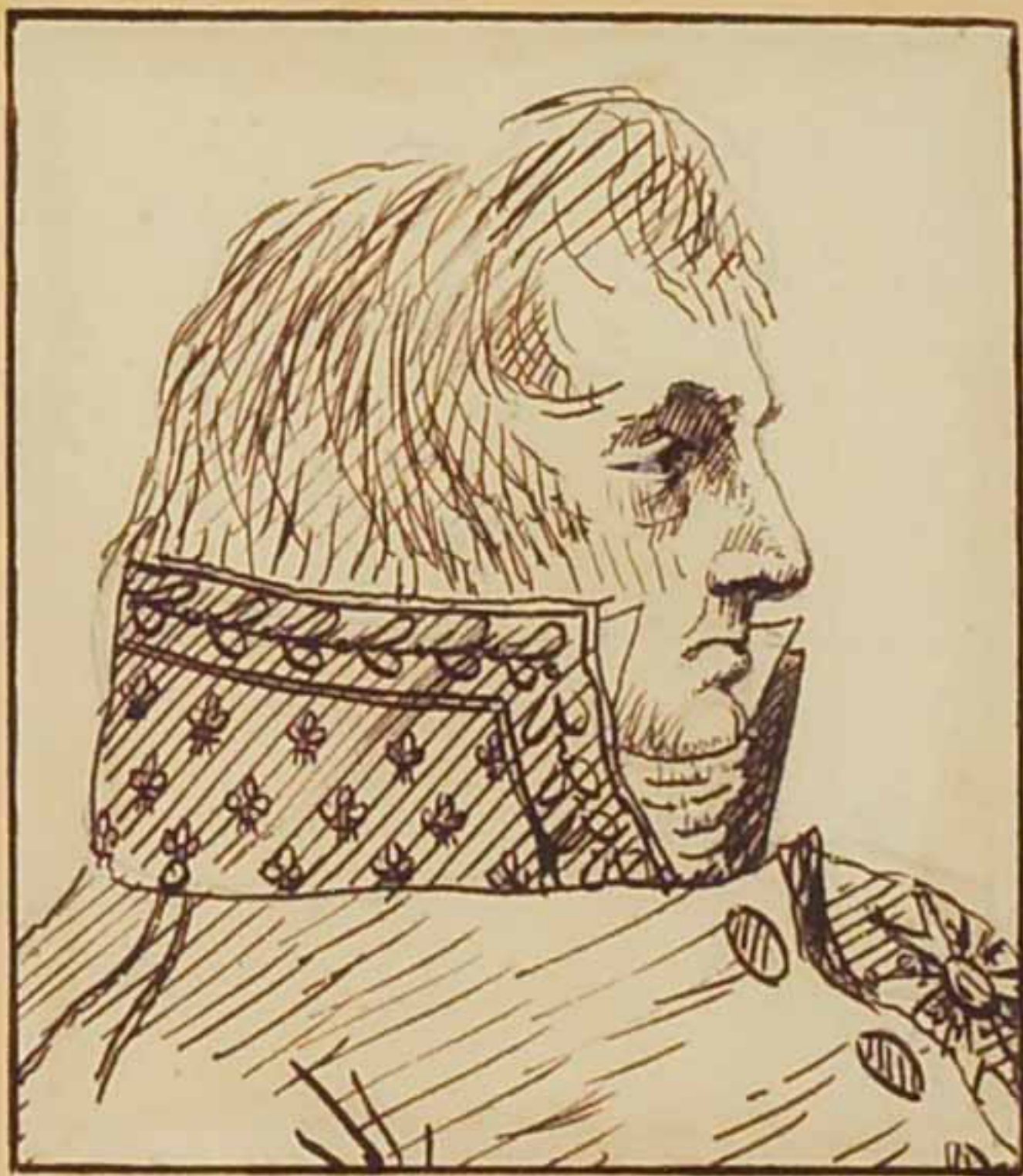
Le Maréchal Lefevre. Mars 1819.