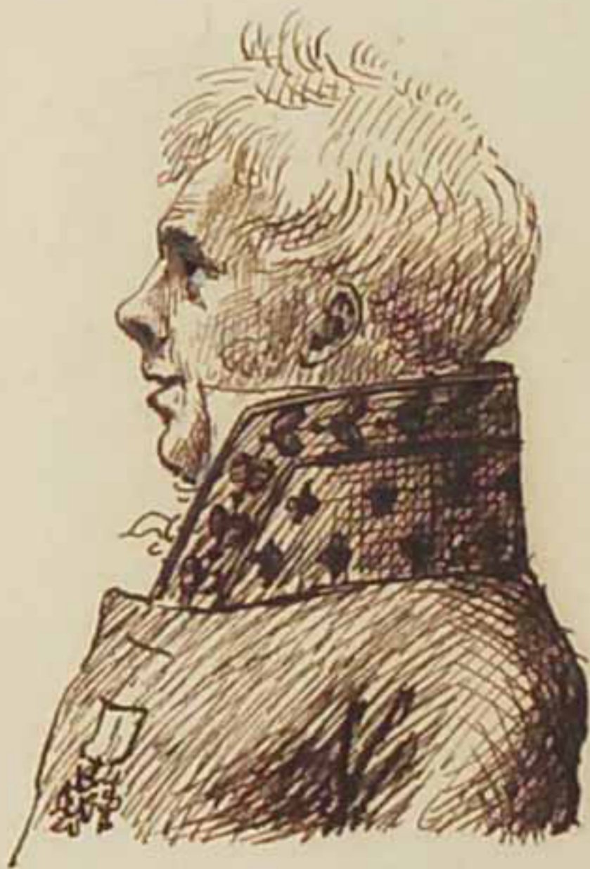
Le Comte d'Haussonville Aout 1815.