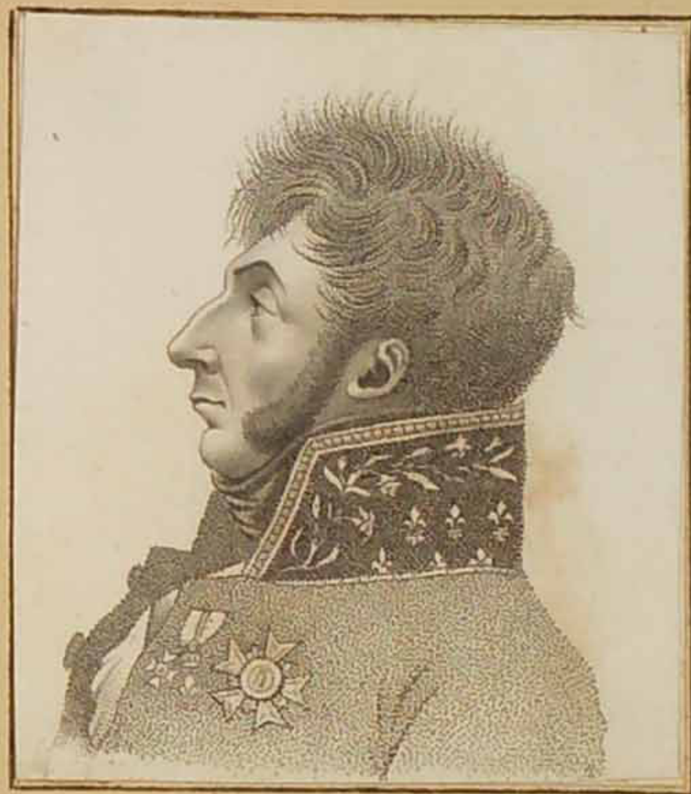
Le Général Comte Chaparide. Mars 1819