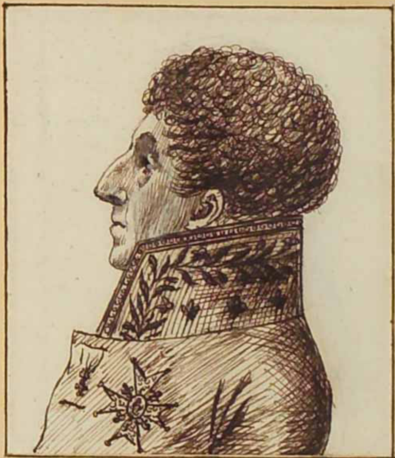
Le Comte de Durnfort. Aout 1815.