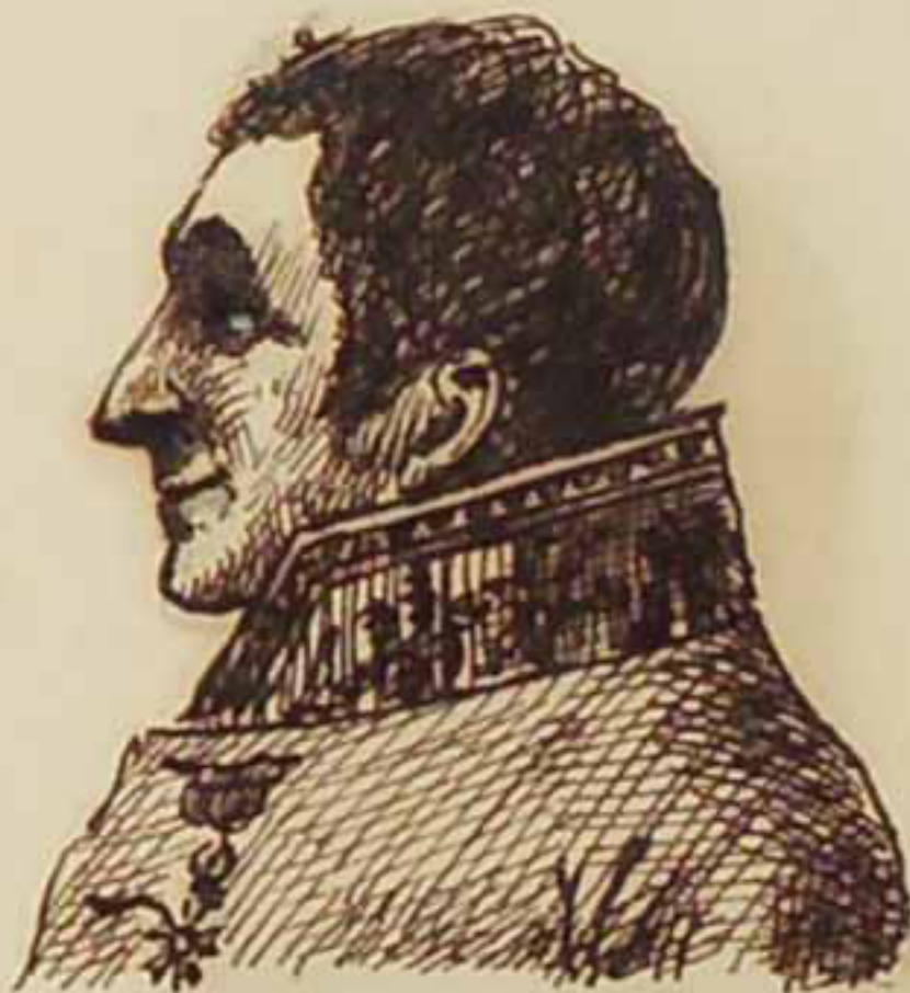
Léon de Broglie juin 1814.