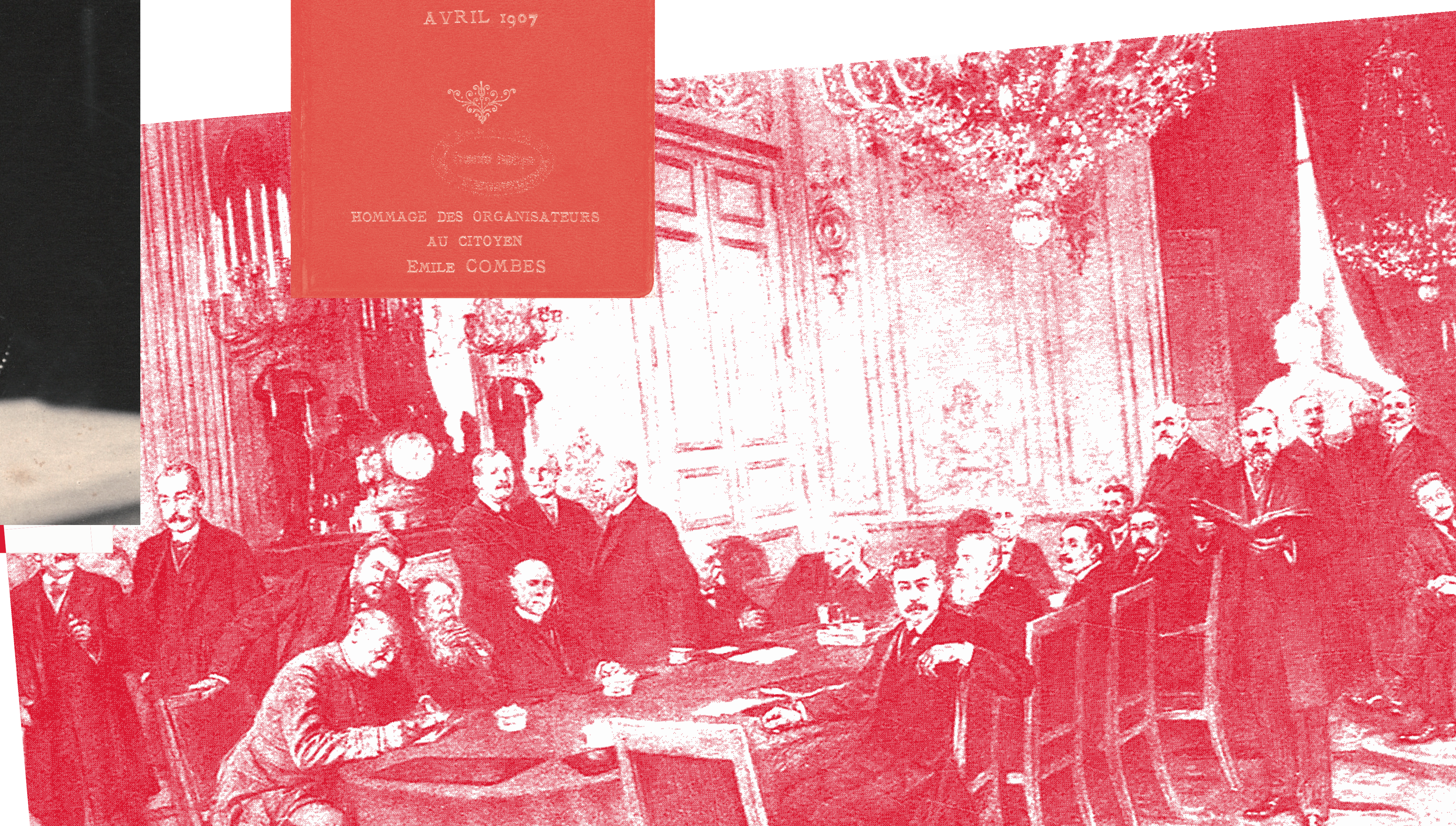
D'après "La première réunion du ministère Briand à l'Élysée", carte postale issue de L'Illustration, 1915, fonds Lefébure