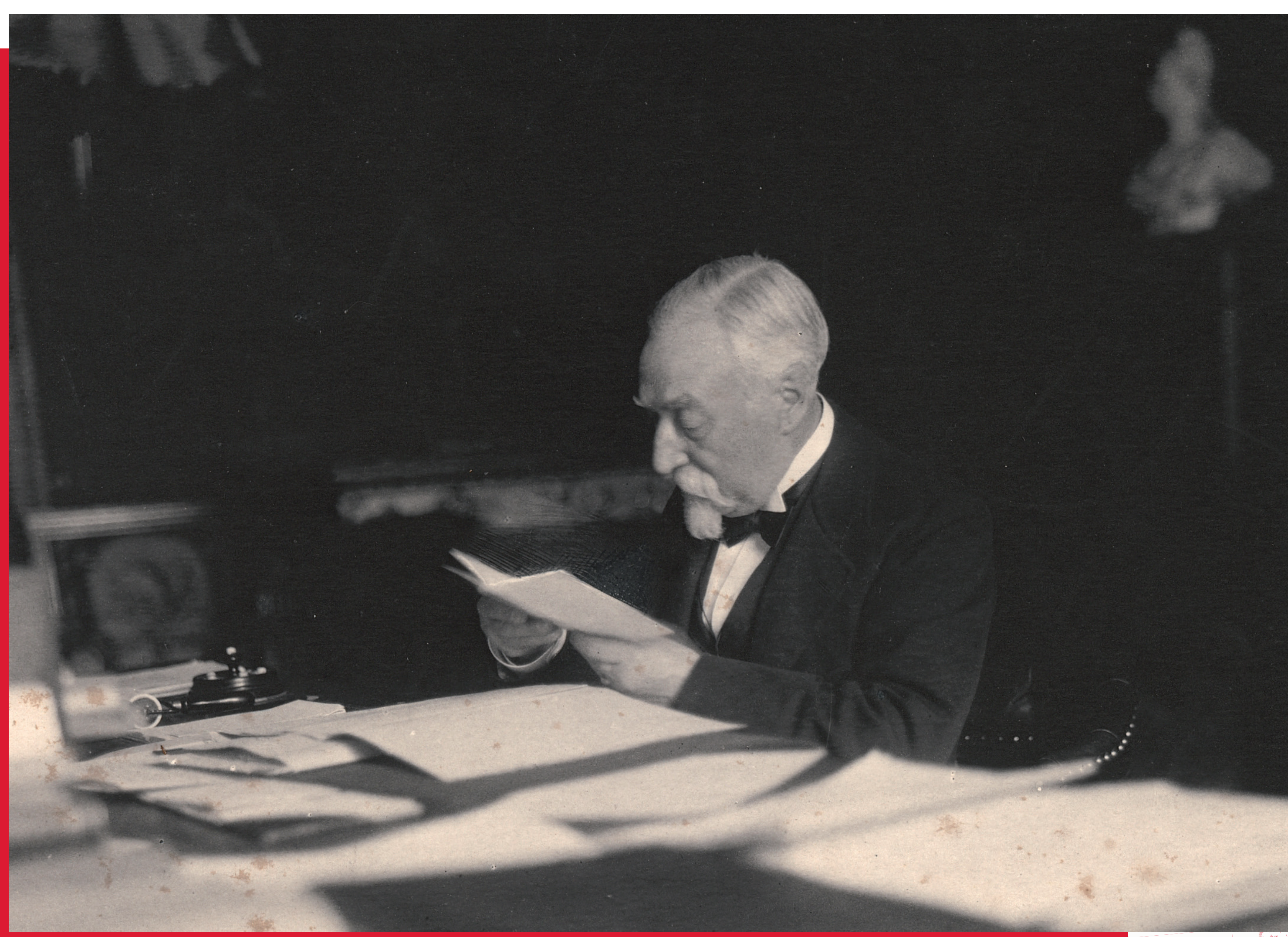
Portrait d'Émile Combes, sd

avec l'aide de proches, et notamment de son fils Edgar qui est son secrétaire de cabinet lorsqu'il occupe le ministère de l'Intérieur. Émile Combes met aussi à profit les structures partisans qu'il anime, le groupe de la Gauche démocratique au Sénat, puis le parti radical qu'il dirige en 1911. En dépit d'une nouvelle entrée au gouvernement en 1915, à 80 ans, il joue un rôle plus effacé à partir de la Première Guerre mondiale, affaibli par les soucis de santé et les deuils familiaux.