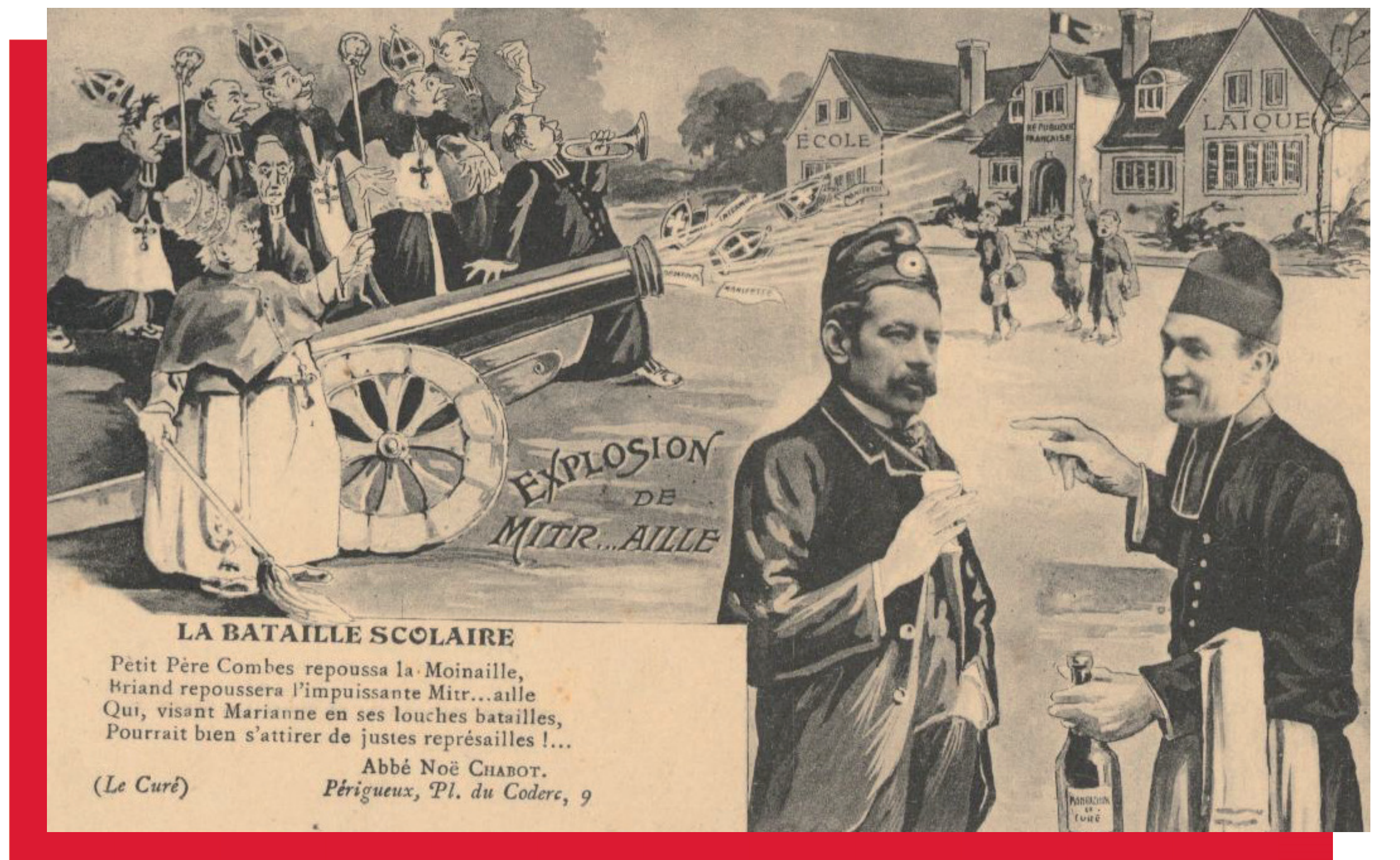
«La bataille scolaire», carte postale, [1902-1905].