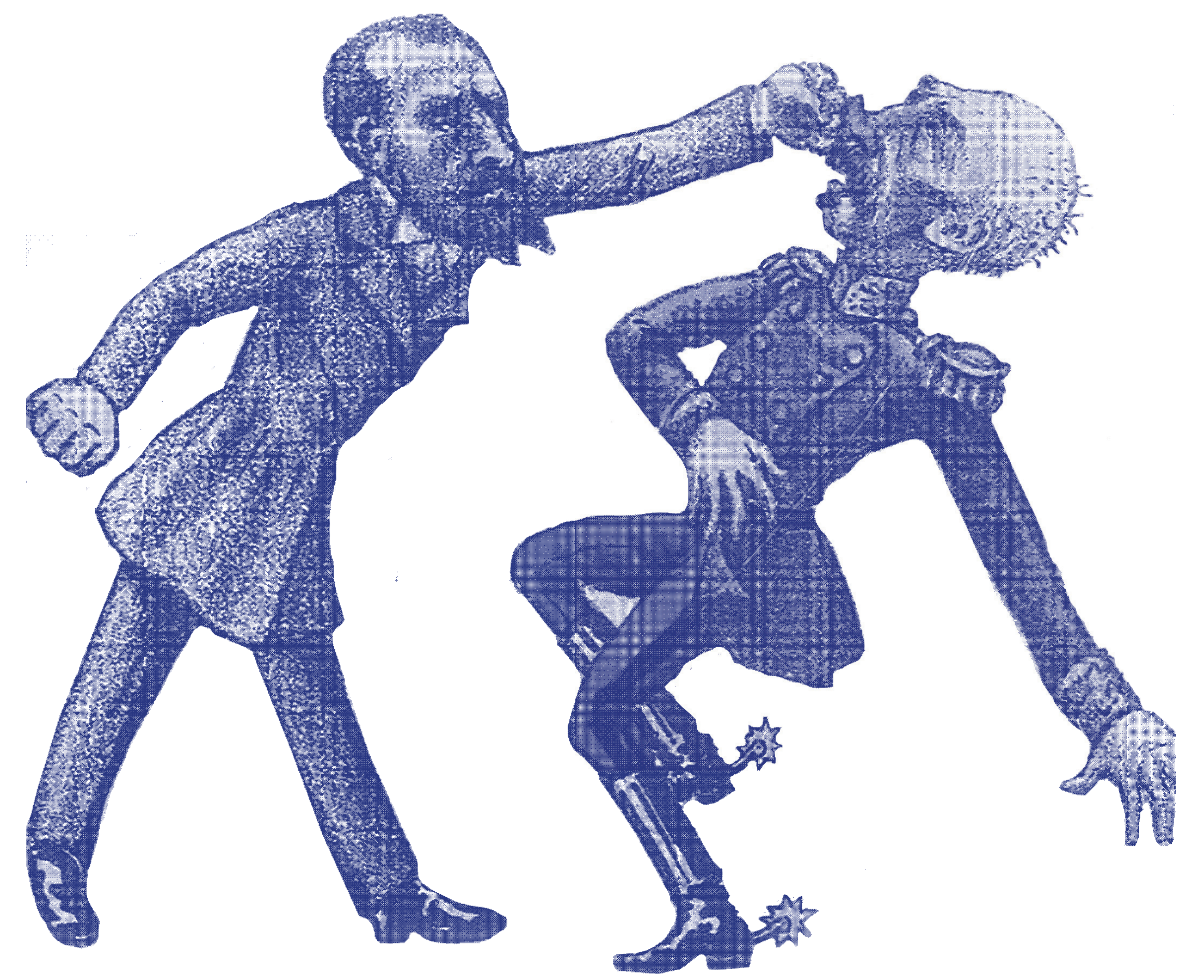
D'après «Mœurs parlementaires, La Flèche n°76, [1904-1905], fonds Lefebure

La lutte entre les deux France a une dimension électorale, mais passe aussi par des affrontements plus violents. Révolutions, guerres civiles ou coups d'État sont la cause des changements de régime au cours du 19 e siècle. La Commune de Paris en 1871 en constitue le dernier épisode, particulièrement sanglant. Le retour de la violence de masse reste néanmoins redouté lors des crises ultérieures. Jusqu'à la Première Guerre mondiale, la droite nationaliste conteste avec véhémence le régime républicain lors de l'épisode boulangiste à la fin des années 1880 ou durant l'affaire Dreyfus de 1894 à 1906.