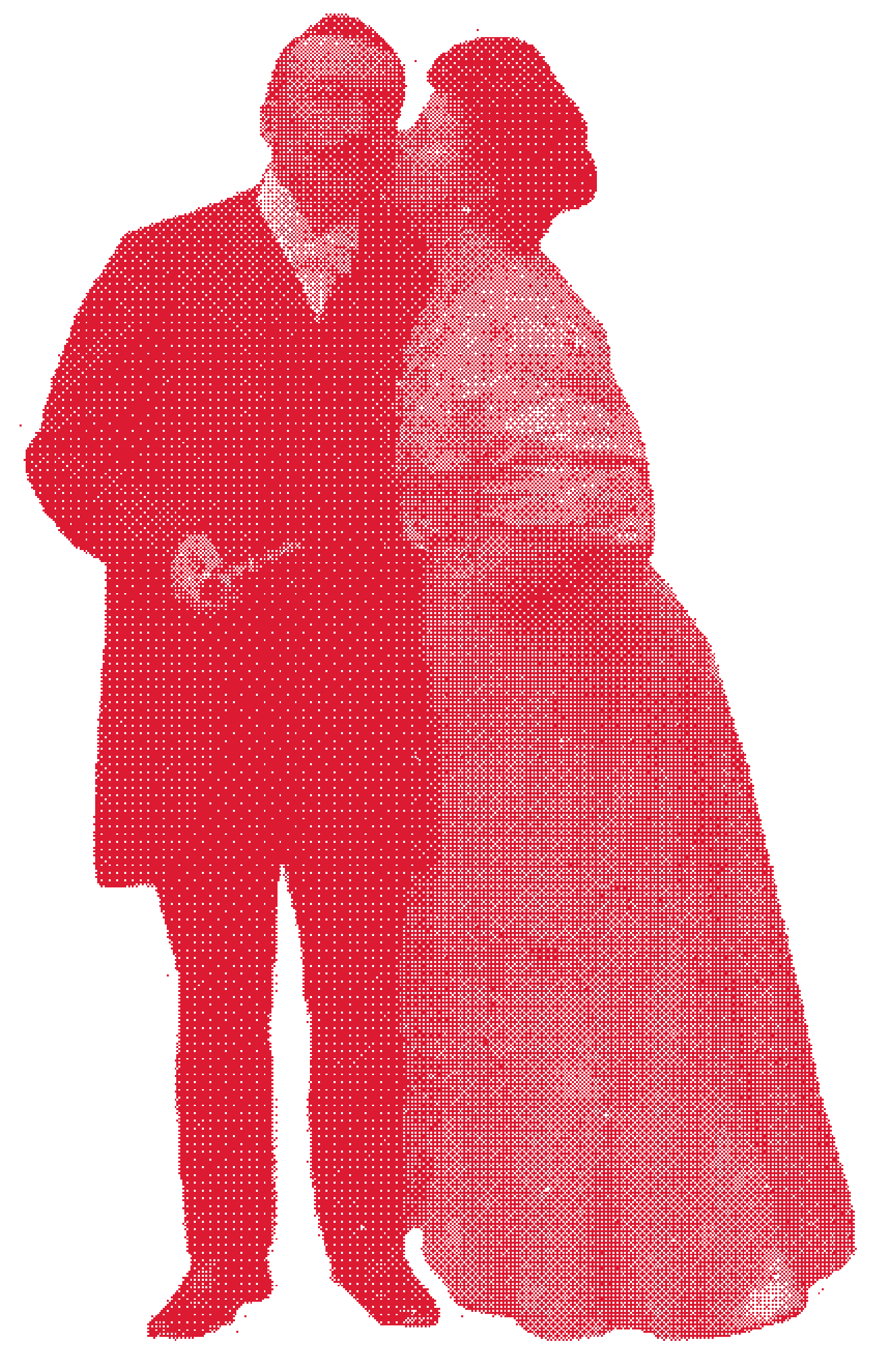
D'après photographie d'Édgar Combes et de sa sœur, 1906. Archives municipales de Pons

Émile Combes incarne une France rurale qui connaît son apogée démographique entre le Second Empire et le début des années 1900.