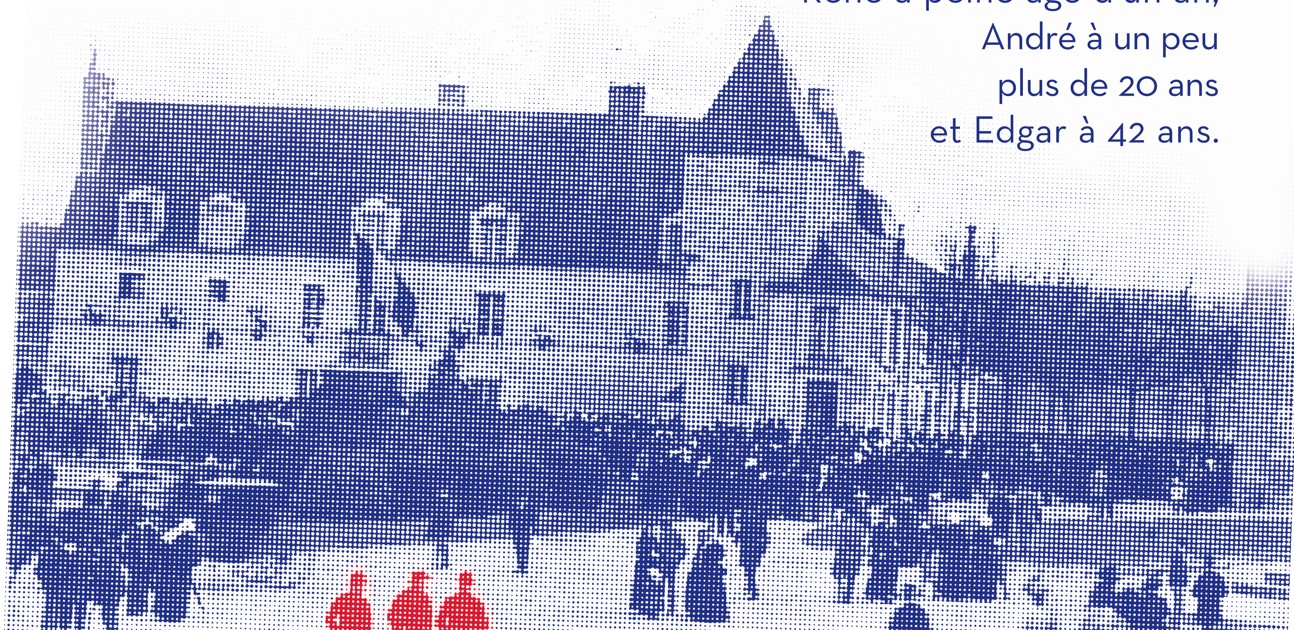
D'après carte postale de « Pons, la mairie, jour de réception par M. Combes », sd, fonds Lefebvre