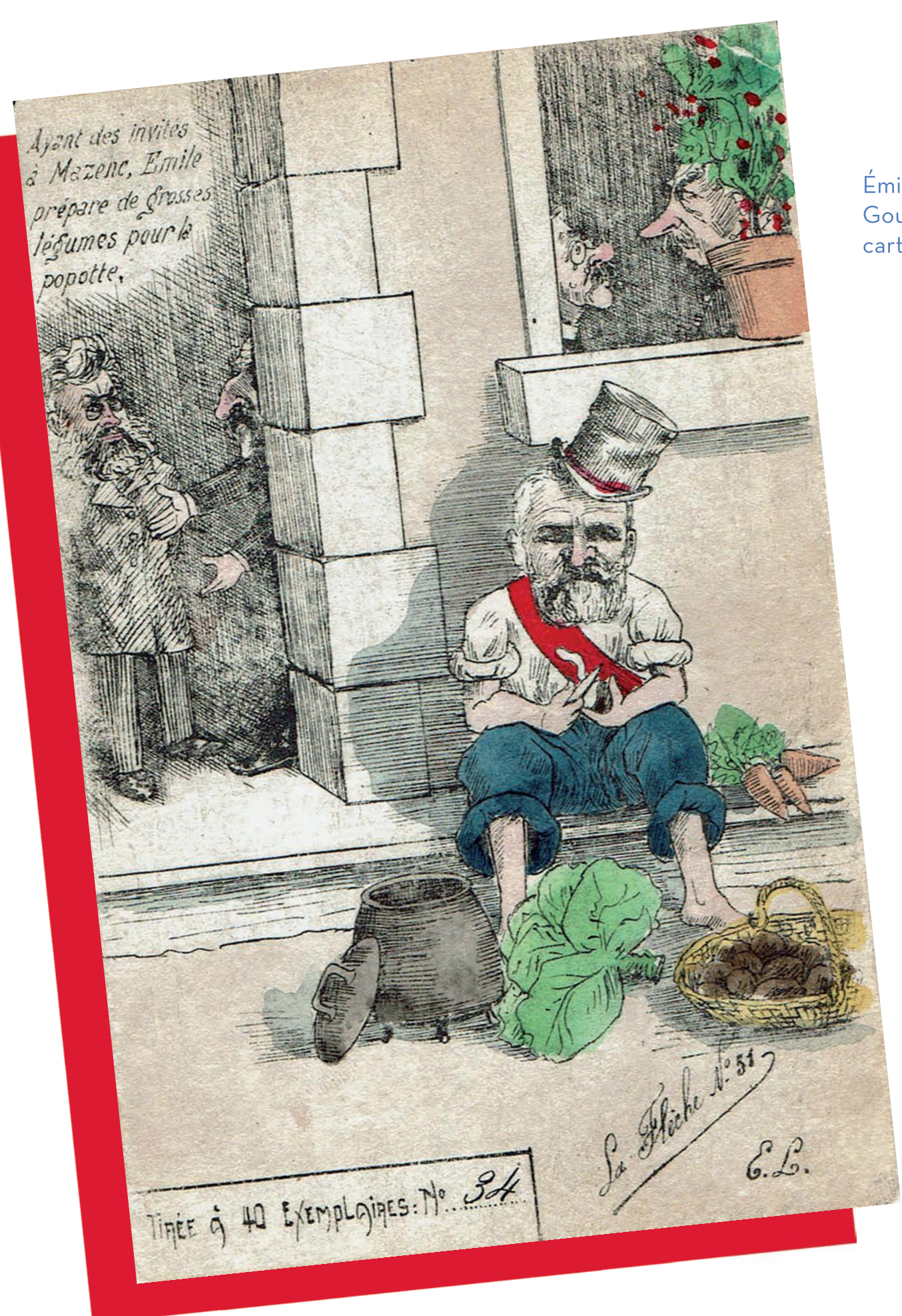
Émile Loubet recevant les membres du Gouvernement Combes à la Bégude de Mazenc, carte postale, 1903, fonds Lefebvre.