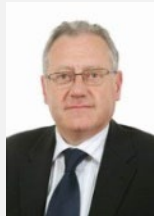
Marc LAMÉNIÉ Rapporteur spécial Sénateur (apparenté Les Républicains) des Ardennes

Réunie le mardi 17 octobre 2023, sous la présidence de M. Claude Raynal, président, la commission des finances a décidé de proposer au Sénat l'adoption sans modification des crédits de la mission. Elle a également proposé d'adopter un amendement à l'état G tendant à créer un nouvel indicateur de performance.